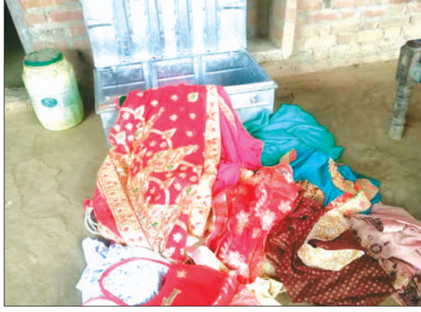
चोरी के बाद बिखरा सामान