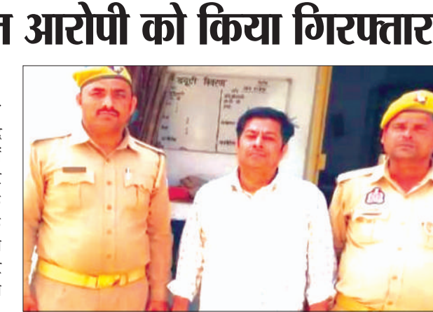
पुलिस हिरासत में आरोपी