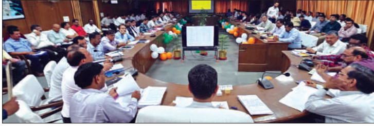
बैठक लेते जिलाधिकारी व मौजूद अधिकारी व कर्मचारी