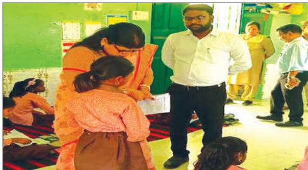
छात्र से किताब पढ़वाती राज्य महिला आयोग की सदस्य

सदस्य ने बुढ़नामऊ में प्राथमिक विद्यालय एवं आंगनवाड़ी केंद्र का निरीक्षण किया। जहाँ सब कुछ ठीक पाया गया। उन्होंने आंगनवाड़ी केंद्रों में