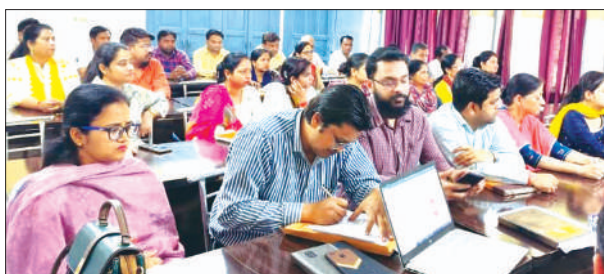
बैठक में मौजूद लोग