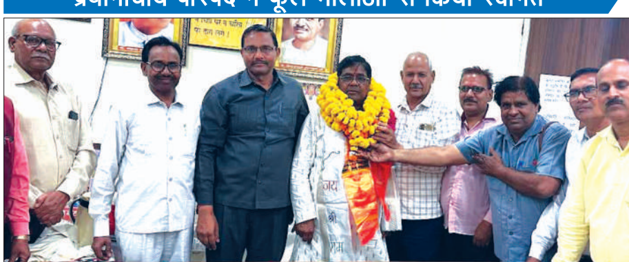
जिलाध्यक्ष का स्वागत करते प्रधानाचार्य परिषद के पदाधिकारी

प्रधानाचार्य परिषद ने फूल मालाओं से किया स्वागत