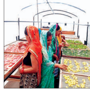
प्रशिक्षण के दौरान मौजूद समूह की महिलाएँ