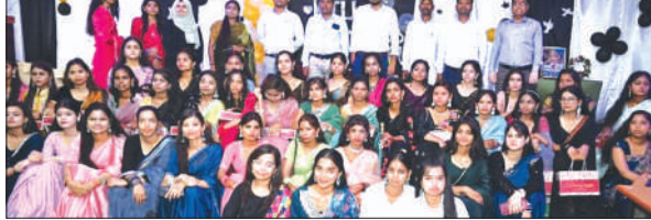
फेयरवेल पार्टी के दौरान मौजूद छात्राओं व मौजूद शिक्षक