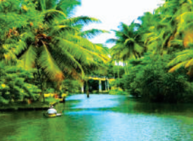
रूतों के साथ भीर और मोहम्मदी जैसे क्षेत्रों में ईको टूरिज्म की नई संभावनाओं को विकसित किया जा रहा है। स्थानीय लोगों को गाइड, रेस्टोरेंट संचालक के रूप में प्रशिक्षित कर स्थानीय रोजगार को भी बढ़ावा दिया जाएगा। इन प्रयासों का परिणाम है कि यूपी में पिछले वर्षों में ईको टूरिज्म के पर्यटकों की संख्या में तीव्र वृद्धि हुई है। सीएम योगी के विजन के मुताबिक उत्तर प्रदेश को ईको टूरिज्म के

यूपी में पिछले वर्षों में ईको टूरिज्म के पर्यटकों की संख्या में तीव्र वृद्धि समृद्धि न्यूज़ लखनऊ। मुख्यमंत्री योगी आदित्यनाथ के विजन के मुताबिक वन एवं वन्य जीव विभाग उत्तर प्रदेश को ईको टूरिज्म के हब के तौर पर विकसित कर रहा है। वन एवं वन्य जीव विभाग के संबंधित अधिकारियों ने बताया कि विभाग प्रदेश के प्राकृतिक सौंदर्य और जैव विविधता को संरक्षित करते हुए पर्यटकों को सफर योजना शुरू की जा रही है। प्रदेश के टाइगर रिजर्वों में नये सफारी