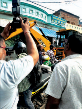
कार्रवाई की गई। इसी निरीक्षण के दौरान महापौर ने एक बड़े नाले की सफाई की