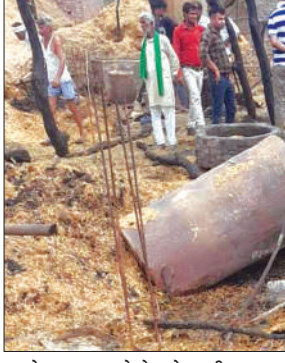
जले सामान को देखते ग्रामीण