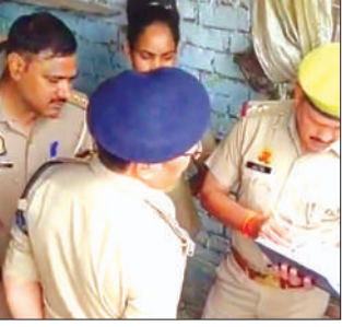
मौके पर जांच करते सीओ व थाना प्रभारी