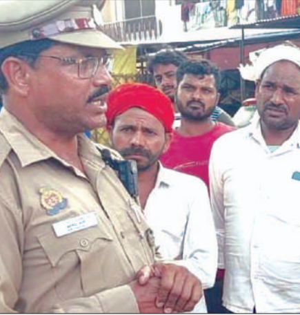
छिब्रामऊ, कन्नौज