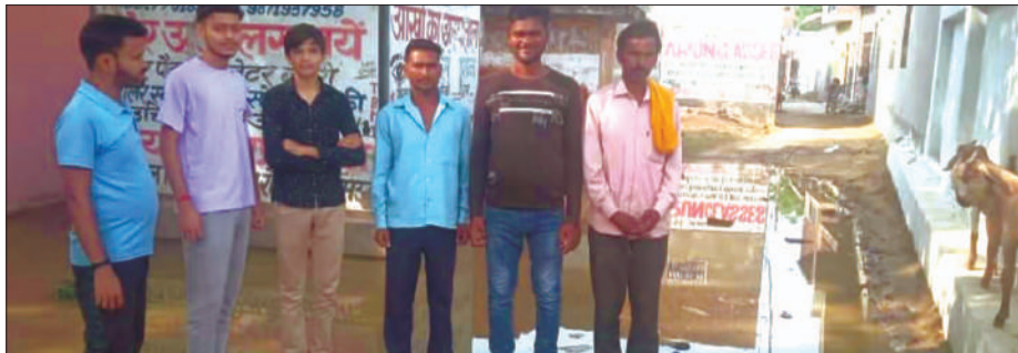
छिब्रामऊ, कन्नौज, समृद्धि न्यूज़।

नगर के मोहल्ला गणेश चौधरी स्थित शक्तिपीठ गमा देवी के सामने बरसाती पानी से सड़क पर जल जमाव हो गया जिससे यहाँ आने वाले बसें श्रद्धालुओं को परेशानी का सामना करना पड़ रहा है। सड़क से किसी प्रकार की जल निकासी व्यवस्था नहीं है। इस संबंध में