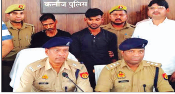
घटना का खुलासा करते एसपी, सीओ व पुलिस हिसासत में आरोपित