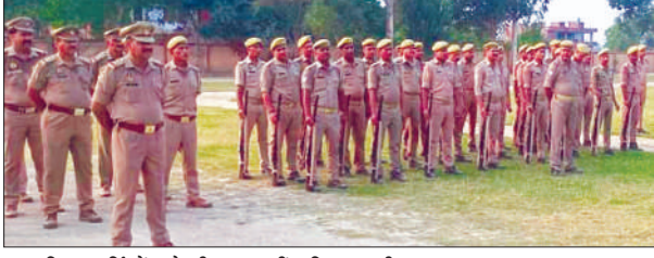
पुलिसकर्मियों को ब्रीफ करती पुलिस अधीक्षक