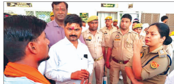
प्रदर्शन करीयों को समझाती सीओ