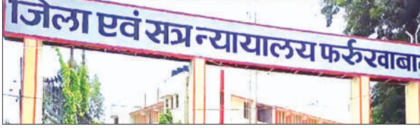
जनपद न्यायालय फर्रुखाबाद

जानकारी के अनुसार बीते दो वर्षों पूर्व कोतवाली कायमगंज क्षेत्र के एक ग्राम निवासी युवक ने पुलिस को दी गई तहरीर में बताया 03 अगस्त 2023 को गुरुवार समय लगभग 9:30 बजे मेरी पुत्री अपने घर से