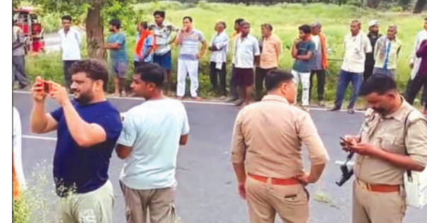
मौके पर मौजूद पुलिस व ग्रामीण