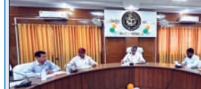
बैठक लेते डीएम

रानी लक्ष्मीबाई सम्मान कोष की जिला संचालन समिति की बैठक संपन्न