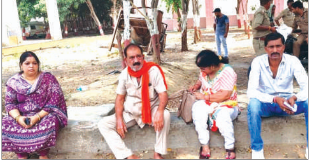
मोर्चरी के बाहर गमगीन बैठे मृतक के परिजन

राजकीय मेडिकल कॉलेज के इमरजेंसी वार्ड में शुक्रवार की सुबह एक कैदी की उपचार के दौरान मौत हो गई। कैदी को शुक्रवार को ही जिला जेल से हालत गंभीर होने पर मेडिकल कॉलेज लाया गया था। कैदी की मौत का समाचार मिलते ही परिजन भी मेडिकल कॉलेज पहुंच गए। परिजनों ने जिला जेल के अफसरों पर लापरवाही के आरोप जड़े हैं।