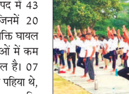
योग करने एनसीसी कैडेट्स

बताया कि माह मई 2025 में जनपद में 43 सड़क दुर्घटनायें घटित हुई हैं, जिनमें 20 व्यक्तियों की मृत्यु हुई है तथा 24 व्यक्ति घायल हुये हैं। इनमें से 33 सड़क दुर्घटनाओं में कम से कम एक दो पहिया वाहन शामिल है। 07 दुर्घटनाओं में शामिल दोनों वाहन दो पहिया थे, जिनमें 05 व्यक्तियों की मृत्यु हुई व 04 व्यक्ति घायल हुये। एआरटीओ ने बताया कि रंग साइड ड्राइविंग के मामलों में भारतीय न्याय संहिता की धारा 281 के अन्तर्गत भी कार्यवाही की जा सकती है जिसमें छः माह तक का कारावास या एक हजार तक का जुर्माना अथवा दोनों हो सकते हैं। रंग साइड ड्राइविंग के कारण मृत्यु होने पर किसी भी प्रकार के मुआवजे हेतु कोई भी दावा शासन को नहीं भेजा जायेगा। उन्होंने छात्रों को सम्बोधित करते हुये राह-नवीर योजना की जानकारी दी तथा बताया कि सड़क परिवहन एवं राजमार्ग मंत्रालय द्वारा 21 अप्रैल 2025 से राह-वीर योजना प्रारम्भ की गयी है,