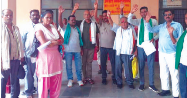
ज्ञापन देने के बाद मौजूद भाकियू स्वराज संगठन के पदाधिकारी

मांग पत्र में जनपद की तहसील कायमगंज के अंतर्गत गांव बहवलपुर मिस्तनी से लेकर ढाईघाट तक गंगा नदी के दक्षिणी किनारे गंगा की बाढ़ से जल को रोकने के लिए बंधा बनवाया जाए। जिससे किसानों की फसलों बाढ़ से बर्बाद ना हों, किसानों के द्वारा उत्पादित फसलों का लाभात मूल्य से दो गुना एमएसपी निर्धारित