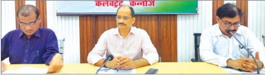
अधिकारियों के साथ बैठक करते जिलाधिकारी

जिलाधिकारी ने 860 नवजात शिशुओं के सप्ले सौरिख में 03, तालग्राम एवं उमदा में एक-एक बच्चा, कुल 05 नवजात शिशुओं का हेम.बी. वैकसीनेशन को यू विन पोर्टल पर डेटा फीडिंग न किए जाने पर