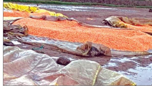
खेतों में फैली किसानों की मक्का

जिसके चलते शुक्रवार को दिन में भी भीषण गर्मी होने के बाद एकाएक 3:00 बजे के लगभग बरसात होने लगी। जिससे ठंडा मौसम तथा ठंडी हवाओं से लोगों को गर्मी में राहत मिली, वहीं जिन किसानों के खेत में मक्का फैली हुई है उनके चेहरे मुरझाये नजर आए, लेकिन सभी लोगों को गर्मी से राहत