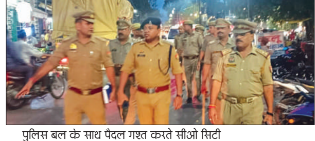
पुलिस बल के साथ पैदल गश्त करते सीओ सिटी