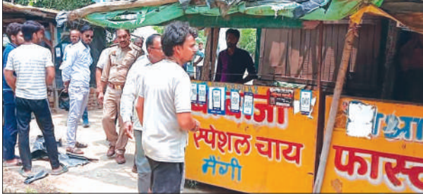
अतिक्रमण हटवाती पुलिस

इस दौरान कई दुकानदार जो वर्षों से अपनी-अपनी दुकानें लगाकर अतिक्रमण किये थे, उनकी दुकानों को हटवाया गया। साथ ही कई दुकानदारों का चालान किया गया। जिसमें धर्मवीर