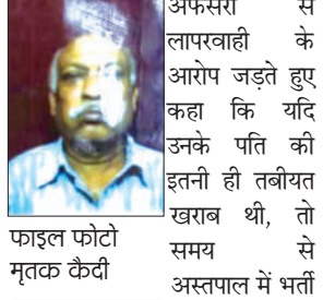
फाइल फोटो मृतक कैदी