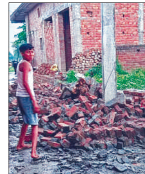
गिरी दीवार की ईंटों को हटाता ग्रामीण