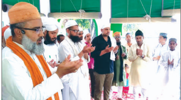
दरगाह पर दुआ करते अकीदतमंद