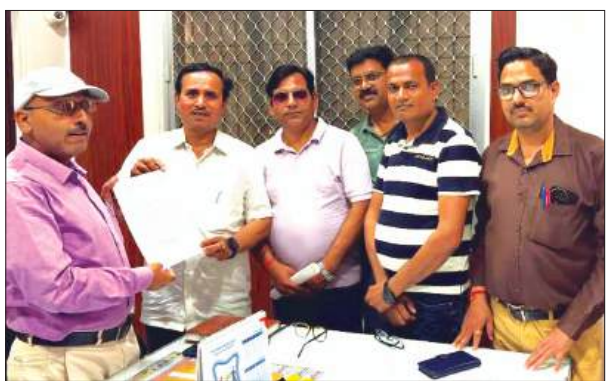
ज्ञान चौपटे शिक्षकगण

शिक्षक महासंघ के आवाहन पर पुराने शिक्षकों पर टीईटी की अनिवार्यता के सम्बन्ध में विरोध प्रदर्शन किया जा जायेगा। प्रांतीय नेतृत्व के आवाहन पर जनपद में भी 13 अप्रैल को समय अपराह्न 02:30 बजे बी.एस.ए. ऑफिस पर समस्त शिक्षक एकत्रित होकर शान्तिपूर्वक विशाल बाइक रैली निकाली जायेगी जो बीएसए ऑफिस से जिला जेल चौड़ा होती हुई फतेहगढ़ चौराहे से जिलाधिकारी कार्यालय होती हुई पुनः बीएसए ऑफिस पर समाप्त होगी।