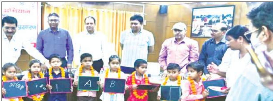
बच्चों को हस्तांतरित करते डीएम

जिसमें जनपद के विभिन्न अधिकारियों, शिक्षकों एवं गणमान्य व्यक्तियों की गरिमामयी उपस्थिति रही। कार्यक्रम का शुभारंभ मुख्यमंत्री के संबोधन एवं अभियान के सजीव प्रसारण के अवलोकन से हुआ। डीएम ने कक्षा 1 से कक्षा 8 तक के छात्र-छात्राओं को प्रतीकात्मक रूप से