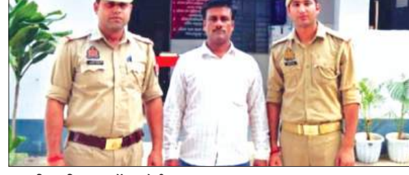
पुलिस हिरासत में आरोपी