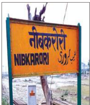
नीब करोरी रेलवे स्टेशन