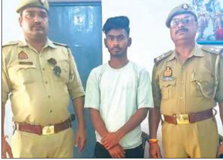
पुलिस की गिरफ्त में लूट का आरोपी