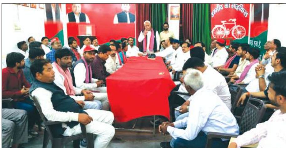
बैठक में मौजूद सपा नेता

संगठनों को निर्देश दिए गए कि जिन फ्रंटल अध्यक्षों ने अभी तक विधानसभा और नगर कमेटी नहीं बनाई है वह लोग 8 दिनों के अंदर अपनी कमेटीयां बूथ सहित बनाकर जिला कार्यालय को प्रेषित करें अन्यथा संबंधित प्रदेश अध्यक्ष से कहकर उनकी छुट्टी करवाई जाएगी। बूथ लेवल पर पार्टी को मजबूत किया