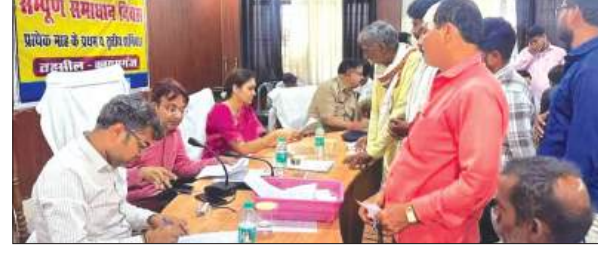
शिकायतों सुनते एसडीएम व विधायक

उन्होंने कहा कि अधिकारी जनता की शिकायतों को गम्भीरता से सुने और निर्धारित समय सीमा के अन्तर्गत उसका निस्तारण करें। एसडीएम ने