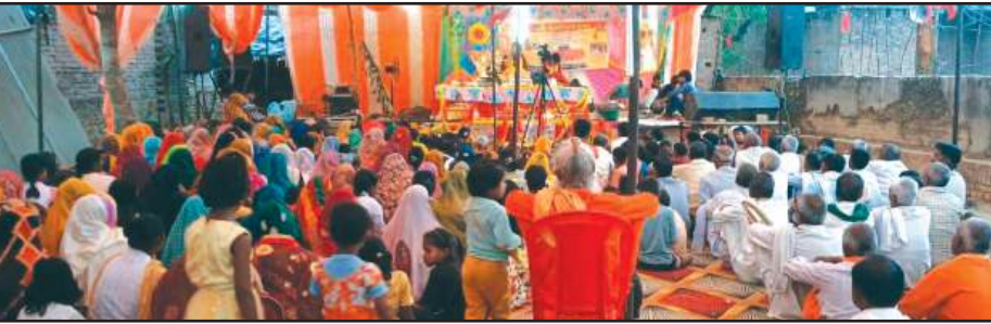
कथा का रसगान करते भक्तगण

और उनके एक-एक करके सात बच्चों को मार डाला। भाद्रपद मास की कृष्ण अष्टमी को भारी बारिश और तृफानी रात में भगवान श्री कृष्ण का जन्म हुआ। कृष्ण के जन्म लेते ही कारागार के पहरेदार सो गए, जेल के