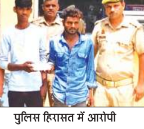
पुलिस हिरासत में आरोपी