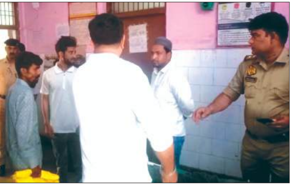
अस्पताल में मौजूद परिजन व पुलिस

कायमगंज, समृद्धि न्यूज़। युवक ने ट्रेन के आगे कूदकर अपनी जीवन लीला समाप्त कर ली। जानकारी होने पर परिजनों में कोहराम