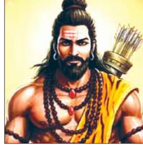
फर्रुखाबाद, समृद्धि न्यूज़।

भगवान विष्णु ने परशुराम अंश के रूप में उस भृगु कुल में अवतार लिया। जिस भृगु के पाद-प्रहार को अपने स्वःस्थल पर सहा। भगवान परशुराम का जन्मोत्सव हिन्दू धर्म में वैशाख