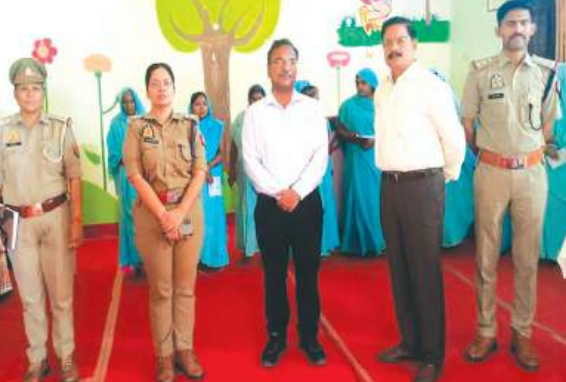
निरीक्षण के दौरान एसडीएम व सीओ यातायात

पुलिस अधीक्षक आरती सिंह के निर्देशन में मिशन शक्ति अभियान 5.0 के अंतर्गत उपजिलाधिकारी फर्रुखाबाद एवं क्षेत्राधिकारी (यातायात) ने नारी बंदी गृह का औचक निरीक्षण किया। अधिकारियों ने महिला बंदियों से संवाद कर उनकी समस्याओं को सुना और विधिक अधिकारों के प्रति जागरूक कर सम्बन्धित को आवश्यक दिशा निर्देश दिए गए। गुरुवार को मिशन शक्ति अभियान 5.0 के अंतर्गत उपजिलाधिकारी फर्रुखाबाद एवं