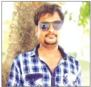
मृतक का फाइल फोटो

मच गया। सूचना पर पहुंची पुलिस ने शव का पंचनामा भरकर पोस्टमार्टम के लिए भिजवाया। जानकारी के अनुसार कोतवाली क्षेत्र के गाँव अताईपुर जदीद मोहल्ला