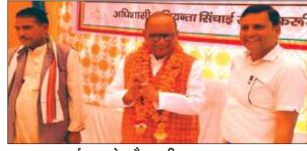
कार्यक्रम के दौरान विधायक व अन्य