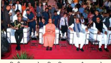
आधुनिकीकरण को शामिल किया गया है। यह शो प्रतिदिन शाम के समय स्मृतिका युद्ध स्मारक में आयोजित किया जाएगा और जल्द ही इसे आम जनता के लिए भी खोल दिया जाएगा। इस मल्टीमीडिया प्रस्तुति में भारत के प्रमुख युद्धों का एक

रक्षा मंत्री राजनाथ सिंह ने लखनऊ छावनी स्थित सेना के मध्य कमान के स्मृतिका युद्ध स्मारक में एक अत्याधुनिक लेजर, लाइट और साउंड शो का उद्घाटन किया। लगभग 30 मिनट का यह हिंदी मल्टीमीडिया शो, उन्नत प्रोजेक्शन, साउंड और लाइटिंग तकनीकों के माध्यम से भारतीय सेना के इतिहास, उसकी ऑपरेशनल उपलब्धियों और राष्ट्र-निर्माण में उसके योगदान को बयां करता है। यह शो भारतीय सशस्त्र बलों की वीरता और विरासत को समर्पित एक श्रद्धांजलि है। इसकी कहानी में भारत के प्रमुख युद्धों और ऑपरेशन्स, सेंट्रल कमांड की ऐतिहासिक भूमिका, अवध क्षेत्र की वीरता और आत्मनिर्भर भारत की परिकल्पना के अनुरूप समकालीन सैन्य