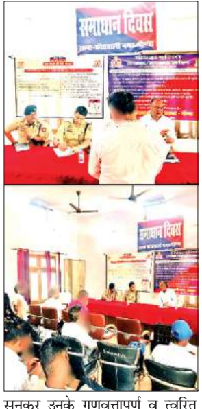
सुनकर उनके गुणवत्तापूर्ण व त्वरित निस्तारण कराया गया। इस दौरान राजस्व एवं पुलिस के अधि०/कर्मचारीगण उपस्थित रहे।