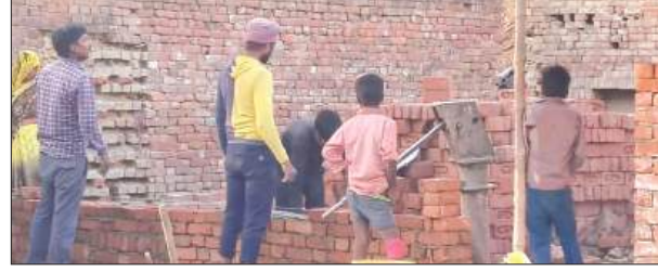
हैडपंप की जगह पर हो रहा निर्माण