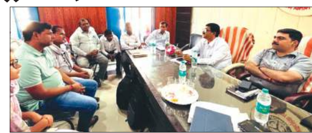
ग्रामीणों को जानकारी देते डीएम