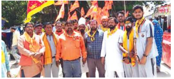
शोभायात्रा में भाग लेते पदाधिकारी

प्राणण में अधिवक्ताओं ने स्वागत किया और मिश्रण खिलाकर बधाई दी।