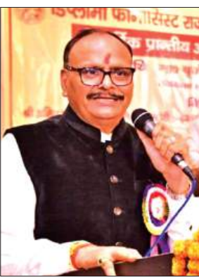
प्रस्ताव तैयार करने के निर्देश

लखनऊ, समृद्धि न्यूज़। प्रदेश के उप मुख्यमंत्री ब्रजेश पाठक शनिवार को इंदिरानगर में आयोजित दिल्लीमा फार्मासिस्ट राजपत्रित अधिकारी एसोसिएशन के द्विद्विदिनीय प्रांतीय अधिवेशन में शामिल हुए। इस अवसर ब्रजेश पाठक ने कहा कि फार्मासिस्ट चिकित्सा विभाग की अहम कड़ी हैं। वे स्वास्थ्य सेवा प्रणाली का एक अभिन्न अंग हैं। फार्मासिस्ट डॉक्टरों द्वारा लिखे गए नुस्खों के अनुसार मरीजों को सुरक्षित और सही दवाएं उपलब्ध कराते हैं। दवाओं के उपयोग, खुराक, दुष्प्रभावों और परस्पर क्रियाओं के बारे में मरीजों को परामर्श देते हैं। आपके लिए हमारे घर और दफ्तर के दरवाजे सदैव खुले हैं। उप मुख्यमंत्री ने कहा कि फार्मासिस्ट की भूमिका केवल मरीजों को दवा देना ही नहीं वरन मरीजों की सुरक्षा और सही उपचार सुनिश्चित करना है। उन्होंने कहा कि चिकित्सा एवं स्वास्थ्य विभाग में हम लोगों के दायित्व अलग हो सकते हैं लेकिन लक्ष्य हमारा एक ही है। प्रदेश के लोगों को सुरक्षित और उच्च गुणवत्तापरक इलाज उपलब्ध कराना हमारी सर्वोच्च प्राथमिकता है। ब्रजेश पाठक ने कहा कि फार्मासिस्ट हमारे परिवार का अभिन्न अंग हैं। उन्होंने नवनिर्वाचित एसोसिएशन के प्रबंधन को हार्दिक बधाई एवं उज्वल कार्यकाल की शुभकामनाएं दीं। उन्होंने कहा कि हमें संयुक्त रूप से अपने विभाग को प्रदेश और देश में नंबर वन बनाना है। वर्ष 2017 से पहले स्वास्थ्य विभाग की क्या स्थिति थी, यह किसी से छिपा नहीं है। आज हम सभी ने बहुत मेहनत से मरीजों को गुणवत्तापूर्ण इलाज उपलब्ध कराने की दिशा में महत्वपूर्ण