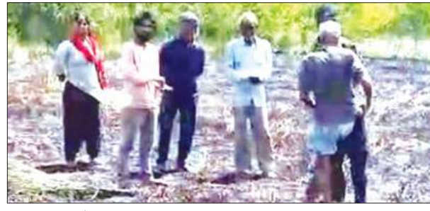
जली पड़ी गेहूं की फसल मौजूद किसान

शनिवार को तेज हवा के कारण खुले तार आपस में टकरा गए। तारों के टकराने से निकली चिंगारी सीधे खेत में खड़ी गेहूं की सूखी फसल पर