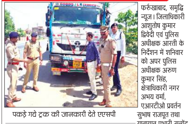
पकड़े गये ट्रक की जानकारी देते एसपी