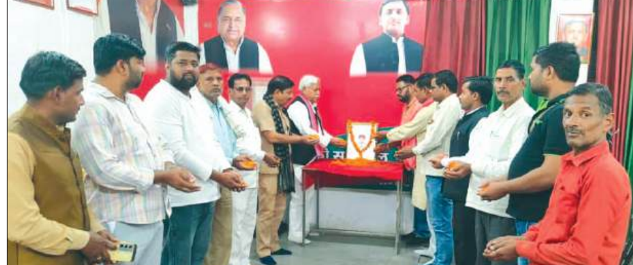
महात्मा फुले के चित्र पर पुष्प अर्पित करते पदाधिकारी