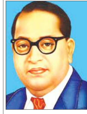
फर्रुखाबाद, समृद्धि न्यूज़।

भारत रत्न बाबा साहब डॉ. भीमराव अम्बेडकर का 135वां जन्मदिवस समारोह जनपद में धूमधाम से मनाया जायेगा। उनके पास नौ भाषाओं का ज्ञान था। 32 द्विग्रियों थीं, जो कि आज तक किसी ने प्राप्त नहीं कर पायीं। बाबा साहब डॉ. भीमराव अम्बेडकर को द सिंबल ऑफ नॉलेज के नाम से भी जाना जाता है। बाबा साहब ने इंग्लैंड, आयरलैंड, अमेरिका, कनाडा, जर्मनी, रूस, फ्रांस, आस्ट्रेलिया, जापान आदि 10 देशों का भ्रमण कर संविधान का अध्ययन किया था।