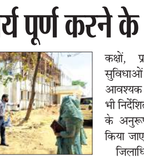
सत्र में समय से शैक्षणिक गतिविधियों का संचालन प्रारंभ किया जा सके। उन्होंने कहा कि कार्य में किसी भी प्रकार की लापरवाही या विलंब बर्दाश्त नहीं किया जाएगा। निरीक्षण के दौरान डीएम ने भवन की संरचना,