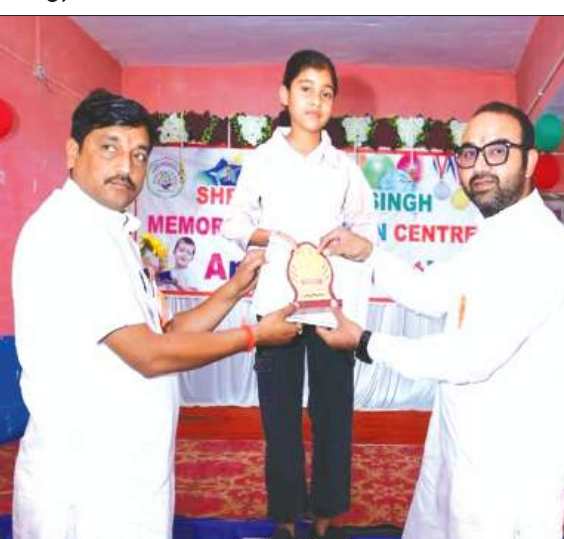
छात्रा को सम्मानित करते ब्लाक प्रमुख