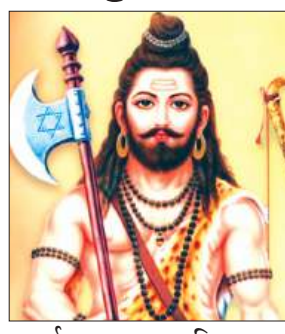
फर्रुखाबाद, समृद्धि न्यूज़।