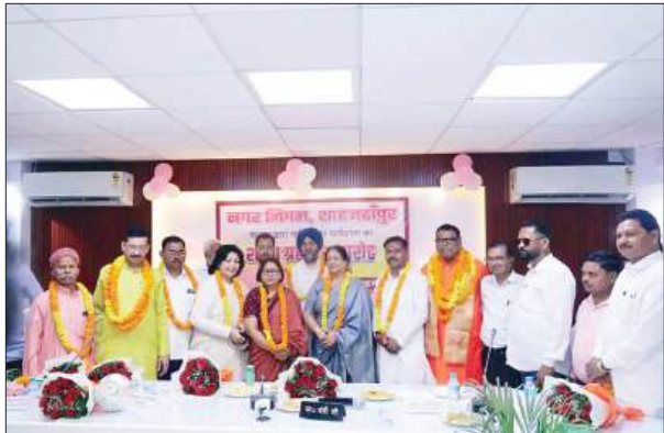
समस्त नामित पार्षदों को शुभकामनाएं देते हुए सन्देश दिया कि महानगर क्षेत्र शाहजहांपुर के विकास में अपना योगदान दें और अतिक्रमण मुक्त शहर बनाएं। महापौर एवं नगर आयुक्त द्वारा भी शुभकामनाएं देते हुए नगर निगम