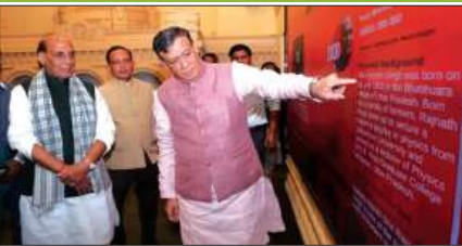
राजनाथ सिंह ने विधानसभा परिसर में विकसित विभिन्न आधुनिक सुविधाओं का निरीक्षण किया। उन्होंने हेलिकॉप्टर अनुभव, आधुनिक गलियारों, समिति कक्ष, टंडन हाल, सुसज्जित दर्शक दीर्घा और मंडप कक्ष का अवलोकन किया। साथ ही गैलरी में प्रदर्शित महापुरुषों के चित्र, नवीनीकृत मीडिया कक्ष और ऐतिहासिक भित्ति चित्रों को भी देखा।