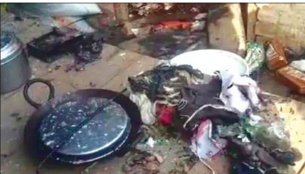
नवाबगंज, समृद्धि न्यूज़।

संदिग्ध परिस्थितियों में घर में आग लग गयी। जिससे घर का सामान जलकर राख हो गया। ग्रामीणों ने समर आदि चलाकर कड़ी मशकत के बाद आग पर काबू पाया।