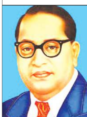
फर्रुखाबाद, समृद्धि न्यूज़।