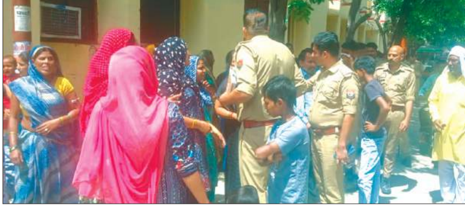
परिजनों को शांत कराती पुलिस