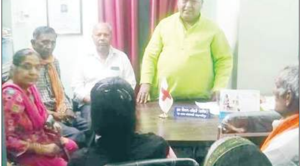
दौरान आपातकालीन रक्त की उपलब्धता सुनिश्चित करने, महिलाओं को पोषण, स्वच्छता के प्रति जागरूक करने और हाई-रिस्क प्रेगनेंसी की पहचान कर समय पर इलाज सुनिश्चित करने पर जोर देता है। सुरक्षित मातृत्व