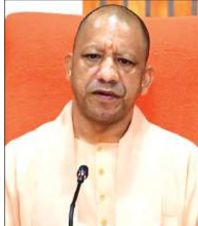
हुए शोक संतप्त परिवजनों एवं प्रशंसकों को इस कठिन समय में धैर्य व संबल प्रदान करने की कामना की।

मुख्यमंत्री ने दिवंगत आत्मा की शांति के लिए ईश्वर से प्रार्थना करते