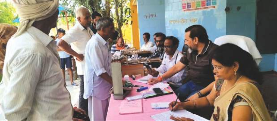
अमृतपुर, समृद्धि न्यूज़।