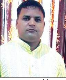
मृतक का फाइल फोटो

► मंडी चौकी प्रभारी पर लापरवाही और अभद्रता का आरोप ► सीओ के नेतृत्व में कई थानों की फोर्स ने संभाला मोर्चा