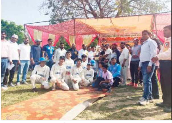
खड़ा कर दिया जवाब में जरी लेखपाल वॉरियर्स शुरू से ही विकेट खोकर अपनी लय को नहीं पकड़ पाई और मात्र 43 रन बनाकर ऑल आउट हो गई और इस तरह 210 रनों के बड़े अंतर से डायमंड टाइंडस रोज़ा ने यह