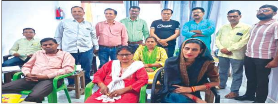
सम्मर्क के दौरान मौजूद शिक्षक

अखिल भारतीय संयुक्त शिक्षक महासंघ द्वारा शहर की विभिन्न कोचिंग संस्थाओं का तूफानी दौरा किया गया। जिसमें टेट की तैयारी करने वाले शिक्षक साथियों से संपर्क किया गया। विभिन्न कोचिंग संस्थाओं में जैसे ज्ञान अपंग दृष्टि एवं कोटिल्य अकादमी में जनसम्मर्क कर 13 अप्रैल को होने वाली बाइक रैली में प्रतिभाग करने हेतु शिक्षकों से आवाहन किया गया। टेट की अनिवार्यता से पीड़ित शिक्षकों ने पूर्ण आश्वासन दिया कि रैली में प्रतिभा कर विरोध प्रदर्शन करेंगे और सरकार अगर जल्द ही इसे समाप्त नहीं करती है तो एक बड़ा आंदोलन करने के लिए सभी बाध्य होंगे। कोचिंग संचालकों ने महासंघ के अनुरोध पर 13 अप्रैल