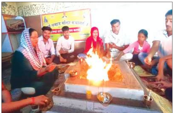
यज्ञ में आहुतियां देते लोग

आर्य समाज कमालगंज में रविवार को साप्ताहिक यज्ञ एवं सत्संग का आध्यात्मिक वातावरण में आयोजन हुआ। कार्यक्रम में नगर एवं आसपास के क्षेत्रों से आए श्रद्धालुओं ने उत्साहपूर्वक सहभागिता करते हुए यज्ञ में आहुतियां अर्पित की तथा परमात्मा से सुख, शांति, समृद्धि एवं उत्तम स्वास्थ्य की कामना की।