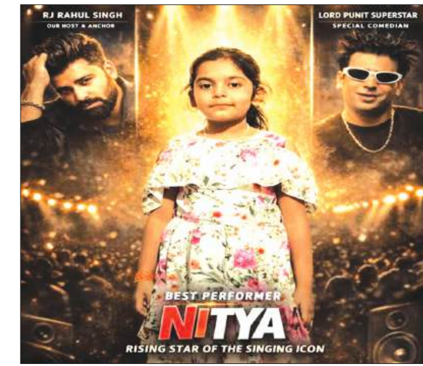
चयनित बेटी नित्या

► लोकप्रिय संगीत रियलिटी शो राइजिंग स्टार सिंगिंग आइडन में चयन होने से परिजनों में खुशी