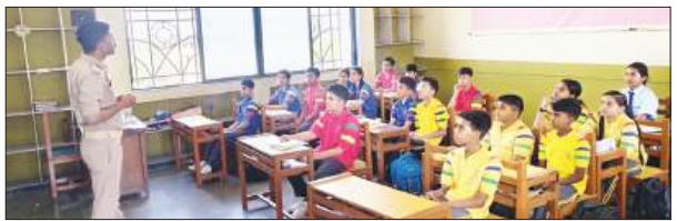
शाहजहांपुर। अग्निशमन एवं आपात सेवा द्वाय अग्नि सुरक्षा सप्ताह के अंतर्गत जन-जागरूकता कार्यक्रमों का व्यापक आयोजन अपर पुलिस अधीक्षक नगर के पर्यवेक्षण में विभिन्न विद्यालयों में प्रतियोगिताओं एवं व्याख्यानों के माध्यम से विद्यार्थियों को जागरूक किया गया। पुलिस अधीक्षक के निर्देशन एवं अपर पुलिस अधीक्षक नगर के पर्यवेक्षण में 15 अप्रैल को अग्निशमन एवं आपात सेवा द्वाय अग्नि सुरक्षा सप्ताह के अवसर पर जन-जागरूकता कार्यक्रमों का व्यापक एवं प्रभावी आयोजन किया गया। इस अवसर पर जनपद के विभिन्न शिक्षण संस्थानों में अग्नि सुरक्षा से संबंधित निबंध लेखन, चित्रकला प्रतियोगिता एवं जागरूकता व्याख्यान आयोजित किए गए। कार्यक्रमों का मुख्य उद्देश्य छात्र-छात्राओं को अग्नि सुरक्षा के प्रति जागरूकता प्रदान करना है। साथ ही आग लगने की स्थिति में त्वरित एवं सही कार्यवाही, अग्निशमन यंत्रों के सुरक्षित एवं प्रभावी उपयोग तथा आपातकालीन परिस्थितियों में अपनाए जाने वाले आवश्यक कदमों के संबंध में विस्तारपूर्वक जानकारी प्रदान की गई। संजय सरस्वती विद्या मंदिर रेलो रोड में आयोजित निबंध एवं चित्रकला प्रतियोगिता में आयुर्वर्षमण ने प्रथम स्थान, आर्यन मिश्रा ने द्वितीय स्थान एवं सिद्धि गुप्ता ने तृतीय स्थान प्राप्त कर उत्कृष्ट प्रदर्शन किया। दून इंटरनेशनल स्कूल