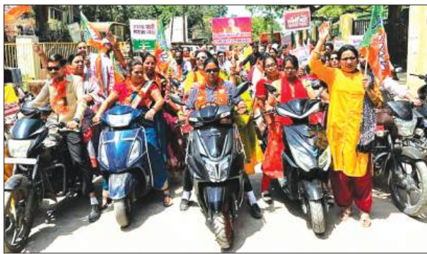
बाइक रैली में शामिल महिलाएँ

हथों को मजबूत करने का कार्य किया है। इस कानून के माध्यम से राजनीति में महिलाओं की भागीदारी बढ़ाना और उन्हें नीति निर्माण में सीधे शामिल करना है। मातृशक्ति सिर्फ वोट बैंक बनकर न रह जाए बल्कि समाज में उसकी भागीदारी सर्वोच्च होनी चाहिए।