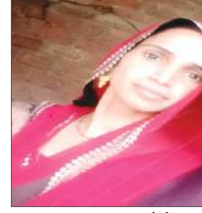
मृतका फाइल फोटो