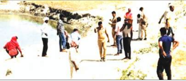
जांच पड़ताल करती पुलिस

फर्रुखाबाद, समृद्धि न्यूज़। आठ महीने गायब हुए युवक का गंगा में कंकाल मिलने से हड़कंप मच गया। मौके पर ग्रामीणों की भीड़ लग गयी। सूचना पर पहुंची पुलिस ने जांच पड़ताल की और कंकाल को कब्जे में लेकर पोस्टमार्टम के लिए भिजवाया।