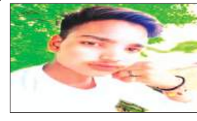
मृतक का फाइल फोटो

कपिल, समृद्धि न्यूज़। रेलवे स्टेशन पर लघु वीडियो बना रहा युवक ट्रेन की चपेट में आ गया। जिससे वह गंभीर रूप से घायल हो गया। कुछ समय बाद घटनास्थल पर ही उसकी मौत हो गई। मौत की खबर मिलते ही स्वजन बिलखने लगे। एक सप्ताह पूर्व ही युवक की सगाई हुई थी।