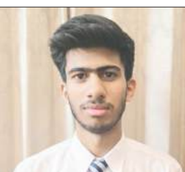
लखीमपुर खीरी, समृद्धि न्यूज़।

सीबीएसई बोर्ड द्वारा कक्षा 10 का परिणाम घोषित होते ही क्षेत्र में खुशी का माहौल छा गया। सेंट जॉन्स सीनियर सेकेंडरी स्कूल, गोला (खीरी) के छात्रों ने इस वर्ष भी उत्कृष्ट प्रदर्शन करते हुए विद्यालय का नाम रोशन किया। परिणाम आते ही स्कूल परिसर और छात्रों के घरों में