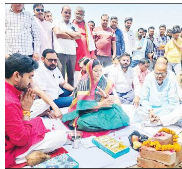
और दर्जनों की संख्या में उन्होंने क्षेत्र में बेहतरीन सड़कों का निर्माण करवाया। उन्होंने कहा महिला महाविद्यालय की स्थापना से यहां की

विधान से कराए गए भूमि पूजन का कार्यक्रम संपन्न किया। तत्पश्चात उन्होंने क्षेत्र वासियों को संबोधित करते हुए कहा उन्होंने अपने क्षेत्र वासियों की हर समस्या का निदान और हर मांग को पूरा करने का काम किया है। उन्होंने कहा महिला महाविद्यालय का भूमि पूजन जनपद का पहला महिला महाविद्यालय होगा। यह गौरव शाहाबाद विधानसभा क्षेत्र को प्राप्त हो रहा है। उन्होंने बताया जल्द ही शाहाबाद विधानसभा क्षेत्र वासियों को मांग पर इंजीनियरिंग कॉलेज का भूमि पूजन भी करेगी। उन्होंने अपनी उपलब्धियों को गिनाते हुए कहा रेलवे स्टेशन के ओवर ब्रिज के साथ-साथ सीएचसी में ऑक्सिजन प्लांट, हेल्थ एटीएम सहित तमाम विकास कार्य किए हैं