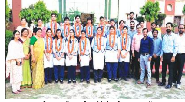
विद्यालय में सम्मानित होते मेधावी छात्र-छात्राओं

फर्रुखाबाद, समृद्धि न्यूज़। केंद्रीय माध्यमिक शिक्षा बोर्ड (सीबीएससी) द्वारा हाईस्कूल का परीक्षा परिणाम घोषित किया गया। इस वर्ष गुरुकुल वर्ल्ड स्कूल के 130 छात्र परीक्षा में सम्मिलित हुए थे। परिणाम घोषित होते ही विद्यार्थियों एवं अभिभावकों में उत्साह और प्रसन्नता का वातावरण देखा गया। विद्यालय के विद्यार्थियों ने इस वर्ष उत्कृष्ट प्रदर्शन किया। सभी छात्र प्रथम श्रेणी में उत्तीर्ण हुए तथा कई छात्रों ने 90 प्रतिशत से अधिक अंक प्राप्त कर विद्यालय का नाम गौरवान्वित किया। जिनमें 90 प्रतिशत व उससे अधिक अंक प्राप्त करने वाले मेधावी छात्र छात्राओं के