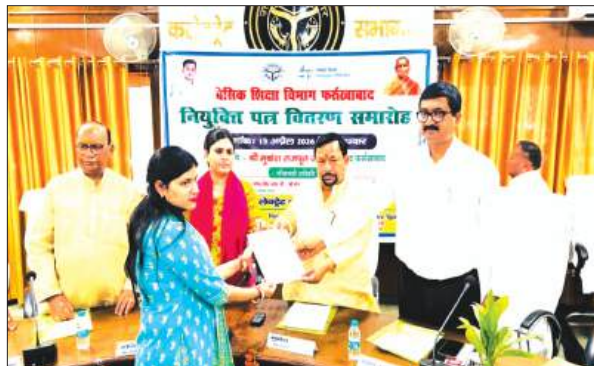
अभ्यर्थी का प्रमाण पत्र वितरित करते डीएम व जनप्रतिनिधि