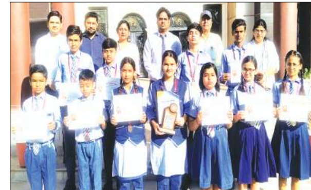
सम्मानित होते छात्र-छात्राएँ

फर्रुखाबाद, समृद्धि न्यूज। हिंदी संस्थान द्वारा आयोजित हिंदी ओलंपियाड परीक्षा में सीपी इंटर नेशनल स्कूल के विद्यार्थियों ने उत्कृष्ट प्रदर्शन करते हुए उल्लेखनीय उपलब्धि अर्जित की। प्रतियोगिता में छात्रों ने कुल 7 स्वर्ण पदक, 5 रजत पदक एवं 2 कांस्य पदक प्राप्त कर विद्यालय का नाम गौरवान्वित किया। यह सफलता विद्यार्थियों की मेहनत, समर्पण तथा हिंदी भाषा के प्रति उनके गहन अनुराग का परिचायक है। विद्यालय में छात्रों के लिए सम्मान समारोह का आयोजन किया गया।