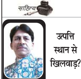
उत्पत्ति स्थान से खिलवाड़?