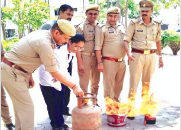
माँक इल के दौरान अग्निशमन अधिकारी व छात्र