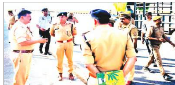
का स्थलीय निरीक्षण किया। निरीक्षण के दौरान यातायात संचालन, मार्ग की स्थिति, सुरक्षा व्यवस्था एवं संभावित जाम बिंदुओं का गहन अवलोकन किया। एसपी ने संबंधित अधिकारियों को निर्देशित किया कि वैकल्पिक मार्गों पर पर्याप्त पुलिस बल की तैनाती सुनिश्चित की जाए तथा यातायात का सुचारु एवं सुरक्षित संचालन प्राथमिकता के आधार पर किया जाए। साथ ही, मार्गों पर संकेतक बोर्ड, बैरिकेडिंग एवं आवश्यक दिशा-निर्देशों की स्पष्ट व्यवस्था करने