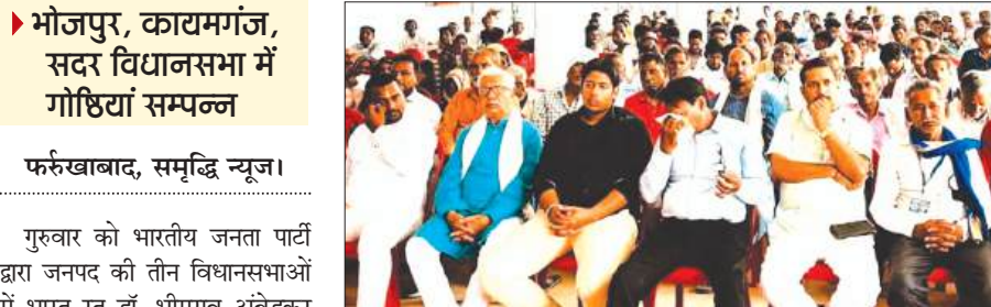
कार्यक्रम में मौजूद भाजपा नेता व कार्यकर्ता