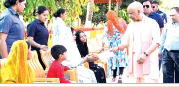
मां की गुहार पर भावुक हुए सीएम योगी, तुरंत दिए आयुष्मान कार्ड बनाने के निर्देश

उत्तर प्रदेश के मुख्यमंत्री योगी आदित्यनाथ ने गोरखपुर प्रवास के दौरान गुरुवार सुबह गोरखनाथ मंदिर में आयोजित जनता दर्शन में लोगों को भरोसा दिलाया कि उनकी सरकार बच्चों के इलाज में कोई बाधा नहीं आने देगी। योगी ने करीब 200 लोगों से मुलाकात कर उनकी समस्याएं सुनीं और कहा कि घबराइए मत, बच्चे के इलाज में कोई भी बाधा नहीं आने देंगे। जनता दर्शन में श्रवस्ती से आई एक महिला ने गंभीर बीमारी से पीड़ित बच्चे के इलाज में मदद का अनुरोध किया। साथ में आए बच्चे को देखकर मुख्यमंत्री भावुक हो गए। उन्होंने