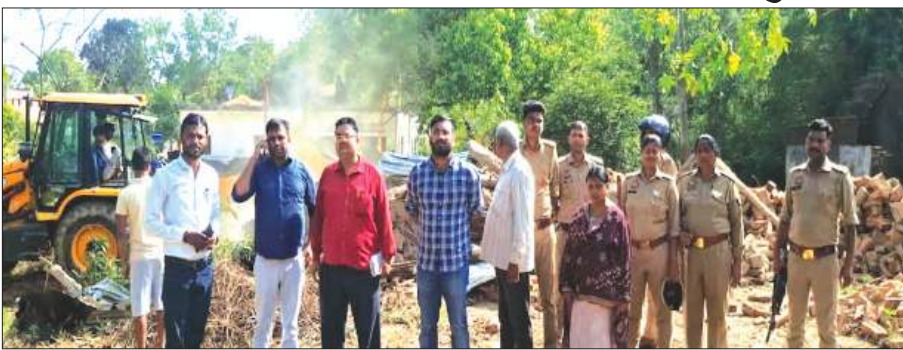
क्षेत्रीय लेखपाल ने मौके पर पहुंच कर जे.सी.बी.के माध्यम से सरकारी भूमि पर अवैध रूप से निर्मित पक्के बने निर्माण को ध्वस्त करवा दिया गया। अवैध अतिक्रमण पर तहसील प्रशासन द्वारा की गई ध्वस्तीकरण की कार्यवाही से जहां जिला प्रशासन का इकबाल बुलन्द हुआ है वहीं अवैध रूप से सरकारी भूमि पर अतिक्रमण करने वालों में बेचैनी बढ़ गई है। एसडीएम श्रीमती जौहरी ने स्पष्ट किया कि तहसील क्षेत्र अन्तर्गत सरकारी संपत्ति पर अवैध कब्जों को किसी भी सूरत बर्दाश्त नहीं किया जाएगा। उन्होंने बताया कि अवैध अतिक्रमण के विरुद्ध तहसील प्रशासन द्वारा निरन्तर अभियान चलाया जायेगा। एसडीएम ने

बहराइच समृद्धि न्यूज़। तहसील क्षेत्र नानपारा अन्तर्गत ग्राम रामनगर सेमरा, परगना चरदा स्थित गाटा संख्या 56 रकबा 0.122है. जोकि राजस्व अभिलेखों में नवीन परती के नाम दर्ज है, पर ग्राम के ही व्यक्ति के द्वारा लंबे समय से पक्का निर्माण करके अवैध कब्जा कर रखा था। अवैध अतिक्रमण पर तहसील प्रशासन द्वारा की गई ध्वस्तीकरण की कार्यवाही से जहां जिला प्रशासन का इकबाल बुलन्द हुआ है वहीं अवैध रूप से सरकारी भूमि पर अतिक्रमण करने वालों में बेचैनी बढ़ गई है। एसडीएम श्रीमती जौहरी ने स्पष्ट किया कि तहसील क्षेत्र अन्तर्गत सरकारी संपत्ति पर अवैध कब्जों को किसी भी सूरत बर्दाश्त नहीं किया जाएगा। उन्होंने बताया कि अवैध अतिक्रमण के विरुद्ध तहसील प्रशासन द्वारा निरन्तर अभियान चलाया जायेगा। एसडीएम ने