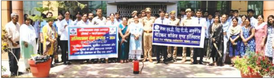
जागरूकता कार्यक्रम में मौजूद अधिकारी व विद्यालय स्टाफ

आवश्यक है। उन्होंने आपातकालीन स्थिति में घबराने के बजाय संयम बनाए रखने, तुरंत अलार्म बजाने, सुरक्षित निकास मार्ग का उपयोग करने