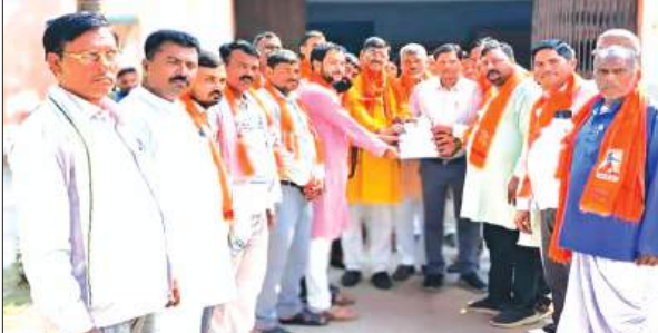
मनरेगा अधिनियम 2005 के तहत कराए गए कार्यों का भुगतान लंबे समय से अटका हुआ है। ग्रामांश और सामग्री मद में कमी होने से बकाया है, जिससे प्रधानों पर आपूर्तिकर्ता फर्मों का दबाव लगातार बढ़ रहा है और अधिक संकट गहराता जा रहा है। प्रधानों ने बताया कि उनका कार्यकाल 26 मई 2026 को समाप्त हो रहा है। यदि इससे पहले भुगतान नहीं हुआ, तो प्रधानों और संबंधित फर्मों के सामने गंभीर वित्तीय संकट खड़ा हो सकता है। ज्ञापन में यह भी उल्लेख किया गया है कि प्रदेश की पंचायतों का कार्यकाल 26 मई 2026 को समाप्त होना है। मौजूद

बहराइच समृद्धि न्यूज़। जिले में पंचायत विकास मंच के बैनर तले प्रधानों ने मुख्यमंत्री को ज्ञापन भेजकर पंचायत चुनाव का कार्यकाल बढ़ाने और मनरेगा के तहत किए गए कार्यों का बकाया भुगतान करने की मांग उठाई है। यह ज्ञापन नवाबगंज, मिर्हापुरवा और रिसिया विकास खंडों के प्रधानों ने खंड विकास अधिकारी के माध्यम से प्रेषित किया। प्रधानों ने मांग की है कि यदि समय पर पंचायत चुनाव नहीं कराए जा सकते हैं, तो वर्तमान प्रधानों को ही प्रशासन नियुक्त किया जाए। साथ ही उन्होंने कार्यकाल समाप्त होने से पहले मनरेगा के अंतर्गत कराए गए कार्यों का लंबित भुगतान सुनिश्चित करने की अपील की है। ज्ञापन में कहा गया है कि