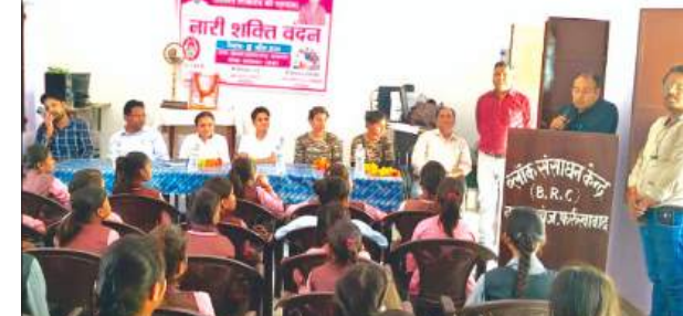
कार्यक्रम में मौजूद छात्राएं व शिक्षक