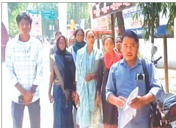
बताया कि इलाके में शराब की दुकान खुलने से न केवल माहौल खराब होगा, बल्कि अराजक तत्वों का जमावड़ा होने से आम लोगों को भी परेशानी होगी। ग्रामीणों ने चेतावनी दी है कि यदि उनकी मांगों पर शीघ्र कार्रवाई नहीं हुई, तो वे अपने आंदोलन को और तेज करेंगे। वहीं, प्रशासन ने ग्रामीणों को आश्वासन दिया है कि मामले की जांच कर उचित निर्णय लिया जाएगा।

बहराइच समृद्धि न्यूज़। जिले के सुजौली इलाके में प्रस्तावित देशी शराब की दुकान के विरोध में गुरुवार को ग्रामीणों ने जिलाधिकारी कार्यालय पहुंचकर ज्ञापन सौंपा। ग्रामीणों ने ठेका न खोलने या उसे किसी अन्य स्थान पर स्थानांतरित करने की मांग की। ग्रामीणों का तर्क है कि गांव के पास शराब की दुकान खुलने से सामाजिक माहौल खराब होगा और युवाओं पर इसका नकारात्मक प्रभाव पड़ेगा। इस विरोध प्रदर्शन में महिलाओं और बुजुर्गों ने भी भाग लिया और प्रशासन से इस निर्णय पर पुनर्विचार करने की अपील की। प्रदर्शनकारियों ने जिलाधिकारी के प्रतिनिधि को ज्ञापन सौंपकर देशी शराब की दुकान को गांव से दूर किसी अन्य स्थान पर स्थानांतरित करने की मांग की। उन्होंने बताया कि इलाके में शराब की दुकान खुलने से न केवल माहौल खराब होगा, बल्कि अराजक तत्वों का जमावड़ा होने से आम लोगों को भी परेशानी होगी। ग्रामीणों ने चेतावनी दी है कि यदि उनकी मांगों पर शीघ्र कार्रवाई नहीं हुई, तो वे अपने आंदोलन को और तेज करेंगे। वहीं, प्रशासन ने ग्रामीणों को आश्वासन दिया है कि मामले की जांच कर उचित निर्णय लिया जाएगा।