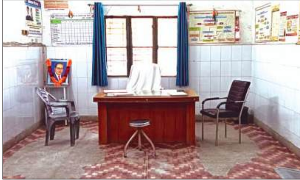
खाली पड़ा चिकित्सक कक्ष

सामुदायिक स्वास्थ्य केन्द्र में ग्रामीण क्षेत्र के मरीजों को बेहतर चिकित्सकीय सुविधा मुहैया कराने के लिए प्रदेश सरकार ने लाखों की लागत से लगभग 25 वर्ष पूर्व भवन का निर्माण कराया था। अस्पताल में मरीजों को रोकने के लिए 30 बेडों की भी व्यवस्था की गई। अस्पताल भवन व परिसर में कर्मचारियों के रहने के लिए बने आवासों की हालत भी कुछ ठीक नहीं है। अस्पताल में प्रतिदिन लगभग 150 से अधिक मरीज चिकित्सा लाभ लेने आ रहे थे, लेकिन मरीजों को अस्पताल में बेहतर चिकित्सा सुविधाएं मुहैया नहीं हो पा रही है।