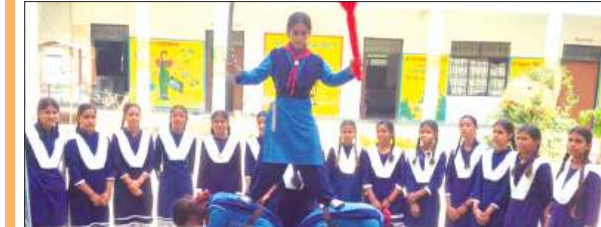
फर्रुखाबाद, समृद्धि न्यूज़। नारी शक्ति वंदन के तहत जनपद के माध्यमिक विद्यालयों में विभिन्न कार्यक्रमों के आयोजन कराये गये। जिसमें जनपद के समस्त शासकीय/अशासकीय सहायता प्राप्त एवं वित्तिहीन मान्यता प्राप्त माध्यमिक विद्यालयों में शुक्रवार को सशक्त नारी विकसित भारत के संदेश आगे बढ़ाते हुए विद्यालय स्तर पर छात्राओं, शिक्षिकाओं, महिला अभिभावकों द्वारा भव्य मानव श्रृंखला बनायी गयी। 17 अप्रैल को शौर्य प्रदर्शन एवं सांस्कृतिक गतिविधियों का आयोजन किया गया। जिसके अन्तर्गत विद्यालयों एन.सी.सी. एवं स्कॉउट/ गाइड की छात्राओं द्वारा अनुशासन एवं वीरता के प्रदर्शन हेतु ड्रिल एवं आत्मरक्षा तकनीकी का प्रदर्शन किया गया। बालिकाओं द्वारा महिला विभूतियों के जीवन पर आधारित लघु नाटिका, लोकगीत, लोकनृत्य जैसे सांस्कृतिक गतिविधियों का आयोजन किया गया। विद्यालयों में छात्राओं द्वारा विभिन्न खेलकूद प्रतियोगिताओं का आयोजन किया गया। 20 अप्रैल को वाद-विवाद एवं लेखन प्रतियोगिता का आयोजन माध्यमिक विद्यालयों में किया जायेगा।