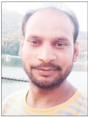
मिनतौली-खीरी, समृद्धि न्यूज। थाना क्षेत्र में गुरुवार शाम उस समय हड़कंप मच गया, जब एक युवक का शव सड़क किनारे सदिग्ध परिस्थितियों में पड़ा मिला। सूचना मिलते ही डायल 112 पुलिस मौके पर पहुंची और आनन-फानन में युवक को सामुदायिक स्वास्थ्य केंद्र मिनतौली ले जाया गया, जहां डॉक्टरों ने उसे मृत घोषित कर दिया। घटना के

सरसों पेराई करा के लौट रहा था युवक, परिजनों ने जताई हत्या की आशंका, पुलिस जांच में जुटी