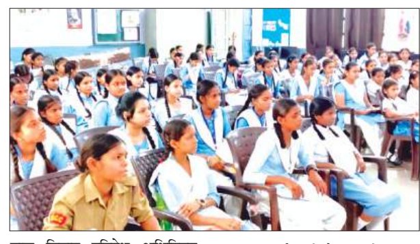
कार्यक्रम में मौजूद छात्रों