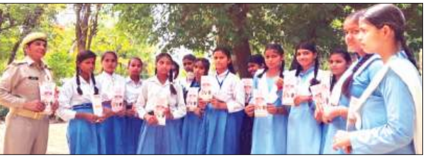
फर्रुखाबाद, समृद्धि न्यूज़।