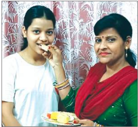
नेहावी छात्रा को गिटारी छिलाली मां