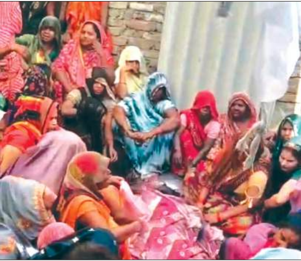
रोते बिलखते मृतक के परिजन