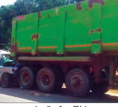
डंपर में घुसी स्कॉर्पियो

मंगलवार सुबह शादी समारोह से लौट रही स्कॉर्पियो कार खराब खड़े डंपर से टकरा गयी। इस सड़क हादसे में एक व्यक्ति की मौत हो गई, जबकि आठ लोग गंभीर रूप से घायल हो गए। मौके पर पहुंची पुलिस ने जांच पड़ताल की और सभी घायलों को उपचार के लिए अस्पताल भिजवाया। वहीं मृतक के शव का पंचनामा भरकर पोस्टमार्टम के लिए भिजवाया। जानकारी के अनुसार मोहम्मदबाद से नवाबगंज की ओर जा रही स्कॉर्पियो यूपी 76एम/8906 सूर्यशं पेट्रोल पंप पुटरी के पास सड़क पर खराब खड़े डंपर आरजे 11जीसी/2437 से जा टकराई। टक्कर इतनी जोरदार थी कि स्कॉर्पियो के