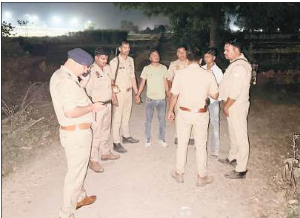
रात्रि गश्त और सदिध व्यक्ति व वाहन चेकिंग कर रही थी। इसी दौरान पुलिस को मुखबिर से सूचना मिली कि कूच सदिध व्यक्ति

तीनों आरोपियों को पुलिस ने किया गिरफ्तार, दो आरोपी भेजे गए जेल