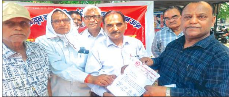
प्रशासनिक अधिकारी को ज्ञापन सौंपते एसो के पदाधिकारी