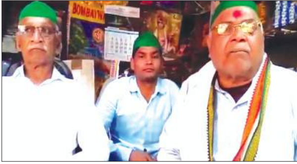
बैठक में मौजूद भाकियू नेता

भारतीय किसान यूनियन धरती पुत्र ने बैठक कर अपनी विभिन्न समस्याओं को लेकर मांग पत्र जिलाधिकारी को रजिस्टर डाक द्वारा प्रेषित किया। डीएम को भेजे गये ज्ञापन में दर्शाया कि डीआईओएस द्वारा आदेशित करने के उपरांत स्कूलों की जांच नहीं की जा रही है। विद्यालय में महंगी और अनधिकृत पाठ्य पुस्तकें चल रही है इसके ऊपर से प्रतिबंध नहीं हटा कारवाई तकाल की जाए। आवासीय भूखंडों पर चल रहे स्कूलों की जांच कराई जाए कस्बा कायमगंज में फुटपाथों का अतिक्रमण