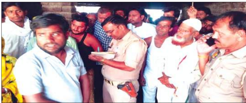
जांच पड़ताल करती पुलिस