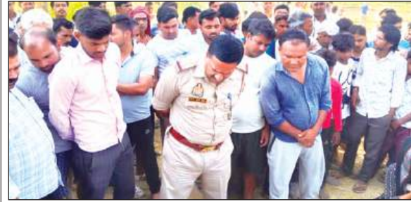
जांच पड़ताल करती पुलिस