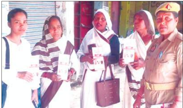
आशाओं को जागरूक करती पुलिस

द्वारा महिलाओ/बालिकाओ को महिला सशक्तिकरण, लैंगिक अपराध, नवीन कानूनों, साइबर अपराध एवं उनसे बचाव के उपायों, घरेलू हिंसा, विभिन्न हेल्पलाइन नंबरों एवं शासन द्वारा प्रचलित योजनाओं के संबंध में जानकारी प्रदान करते हुए पम्पलेट वितरित कर जागरूक किया गया। इसके साथ ही थाना कादरीगोट, थाना कमिल्ल, कोतवाली कायमगंज, थाना जहानगंज, थाना मऊदरवाजा, कोतवाली फर्रुखाबाद, कोतवाली