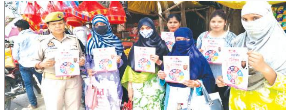
छात्राओं को जागरूक करती महिला पुलिस

मोहम्मदाबाद, थाना मेरापुर, महिला थाना पुलिस, थाना राजपुर, थाना शमशाबाद में पुलिस ने भ्रमण के दौरान छात्राओं, बालिकाओं और महिलाओं को उनके अधिकारों, सुरक्षा उपायों तथा आत्मरक्षा के प्रति जागरूक किया