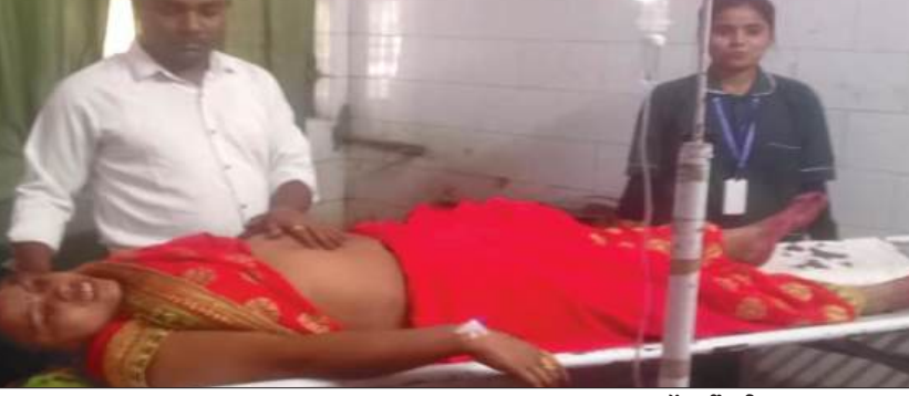
कायमगंज, समृद्धि न्यूज़।