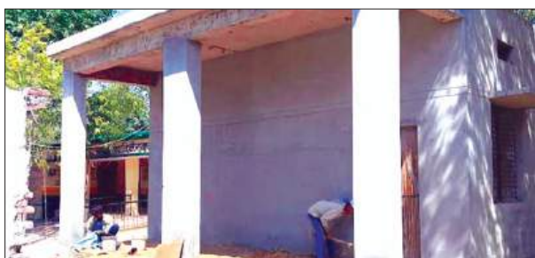
अधूरा पड़ा प्राथमिक विद्यालय में अतिरिक्त कक्ष

नगर पंचायत द्वारा वार्ड नंबर 3 अब्दुल कलाम आजाद नगर स्थित नमला नया प्राथमिक विद्यालय में अतिरिक्त कक्ष का निर्माण कार्य निर्धारित समय-सीमा और बजट आवंटन के बावजूद अधूरा पड़ा है। यह स्थिति शिक्षा व्यवस्था पर नकारात्मक प्रभाव डाल रही है। यह निर्माण कार्य पिछले साल नवंबर में शुरू किया गया था, जिसके लिए 2.5 दिसंबर की समय-सीमा तय की गई थी। हालांकि, कई महीने बीत जाने के बाद भी यह कार्य पूरा नहीं हो सका है, जिससे स्कूली बच्चों और शिक्षकों