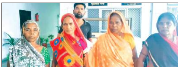
शिकायत के बाद जानकारी देते पीड़ित