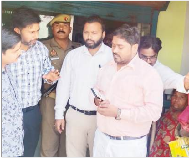
लेखपाल, कोटेदार, ग्राम प्रधान, सीएससी-वीएलई एवं कृषि विभाग के कर्मचारी इस कार्य में लगाए गए हैं,

फार्मर रजिस्ट्री कार्य में लापरवाही बरतने वाले सीएससी केंद्रों पर एक्शन