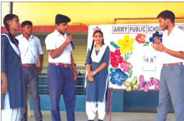
लघु नाटिका प्रस्तुत करती विद्यार्थी