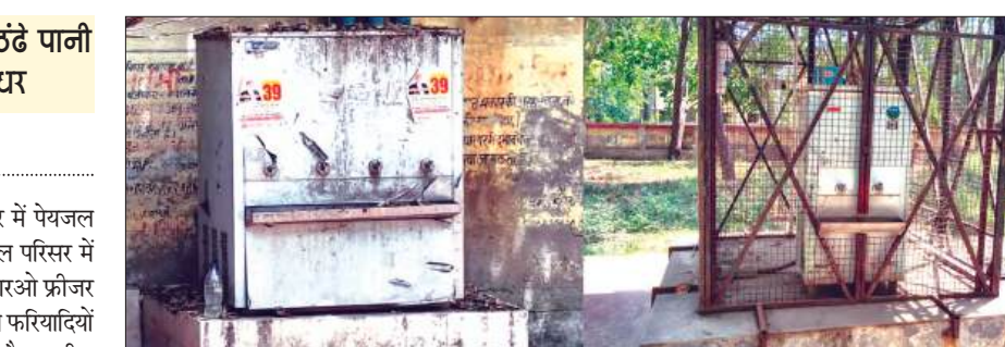
विधायक व ब्लाक प्रमुख द्वारा लगावाया गया फ्रीजर बंद

भीषण गर्मी के बीच तहसील अमृतपुर में पेयजल व्यवस्था पूरी तरह चरमपट्टे हुई है। तहसील परिसर में लगाए गए लाखों रुपये की लागत वाले आरओ फ्रीजर बंद पड़े हैं। जिससे दूर-दराज से आने वाले फरियादियों को भारी परेशानी का सामना करना पड़ रहा है। तहसील में योजना बड़ी संख्या में लोग अपने विभिन्न कार्यों के लिए पहुंचते हैं, लेकिन उन्हें पीने के पानी तक के लिए इधर-उधर भटकना पड़ता है। हालत यह है कि कई लोगों को मजबूरी में बाहर से पानी खरीदकर अपनी प्यास बुझानी पड़ रही है। जानकारी के अनुसार तहसील परिसर में दो आरओ फ्रीजर स्थापित हैं, जिनमें से एक पर ब्लॉक प्रमुख