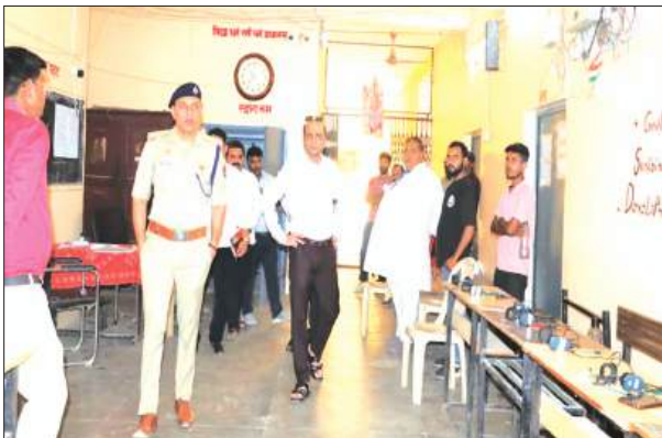
परीक्षा केंद्रों पर पहुंचकर परीक्षा संचालन की स्थिति को बारीकी से परखा। निरीक्षण के दौरान राजकीय इंटर कॉलेज प्रतापगढ़ में कुछ खासियां पाई गईं, जिस पर