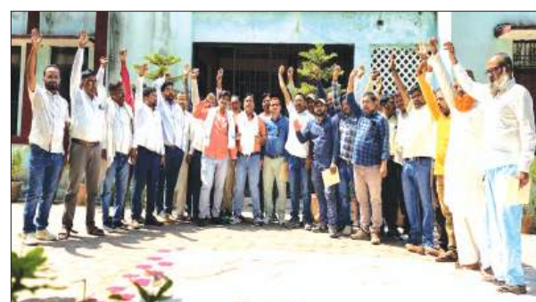
कराए गए कार्यों का भुगतान महीनों से अटका हुआ है। मजदूरों का कहना है कि उन्होंने समय से काम पूरा किया, लेकिन उन्हें अब तक मजदूरी नहीं मिली। आर्थिक तंगी के चलते कारण क्षेत्र में असंतोष लगातार बढ़ रहा है और अब यह विरोध प्रदर्शन के रूप में सामने आने लगा है। सूत्रों के अनुसार, निघासन ब्लॉक की कई ग्राम पंचायतों में मनरेगा के तहत

ब्लॉक क्षेत्र में रोजगार सेवकों और मनरेगा मजदूरों की समस्याएं अब गंभीर रूप लेती जा रही हैं। एक ओर जहां रोजगार सेवकों का करीब आठ माह से मानदेय बकाया है, वहीं दूसरी ओर मनरेगा मजदूरों को छह माह से मजदूरी का भुगतान नहीं मिला है। लंबे समय से भुगतान लंबित रहने के कारण क्षेत्र में असंतोष लगातार बढ़ रहा है और अब यह विरोध प्रदर्शन के रूप में सामने आने लगा है। सूत्रों के अनुसार, निघासन ब्लॉक की कई ग्राम पंचायतों में मनरेगा के तहत