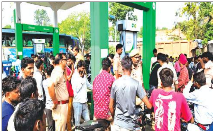
यही वजह है कि गांवों में डीजल और पेट्रोल की खुलेआम कालाबाजारी हो रही है।

स्थानीय लोगों का आरोप है कि कई पेट्रोल पंप संचालक आम उपभोक्ताओं की बजाय अपने परिचितों, बड़े ग्राहकों और स्टॉक करने वालों को प्राथमिकता दे रहे हैं।