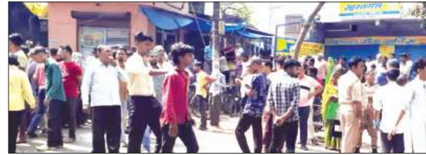
जाम लगाये उपभोक्ता

मंगलवार की सुबह गैस सिलेंडर न मिलने से नाराज उपभोक्ताओं ने मुख्य मार्ग लाल सराय में जाम लगा दिया। शहर के लाल सराय स्थित नेशनल गैस सर्विस पर मंगलवार को महिलाओं और युवकों ने गैस न मिलने के चलते सड़क पर बैठकर विरोध प्रदर्शन किया और जाम लगा दिया। सुबह से ही एजेंसी पर सिलेंडर लेने वालों की भारी भीड़ जुटी थी। कई दिनों के इंतजार के बाद भी सिलेंडर न मिलने पर लोग आक्रोशित हो गए। प्रदर्शन के कारण यातायात पूरी तरह प्रभावित हो गया। सूचना मिलते ही सदर कोतवाली पुलिस मौके पर पहुंची और जाम खुलवाने का प्रयास किया। प्रदर्शनकारी हटने को तैयार नहीं हुए। पुलिस और प्रदर्शनकारियों के बीच बहस हुई। जाम में फंसे राहगीरों और