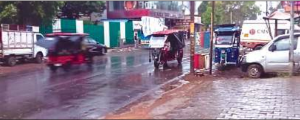
बरसात के कारण सड़क पर छाया सन्नटा

फर्रुखाबाद, समृद्धि न्यूज। मौसम के करवट बदलते ही जहां एक ओर खड़ी फसलों में नुकसान हो रहा है, वहीं आवागमन भी बाधित हुआ है। वहीं फतेहगढ़ में मंगल बाजार के दौरान पानी बरसने से अफरा-तफरी का माहौल बन गया। फुटपाथी दुकानदार अपना सामान इधर-उधर समेटते रहे। जिससे उनके बेंचने वाले कीमती कपड़े व अन्य सामग्री भीग गयी। पिछले तीन दिनों से मौसम अपनी लगातार करवट बदल रहा है। वहीं खेतों में फसलों का नुकसान हो