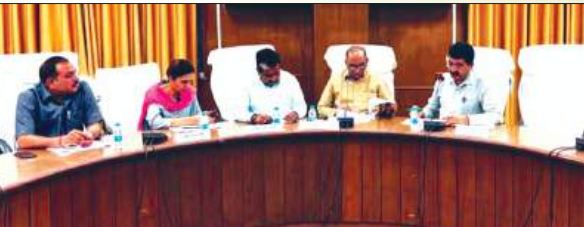
बैठक लेते डीएम मौजूद जनप्रतिनिधि

फर्रुखाबाद, समृद्धि न्यूज। उप लोक निर्माण विभाग की वित्तीय वर्ष 2026-27 की कार्ययोजना के संबंध में बैठक कलेक्टर सभागार में जिलाधिकारी आशुतोष कुमार द्विवेदी की अध्यक्षता में सम्पन्न हुई। जिसमें विधायक अमृतपुर, भोजपुर एवं कायमगंज उपस्थित रही। बैठक में वित्तीय वर्ष 2026-27 हेतु प्रस्तावित सड़कों के निर्माण, चौड़ीकरण, सुदृढ़ीकरण एवं मरम्मत कार्यों की विस्तृत समीक्षा की गई। जनप्रतिनिधियों द्वारा अपने-अपने क्षेत्रों की आवश्यकताओं एवं प्राथमिकताओं के