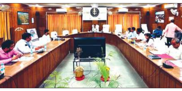
बैठक लेते डीएम मौजूद अधिकारीगण

फर्रुखाबाद, समृद्धि न्यूज। उप शासन की शीर्ष प्राथमिकताओं में सम्मिलित उद्योग विभाग द्वारा संचालित मुख्यमंत्री युवा उद्यमी विकास अभियान योजना के अंतर्गत वित्तीय वर्ष 2025-26 एवं 2026-27 के लंबित ऋण आवेदनों की समीक्षा हेतु कलेक्टर सभागार में जिलाधिकारी आशुतोष कुमार द्विवेदी