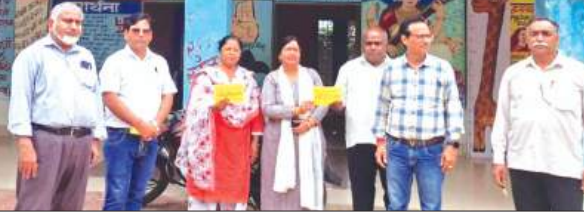
विद्यालयों में सम्पर्क करते शिक्षक नेता

अखिल भारतीय संयुक्त शिक्षक महासंघ के नेताओं ने बखुर ब्लाक के स्कूलों में टीईटी अनिवार्यता के विरोध के चरिते कई विद्यालयों के शिक्षकों से सम्पर्क करके 13 अप्रैल को होने वाली विशाल बाइक रैली में अधिक से अधिक लोगों को ढाई बजे बीएसए कार्यालय में पहुंचने की अपील की। शिक्षक नेताओं ने कहा कि टीईटी अनिवार्यता का विरोध जारी रहेगा। 13 अप्रैल को बाइक रैली निकाली जायेगी, जो कलेक्टर होते हुए अम्बेडकर तिराहे से होते हुए जिला जेल चौक से निकलेगी। जनपद के सभी शिक्षक-