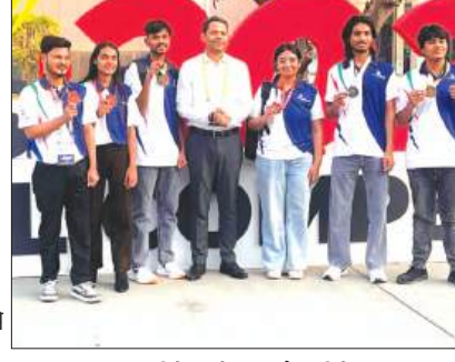
निदेशक के साथ मौजूद विजेता

फर्रुखाबाद, समृद्धि न्यूज। मण्डल स्तर आयोजित भारत कौशल प्रतियोगिता में कानपुर मण्डल के समस्त जनपदों के प्रतिभागियों ने 20 विभिन्न कौशल विधाओं में प्रतिभाग किया था। मण्डल के विजयी प्रतिभागियों में से जनपद के 64 प्रतिभागी प्रदेश स्तर पर आयोजित होने वाली प्रतियोगिता हेतु चयनित