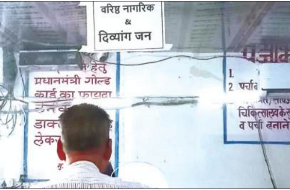
लोहिया अस्पताल में बना दिव्यांग काउंटर