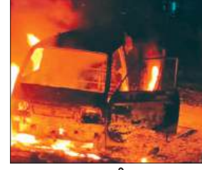
धू-धू कर जलती कार

एलपीजी डालते समय कार में आग लग गई। कुछ ही समय में कार जलकर नष्ट हो गई। पुलिस ने जांच पड़ताल की। जानकारी के अनुसार नगर के कपिल-कायमगंज मार्ग पर पीडब्ल्यूडी गेस्ट हाउस के निकट सोमवार देर रात लगभग साढ़े आठ बजे एक कार में एलपीजी डालते समय आग लग गई। देखते ही देखते कार जलकर नष्ट हो गई। राहगीरों ने मामले की सूचना पुलिस को दी। मौके पर पहुंचे नगर