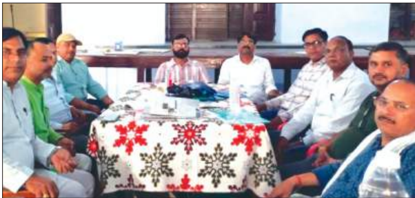
बैठक करते अटेवा के शिक्षकगण