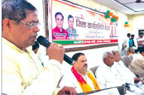
बैठक को संबोधित करते भाजपा जिलाध्यक्ष

संपन्न करारेंगे। मंडलों के आगठित बूथों का गठन सुनिश्चित करना होगा। मंडल की बैठक में शक्ति केंद्र का प्रभारी मंडल पदाधिकारी बनेगा। मंडलों की बैठक के बाद जिला प्रशिक्षण वर्ग आयोजित होगा जिला प्रशिक्षण वर्ग में अपेक्षित कार्यकर्ता जिसमें संपूर्ण जिला कार्य समिति मंडल प्रभारी मंडल अध्यक्ष सभी मोर्चा अध्यक्ष एवं महामंत्री सभी प्रकोष्ठ के संयोजक व संयोजक क्षेत्रीय व राष्ट्रीय पदाधिकारी सभी पूर्व जिला अध्यक्ष सभी जिला सहकारी पदाधिकारी जिसमें क्रय विक्रय भी शामिल रहेगा। प्रशिक्षण वर्ग में रजिस्ट्रेशन अनिवार्य होगा ऑनलाइन पंजीकरण सरल ऐप के माध्यम से प्रत्येक को 200 शुल्क जमा करना होगा। प्रशिक्षण वर्ग आयोजित होगा वहां पर प्रदर्शनी लगाई