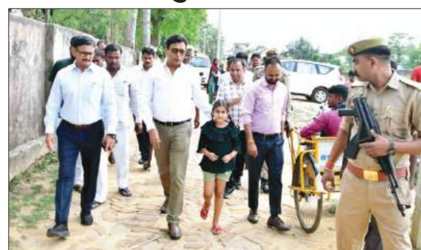
लखीमपुर खीरी, समृद्धि न्यूज।

निरीक्षण के दौरान डीएम ने क्षेत्र में हो रही अनियोजित प्लांटिंग पर भी सख्त रुख अपनाया। उन्होंने स्पष्ट किया कि बिना स्वीकृत लेआउट और आवश्यक अनुमति के की जा रही प्लांटिंग भविष्य में ऐसी ही समस्याओं को जन्म देती है। ऐसे मामलों में नियमों के तहत कार्रवाई सुनिश्चित की जाएगी। साथ ही, उन्होंने आमजन से अपील करते हुए कहा कि जमीन या प्लांट खरीदते समय केवल कीमत या लोकेशन को प्राथमिकता न दें, बल्कि यह भी देखें कि वहां सड़क, नाली, बिजली और जलनिकासी जैसी मूलभूत सुविधाएं उपलब्ध हैं या नहीं। उन्होंने कहा कि थोड़ी सी सतर्कता भविष्य की बड़ी परेशानियों से बचा सकती है। एक नन्ही बच्ची की सादगी भरी शिकायत पर प्रशासन की यह त्वरित कार्रवाई न सिर्फ संवेदनशीलता का उदाहरण बनी, बल्कि यह दर्शाता है कि आस-पास की हर अवज्ञा को सख्त रूप से धरना देना ही सतर्कता है और उस पर कार्रवाई भी होती है।