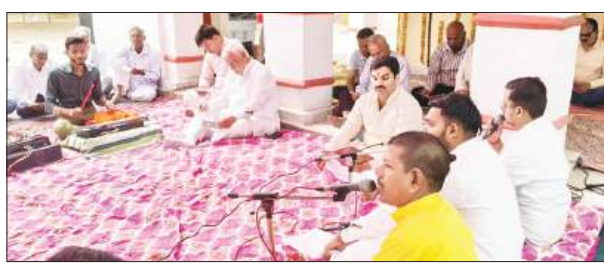
गोला गोकर्णनाथ, खीरी