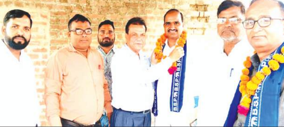
फर्रुखाबाद, समृद्धि न्यूज़।