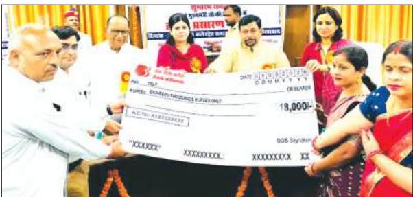
शिक्षा मित्रों को प्रतीकात्मक चेक देते जनप्रतिनिधि व प्रशासनिक अधिकारीगण