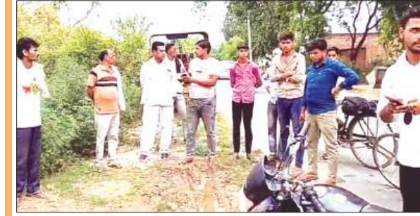
मौके पर मौजूद ग्रामीण