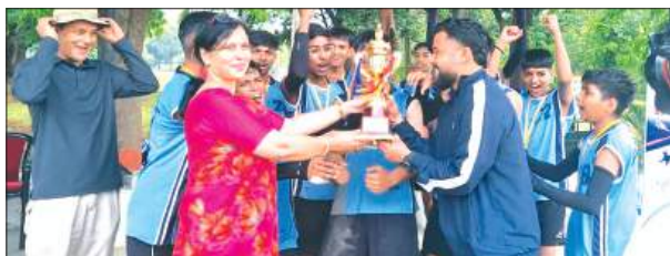
विजेता टीम को ट्रॉफी देती आर्मी पब्लिक स्कूल एल.बी.एस. लखनऊ की प्रधानाचार्य

आर्मी पब्लिक स्कूल, एल.बी.एस. मार्ग लखनऊ में आयोजित क्लस्टर-4 अंडर-15 बालक फुटबॉल टूर्नामेंट में आर्मी पब्लिक स्कूल, फतेहगढ़ ने उत्कृष्ट प्रदर्शन करते हुए फाइनल मुकाबले में आर्मी पब्लिक स्कूल, बरेली को 3-2 से पराजित कर विजेता ट्रॉफी अपने नाम की।