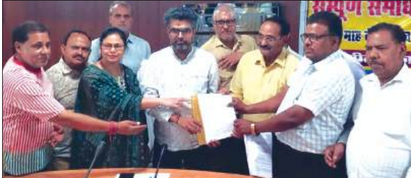
तहसीलदार को ज्ञापन सौंपते व्यापार मंडल के पदाधिकारीगण

व्यवसायिक गैस सिलेण्डर पर बढ़ती कीमतों को वापस लेने के लिए उद्योग व्यापार मण्डल के पदाधिकारियों ने तहसीलदार को ज्ञापन सौंपा।