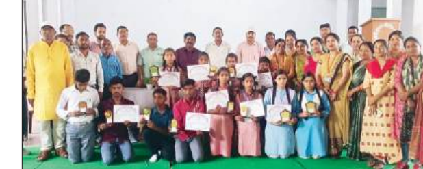
पुवायां, शाहजहांपुर, समृद्धि न्यूज़।