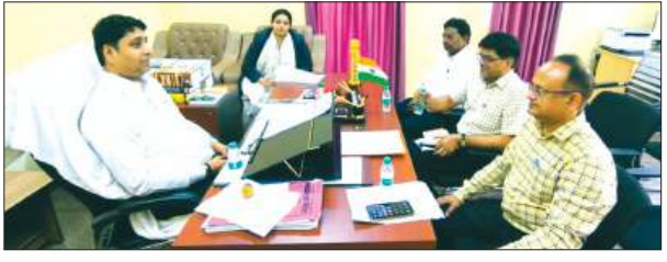
बैठक लेते प्रभारी जनपद न्यायाधीश व मौजूद न्यायिक अधिकारियों