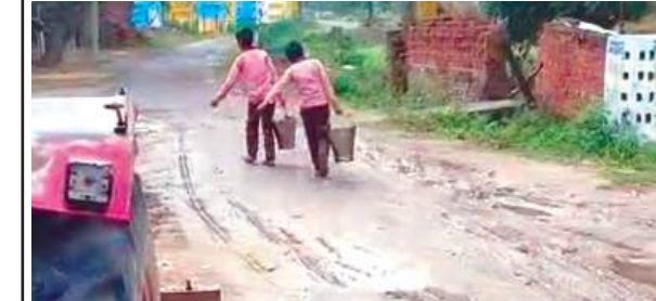
बाल्टी में पानी भरकर ले जा रहे बच्चों