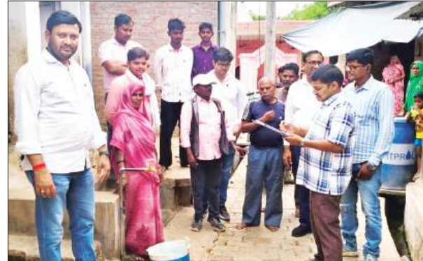
के क्रियान्वयन और पानी की गुणवत्ता से संबंधित महत्वपूर्ण जानकारी प्राप्त की गई। ग्राम पंचायत लतीफपुर और सरैला में पेयजल आपूर्ति सुनिश्चित करने के लिए निर्मित की गई जल टर्किंगों और पाइपलाइन नेटवर्क के तकनीकी पहलुओं की समीक्षा की गई। मूल्यांकन के दौरान यह पाया गया कि घर-घर नल कनेक्शन उपलब्ध होने से ग्रामीणों को अब नियमित रूप से स्वच्छ पेयजल मिल रहा है। ग्रामीणों ने टीम को बताया कि जल जीवन मिशन लागू होने से पहले उन्हें पानी के लिए हंडैपों कुँओं पर निर्भर रहना पड़ता था, जिसमें समय और श्रम दोनों की अत्यधिक खपत होती थी। घर में ही शुद्ध जल की उपलब्धता से विशेष रूप से महिलाओं और

ग्रामीणों के जीवन स्तर में आ रहा सकारात्मक सुधार फतेहपुर, समृद्धि न्यूज़। विकास खण्ड भिटीया के अंतर्गत ग्राम पंचायत लतीफपुर और सरैला में आज जल जीवन मिशन के तहत संचालित योजनाओं का प्रो. राजेन्द्र सिंह (रज्जू भैया) विश्वविद्यालय, प्रयागराज की टीम द्वारा विस्तृत स्थलीय निरीक्षण एवं प्रभाव मूल्यांकन किया गया। इस टीम का मुख्य उद्देश्य ग्रामीण क्षेत्रों में स्वच्छ पेयजल की उपलब्धता और उसके सामाजिक-आर्थिक प्रभावों का आकलन करना था। निरीक्षण टीम ने ग्राम जल एवं स्वच्छता समिति के पदाधिकारियों, ग्राम प्रधानों तथा स्थानीय ग्रामीणों से सीधा संवाद किया। इस दौरान योजना के क्रियान्वयन और पानी की गुणवत्ता से संबंधित महत्वपूर्ण जानकारी प्राप्त की गई। ग्राम पंचायत लतीफपुर और सरैला में पेयजल आपूर्ति सुनिश्चित करने के लिए निर्मित की गई जल टर्किंगों और पाइपलाइन नेटवर्क के तकनीकी पहलुओं की समीक्षा की गई। मूल्यांकन के दौरान यह पाया गया कि घर-घर नल कनेक्शन उपलब्ध होने से ग्रामीणों को अब नियमित रूप से स्वच्छ पेयजल मिल रहा है। ग्रामीणों ने टीम को बताया कि जल जीवन मिशन लागू होने से पहले उन्हें पानी के लिए हंडैपों कुँओं पर निर्भर रहना पड़ता था, जिसमें समय और श्रम दोनों की अत्यधिक खपत होती थी। घर में ही शुद्ध जल की उपलब्धता से विशेष रूप से महिलाओं और