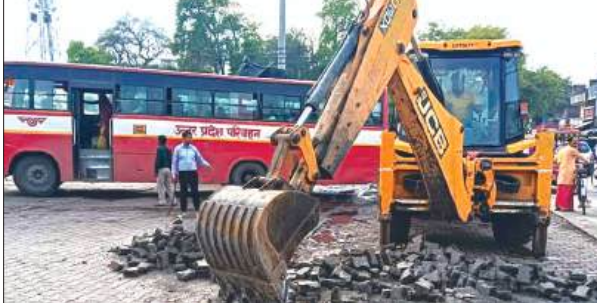
प्रतिमा स्थल की साफ-सफाई करते नगर पालिका के कर्मचारी