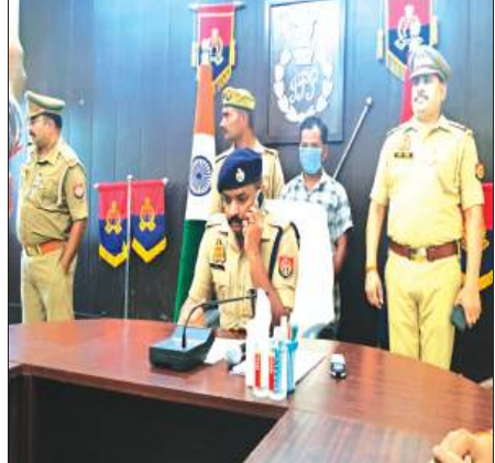
अमेठी समृद्धि न्यूज़।