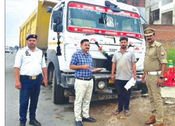
ट्रक सीज करने की कार्यवाही करते एआरटीओ प्रवर्तन व यातायात प्रभारी

मोडिफाइड साइलेन्सर का उपयोग करने वाले वाहनों के संबंध में परिवहन विभाग के हेल्पलाइन नंबर