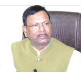
► समाजवादी पार्टी को आत्ममंथन करने की आवश्यकता

भाजपा के प्रदेश अध्यक्ष एवं केंद्रीय वित्त राज्य मंत्री पंकज चौधरी ने समाजवादी पार्टी और उसके नेताओं पर तीखा हमला बोलते हुए कहा कि विपक्ष को देशहित के हर निर्णय में राजनीति दिखाई देने लगी है। उन्होंने कहा कि जब देश वैश्विक परिस्थितियों और चुनौतियों के बीच आत्मनिर्भरता, संसाधनों के संरक्षण और राष्ट्रीय हितों को सर्वोपरि रखते हुए आगे बढ़ रहा है, तब समाजवादी पार्टी जैसे दल जनता को गुमराह करने और भ्रम फैलाने में लगे हुए हैं प्रधानमंत्री ने देशवासियों से ऊर्जा बरत, स्वदेशी उत्पादों को बढ़ावा देने, फ़िल्ल खर्च में संयम बरतने तथा संसाधनों के विवेकपूर्ण उपयोग की अपील की। यह कमजोरी नहीं, बल्कि दूरदर्शी और जिम्मेदार नेतृत्व की पहचान है।