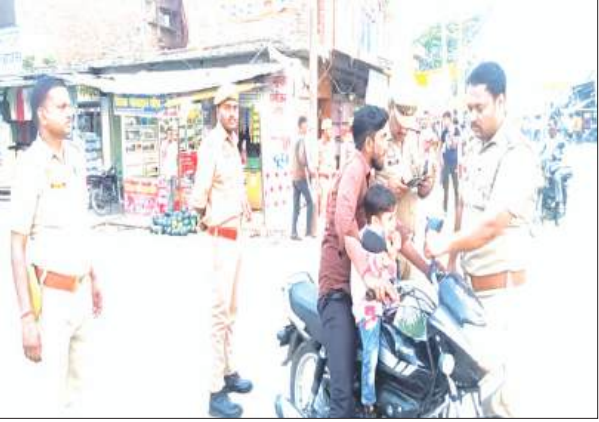
चैकिंग अभियान चलाते थानाध्यक्ष

नवाबगंज, समृद्धि न्यूज़। पुलिस ने कस्बे में पैदल गस्त्र कर चौराहे पर संधन वाहन चैकिंग अभियान चलाया। इस दौरान दर्जनों वाहनों के चालान काटे।