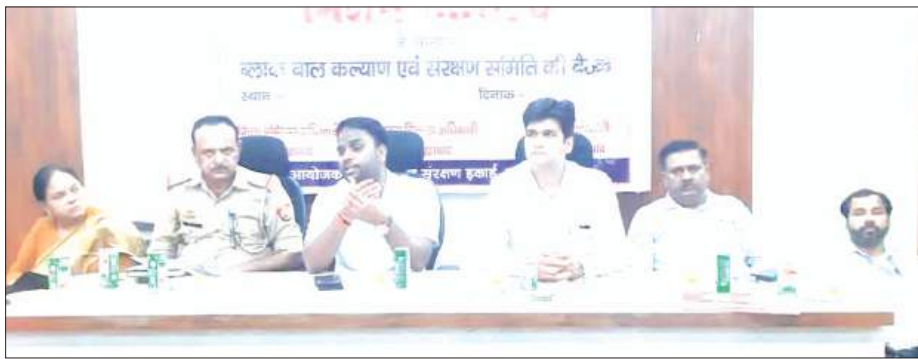
बैठक में जानकारी देते जिला प्रवेशन अधिकारी

► मिशन वात्सल्य योजना की विकास खण्ड कमालगंज में बैठक संपन्न