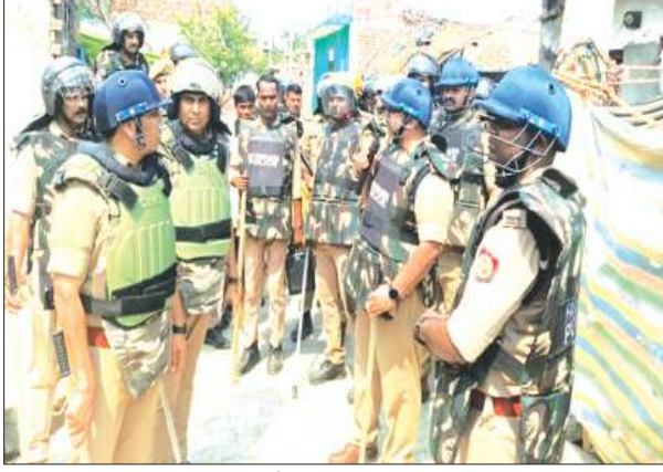
गांव में तैनात पुलिस बल