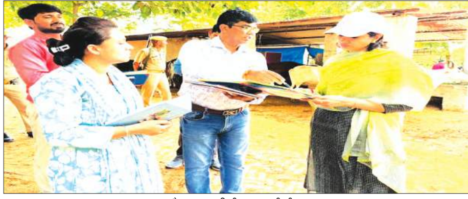
गौशाला का निरीक्षण करती डीएम

डीएम ने गौशाला के समस्त अभिलेखों का गहन अवलोकन किया गया तथा गोपालकों के भुगतान एवं गौशाला फंड की स्थिति के संबंध में जानकारी प्राप्त की गई। सचिव ने जानकारी का गोपालकों का भुगतान मार्च 2026 तक किया जा चुका है तथा गौशाला फंड की रिक्तिस्ट अप्रैल 2026 तक भेजी जा चुकी है।