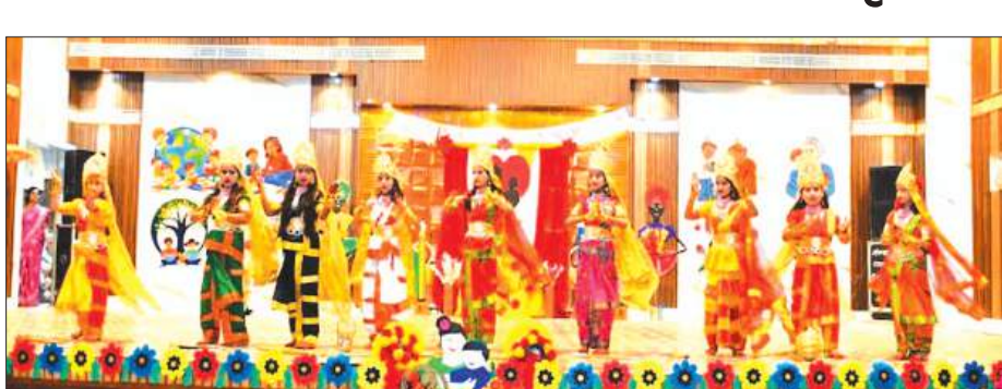
सांस्कृतिक कार्यक्रम प्रस्तुत करते बच्चे