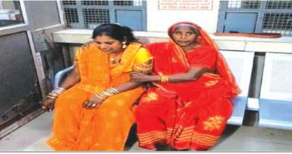
गुमशुम बैठे मृतक के परिजन