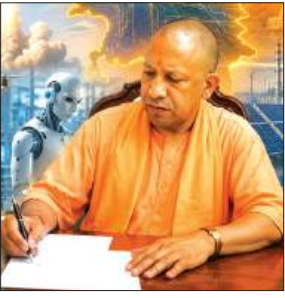
► सीएम योगी ने गिनाई उपलब्धियां, राष्ट्रीय प्रौद्योगिकी दिवस पर जनता के लिए लिखा पत्र

तकनीक के साथ चलने का अर्थ सुदृढ़ वर्तमान एवं स्वर्णिम भविष्य की दिशा में अग्रसर होना है। नवीनतम