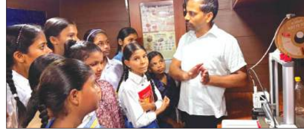
छात्राओं को विज्ञान के बारे में जानकारी देते शिक्षक

पौएम श्री महीयसी महादेवी वर्मा राजकीय बालिका इंटर कॉलेज फतेहगढ़ में विज्ञान एवं प्रौद्योगिकी परिषद लखनऊ की ओर से संचालित विज्ञान बस का आगमन हुआ। कक्षा 6 से 12 तक की छात्राओं ने विज्ञान के विभिन्न प्रयोगों के माध्यम से वैज्ञानिक तथ्यों को रोचक ढंग से समझा। आसपास के विद्यालयों के विद्यार्थी भी इस कार्यक्रम में उपस्थित रहे। विज्ञान बस में थ्री-डी प्रिंटर, माइक्रोस्कोप सहित कई आधुनिक उपकरणों के माध्यम से प्रयोग प्रदर्शित किए गए। छात्राओं को विज्ञान के महत्वपूर्ण सिद्धांतों जैसे बर्नौली प्रमेय तथा दाब के प्रभाव आदि को