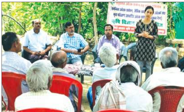
किसानों को जानकारी देते वैज्ञानिक