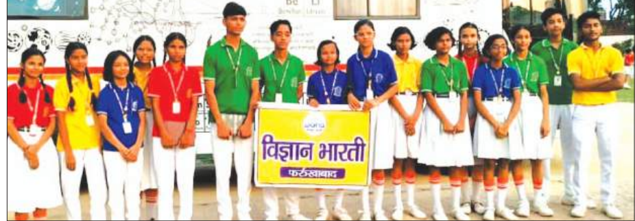
विज्ञान बस के साथ मौजूद विद्यार्थी