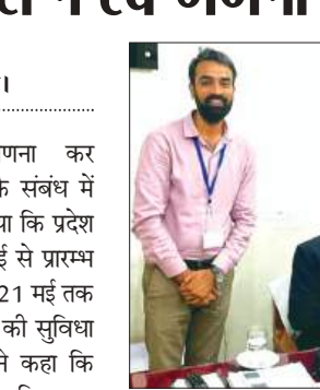
जनपद न्यायाधीश को स्वगणना कराते एडीएम

जनपद न्यायाधीश द्वारा स्व-गणना कर जनपदवासियों को जगणना 2027 के संबंध में महत्वपूर्ण संदेश दिया गया। उन्होंने बताया कि प्रदेश में जगणना 2027 की प्रक्रिया 07 मई से प्रारम्भ हो चुकी है। इसके अंतर्गत नागरिकों को 21 मई तक स्वयं अपनी जानकारी ऑनलाइन भरने की सुविधा प्रदान की गई है। जनपद न्यायाधीश ने कहा कि इच्छुक नागरिक भारत सरकार के आधिकारिक स्व-गणना पोर्टल के माध्यम से मोबाइल फोन, लैपटॉप अथवा कंप्यूटर का उपयोग कर स्वगणना कर सकते हैं। यह सुविधा पूर्णतः वैकल्पिक है तथा नागरिक अपनी सुविधा अनुसार इसका उपयोग कर सकते हैं। उन्होंने स्पष्ट किया कि जो लोग किसी कारणवश पोर्टल के माध्यम से स्वगणना नहीं कर पाएंगे, उन्हें चिंता करने की आवश्यकता नहीं है, क्योंकि 22 मई से जनगणनाकर्मी घर-घर जाकर प्रत्येक परिवार का