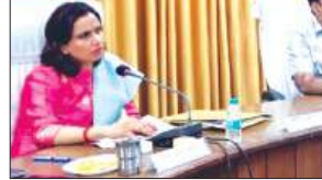
फर्रुखाबाद, समृद्धि न्यूज़।

जिलाधिकारी डॉ. अंकुर लाठर की अध्यक्षता में कलेक्ट्रेट सभागार में जनपद में संचालित गेहूं खरीद कार्य की समीक्षा बैठक आयोजित की गई। बैठक में गेहूं क्रय की प्रगति, उठान की स्थिति तथा क्रय केंद्रों पर व्यवस्थाओं की विस्तार से समीक्षा की गई। बैठक के दौरान जिला खाद्य विपणन अधिकारी द्वारा अवगत कराया गया कि जनपद में अब तक कुल 5502 मीट्रिक टन गेहूं की खरीद की जा चुकी है, जबकि इसके सापेक्ष 1485 मीट्रिक टन गेहूं का