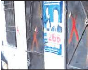
नगर निगम ने मार्किंग कर 5 दिन का नोटिस दिया