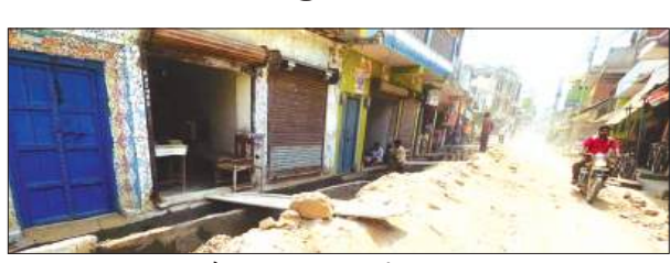
नगर पंचायत द्वारा खोदा गया नाला