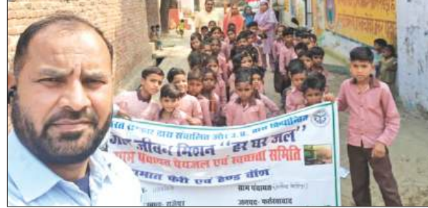
जल मिशन रैली में भाग लेते बच्चे