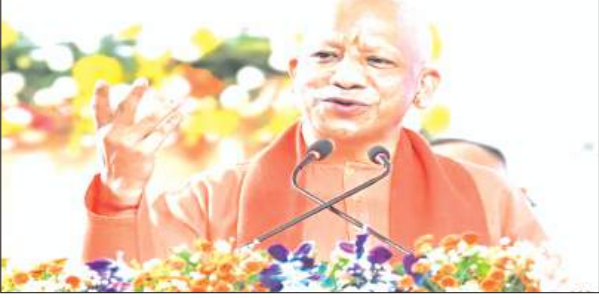
90 प्रतिशत सरकारी सहायता से संचालित परियोजनाओं को अधिक प्रभावी बनाने पर जोर

एजेंसी, लखनऊ। प्रदेश में पारंपरिक उद्योगों, हस्तशिल्प, बुनकरी और सूक्ष्म उद्यमों को नई मजबूती देने के लिए योगी सरकार प्रयासरत है। सरकार की मंशा है कि ओडीओपी योजना के तहत स्थापित कॉमन फैसिलिटी सेंटर सीएफसी सीमित लोगों तक न रहकर अधिक से अधिक कारीगरों, बुनकरों, सूक्ष्म उद्यमियों को आधुनिक तकनीक, प्रशिक्षण और विपणन सुविधाओं से जोड़े। इसी उद्देश्य से प्रदेश में संचालित 16 सीएफसी परियोजनाओं को विस्तृत समीक्षा की गई। मुख्यमंत्री योगी आदित्यनाथ ने कई सीएफसी में सीमित लाभार्थियों की स्थिति पर चिंता व्यक्त करते हुए स्पष्ट किया है कि योजनाओं का लाभ केवल