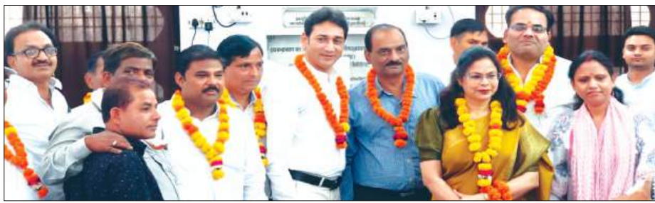
कार्यमगंज, समृद्धि न्यूज़।