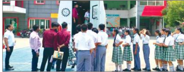
विज्ञान जागृकता कार्यक्रम में भाग लेते बच्चे

विज्ञान भारती के तत्वावधान में विज्ञान मेले का आयोजन हुआ। 12 मई को जिले से विभिन्न स्कूलों के बच्चों ने भाग लिया।