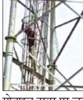
हैं। इसी विवाद और जमीन बिक्री के रुपये न मिलने से नाराज युवक मोबाइल टावर पर चढ़ गया। टावर पर चढ़ने के बाद उसने काफी देर तक हंगामा किया, जिससे इलाके में अफरा-तफरी का माहौल बन गया। ग्रामीणों ने युवक को नीचे उतरने का प्रयास किया, लेकिन वह अपनी मांगों पर अड़ा रहा। सूचना मिलने पर तालग्राम थाना पुलिस मौके पर पहुंची और युवक को समझाने का प्रयास किया। काफी देर चली बातचीत और कार्रवाई के आश्वासन के बाद युवक नीचे उतरने को तैयार हुआ। पुलिस मामले की जांच में जुटी है।