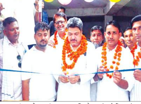
गुरसहायगंज, कन्नौज समृद्धि न्यूज।

नगर के तिराहा स्थित गुलजार मार्केट में गुरुवार को नए फुटवियर शोरूम का भव्य उद्घाटन समारोह आयोजित किया गया। कार्यक्रम के मुख्य अतिथि समाजवादी पार्टी के