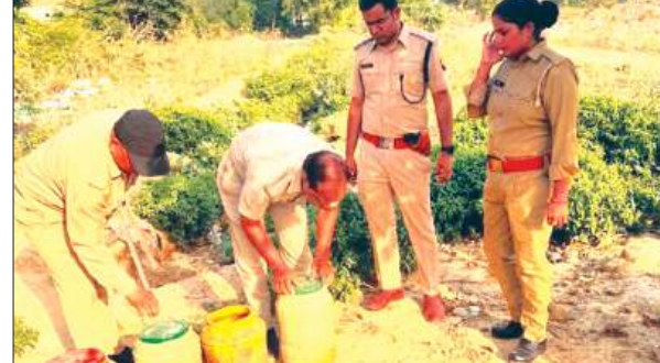
लहन नष्ट करती आबकारी पुलिस