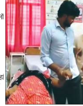
अस्पताल में भर्ती महिला

निरीक्षण के दौरान जिलाधिकारी ने निर्माण कार्यों की प्रगति, गुणवत्ता तथा सुरक्षा संबंधी व्यवस्थाओं का गहनता से अवलोकन किया। जिलाधिकारी ने पहुंचे मार्ग पर संभावित कटान वाले स्थलों का निरीक्षण करते हुए संबंधित