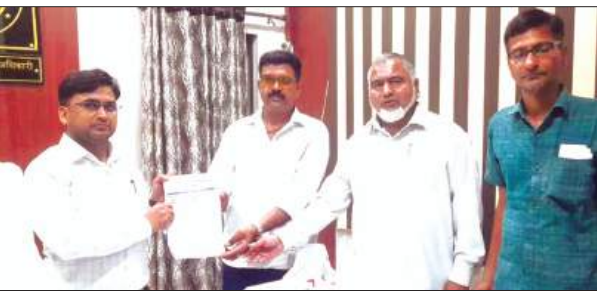
फर्रुखाबाद, समृद्धि न्यूज़।