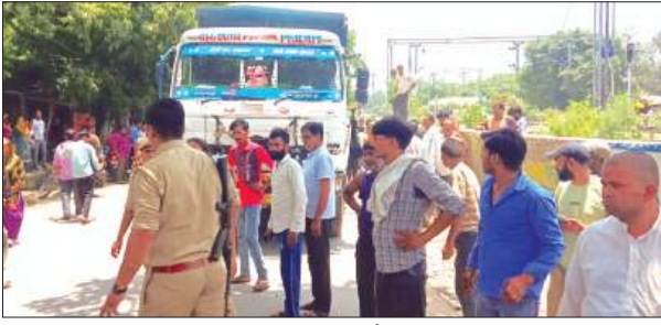
घटना स्थल पर खड़ा डंपर मौजूद स्थानीय लोग