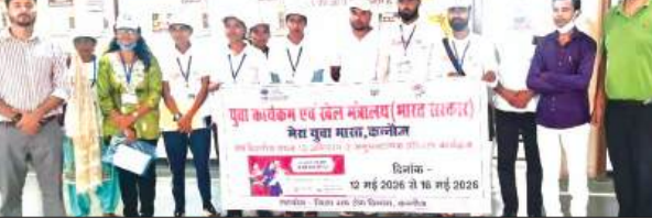
▶ टीबी 100 डे एलिमिनेशन प्रोग्राम के तहत युवाओं को दिया गया व्यावहारिक प्रशिक्षण

कन्नौज, समृद्धि न्यूज। मेरा युवा भारत एवं जिला क्षय रोग विभाग के संयुक्त तत्वावधान में संचालित 5 दिवसीय अनुभवात्मक प्रशिक्षण कार्यक्रम टीबी 100 डे एलिमिनेशन प्रोग्राम के तृतीय दिवस का आयोजन राजकीय मेडिकल कॉलेज तिरां में किया गया। कार्यक्रम का उद्देश्य युवाओं को टीबी उन्मूलन अभियान से जोड़ते हुए स्वास्थ्य सेवाओं की व्यावहारिक जानकारी प्रदान करना रहा। कार्यक्रम के दौरान युवाओं को मेडिकल कॉलेज में संचालित टीबी जांच एवं उपचार प्रणाली की विस्तृत जानकारी दी गई। प्रतिभागियों ने विभिन्न जांच प्रक्रियाओं, टेस्टिंग फैसिलिटी एवं