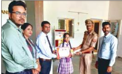
छात्रा को सम्मानित करते अग्निशमन अधिकारी