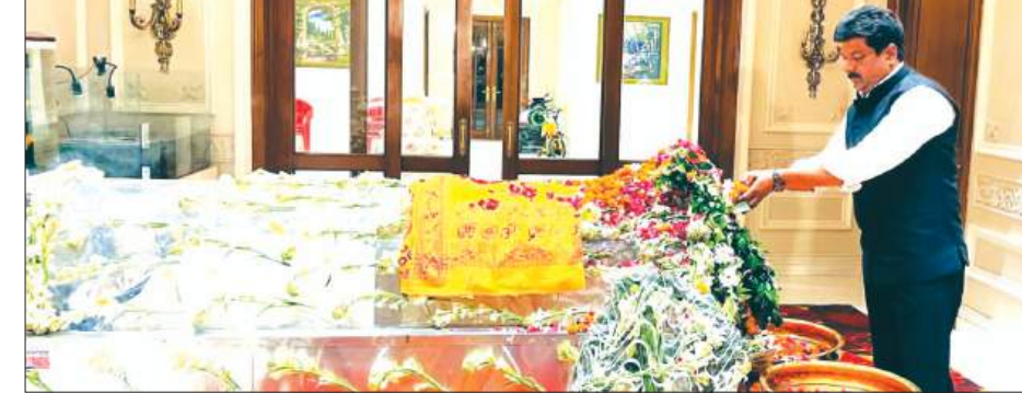
कहा कि दुख की इस घड़ी में पूरा क्षेत्र उनके परिवार के साथ खड़ा है। श्रद्धांजलि कार्यक्रम के दौरान मौजूद लोगों ने भी भावुक होकर अपनी संवेदनाएं प्रकट कीं और दिवंगत आत्मा को श्रद्धासुमन अर्पित किए। कार्यक्रम में समाजवादी पार्टी के कई कार्यकर्ता, क्षेत्रीय पदाधिकारी, युवा नेता एवं स्थानीय लोग बड़ी संख्या में उपस्थित रहे। सभी ने दो मिन्ट का मौन रखकर दिवंगत आत्मा की शांति के लिए प्रार्थना की। श्रद्धांजलि सभा का माहौल बेहद भावुक रहा तथा उपस्थित लोगों ने परिवार को ढ़ढस बंधाया।