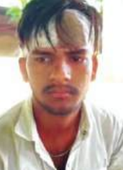
जानकारी देता पीड़ित