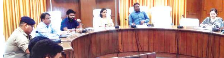
बैठक लेती डीएम मौजूद अधिकारियों

जिलाधिकारी डॉ. अंकुर लाठर द्वारा जनपद में प्रस्तावित लिंक एक्सप्रेसवे हेतु भूमि क्रय/अर्जन कार्यों की प्रगति की समीक्षा की गई। समीक्षा बैठक में अपर जिलाधिकारी वित्त एवं राजस्व, अपर जिलाधिकारी न्यायिक, उपजिलाधिकारी सदर, तहसीलदार सदर उपस्थित रहे। डीएम ने विभिन्न ग्रामों में भूमि खरीद एवं अधिलेखीय कार्यों की प्रगति का बिंदुवार परीक्षण किया। समीक्षा के दौरान पाया गया कि कुछ राजस्व कर्मियों द्वारा कार्यों में अपेक्षित गति एवं गंभीरता नहीं बरती