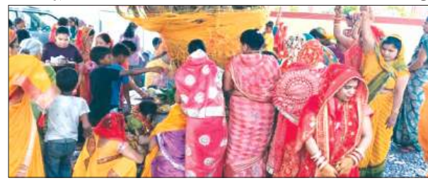
बरगद के वृक्ष की पूजा अर्चना करती महिलायें

भारत त्योहारों और उत्सवों का देश है। यहां की आध्यात्मिक परम्परा काफी मजबूत है। पूरे वर्ष में शायद ही कोई ऐसा मौसम रहता होगा जिसमें कोई न कोई त्योहार न हो। जेष्ठ मास की अमावस्या को अखण्ड सुहाग का प्रतीक