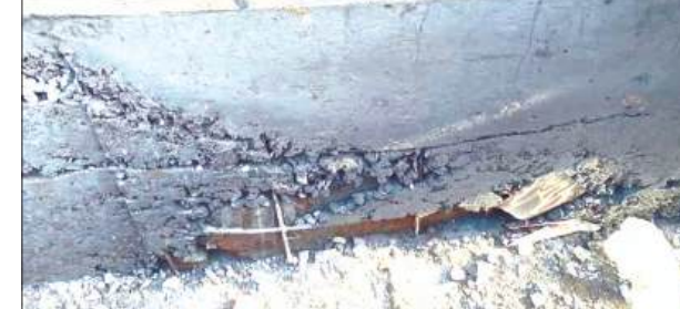
बनाई गयी नाली में दिखायी देता सरिया

कस्बा नवाबगंज में नगर पंचायत द्वारा बन रही नाली निर्माण में ठेकेदारों द्वारा की जा रही मनमानी से कस्बावासी परेशान है। ग्रामीणों का कहना है कि जो काम कर रहे मजदूर और ठेकेदार द्वारा कुछ कस्बा के लोग पैसों का लालच देकर अपने सामने की नाली को तिरछा करवा दे रहे हैं, जबकि पुरानी नाली बनी हुई थी। वह तक छोड़ी जा रही है नहीं उखाड़ी गई, उसे छोड़कर दूसरी नाली बनायी गयी है। कुछ लोगों ने अपनी दुकान के चबूतरा की दीवार नाली पर कर लिए जो ठेकेदार द्वारा छोड़