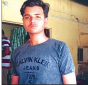
जानकारी देता पीड़ित