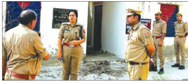
चौकी का निरीक्षण करती सीओ

सन् 1942 में जब लोगों में कानून का भय अधिक देखा जाता था और कानून तोड़ने वाले भी पुलिस से डरते थे। उस समय तत्कालीन अंग्रेज कलेक्टर हैरिस के आदेश पर अमृतपुर गांव के अंदर पुलिस चौकी निर्माण की स्वीकृति प्रदान की गई थी। इन निर्देशों के पालन में चार सिपाही और एक थानेदार कच्चे भवन में रहकर क्षेत्र में कानून व्यवस्था बनाए रखने का काम करता था। धीरे-धीरे विकास की राह पर चलने वाले गांव में प्रगति का मार्ग प्रशस्त हुआ और सन 1990 में चौकी से थाना बन गया। जो कि कस्बे से 2 किलोमीटर दूरी पर स्थापित किया गया। उसके बाद से लगातार इस पुलिस चौकी की अखेलेहना की गई। कभी इस पर लोगों ने कब्जा किया, कभी जानवर बांधे गए तो कभी अन्य तरीके से चौकी की स्थिति को बिगाड़