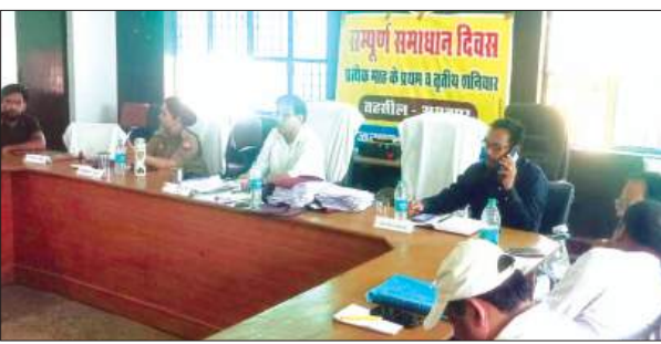
समस्यायें सुनते एसडीएम

उप जिलाधिकारी ने सभी विभागीय अधिकारियों को निर्देशित करते हुए कहा कि जनता की शिकायतों का निस्तारण गुणवत्ता पूर्ण, निष्पक्ष एवं