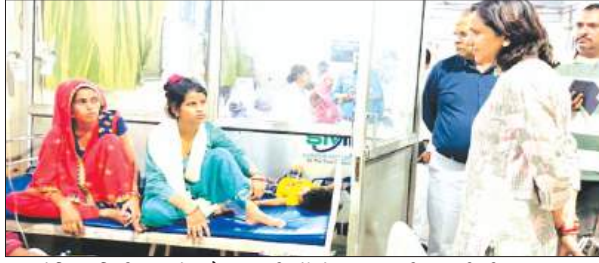
लोहिया निरीक्षण के दौरान मरीजों से जानकारी करती डीएम

साफ-सफाई व्यवस्था में तत्काल सुधार लाने के सख्त निर्देश दिए। जिलाधिकारी ने कहा कि अस्पताल में आने वाले मरीजों को स्वच्छ एवं बेहतर वातावरण उपलब्ध कराया जाना प्राथमिकता होनी चाहिए तथा सफाई व्यवस्था में किसी प्रकार की लापरवाही स्वीकार नहीं की जाएगी। निरीक्षण के दौरान अस्पताल के बाथरूम भी गंदे पाए गए, जिस पर जिलाधिकारी ने नाराजगी जताते हुए एन.एस.सी.यू. वार्ड सहित अन्य व्यवस्थाओं को समुचित सुविधाएं उपलब्ध कराने के उद्देश्य से सभी वार्डों में पर्याप्त संख्या में साफ चादर एवं तर्कित उपलब्ध कराने के निर्देश दिए। निरीक्षण के दौरान जिलाधिकारी ने