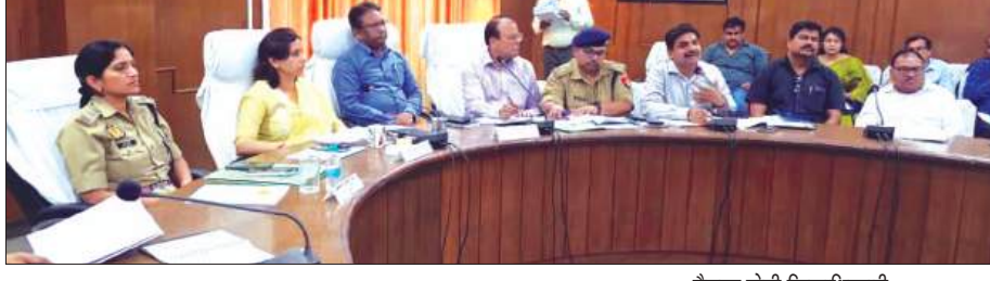
बैठक लेती जिलाधिकारी

वातावरण में संपन्न कराना सर्वोच्च प्राथमिकता है। उन्होंने निर्देशित किया कि सभी सेक्टर मजिस्ट्रेट परीक्षा दिवस पर प्रातः 07 बजे ट्रेजरी पर अनिवार्य रूप से उपस्थित रहेंगे तथा प्रश्नपत्रों के सुरक्षित वितरण एवं परीक्षा प्रक्रिया की सतत निगरानी सुनिश्चित करेंगे। प्रत्येक परीक्षा केंद्र पर स्टेटिक मजिस्ट्रेट की तैनाती की जाएगी, जो परीक्षा अवधि के दौरान केंद्र की सम्पन्न व्यवस्थाओं पर सतत दृष्टि बनाए रखेंगे। डीएम ने स्पष्ट निर्देश दिए कि परीक्षा केंद्रों के भीतर मोबाइल फोन, ब्लूटूथ डिवाइस, इलेक्ट्रॉनिक गैजेट, कागज के टुकड़े, प्लास्टिक पात्र, पर्स, स्मार्टबैंड, स्मार्टवॉच, सनग्लासेस, कैलकुलेटर एवं हैंडबैग सहित किसी भी प्रकार की प्रतिबंधित