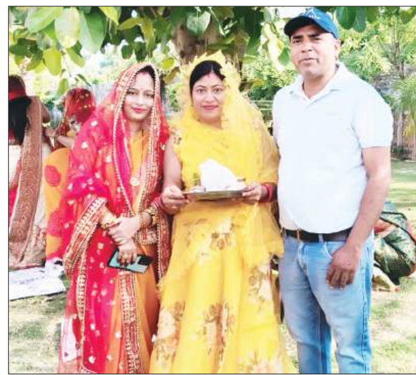
शाहजहांपुर, समृद्धि न्यूज।

वट सावित्री पूजा के अवसर पर शहर और ग्रामीण क्षेत्रों में महिलाओं ने वट वृक्ष के नीचे सुबह से ही विधिवान पूजा-अर्चना की। मंदिरों और वट वृक्षों के पास महिलाओं की भीड़ जुटनी शुरू हो गई थी। सुहागिन महिलाओं ने व्रत रखकर अपने पति की लंबी उम्र और परिवार की सुख-समृद्धि की कामना की। इस दौरान महिलाएं पारंपरिक वेशभूषा में समूह बनाकर पूजा करती नजर आईं। कई स्थानों पर महिलाओं ने सामूहिक रूप से भजन-कीर्तन भी किए। इस