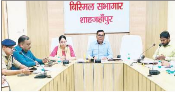
शाहजहांपुर, समृद्धि न्यूज।

डीएम की अध्यक्षता में जनपद में सम्भावित बाढ़ से बचाव के दृष्टिगत स्टेयरिंग कमटी की बैठक आयोजित