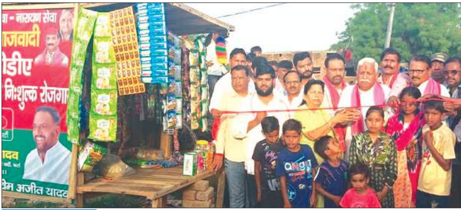
मोट की दुकान