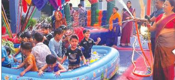
पूल वाटर गेम में आनंद लेते बच्चे

सेण्ट पाल्स ब्राइटन एकेडमी सौनियर सेकेंडरी स्कूल बंधोआ नेकपुर फतेहगढ़ के प्री-प्राइमरी विंग में नन्हे-मुन्हे बच्चों के लिए एक शानदार एवं मनोरंजक पूल पार्टी का आयोजन किया गया। विशेष कार्यक्रम का उद्देश्य बच्चों को गर्मी के मौसम में आनंददायक अनुभव प्रदान करना तथा उनके भीतर उत्साह और आत्मविश्वास बढ़ाना है। कार्यक्रम में नर्सरी, एलकेजी एवं यूकेजी के बच्चों ने बड़े उत्साह के साथ भाग लिया। पूल पार्टी के दौरान बच्चों ने रंग-बिरंगी स्विमिंग ड्रेस पहनकर पानी में विभिन्न मनोरंजक गतिविधियों का आनंद लिया। बच्चों के लिए छोटे-छोटे पूल,