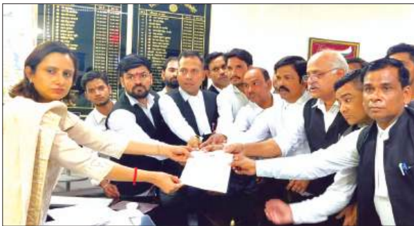
डीएम को ज्ञापन सौंपते अधिवक्ता