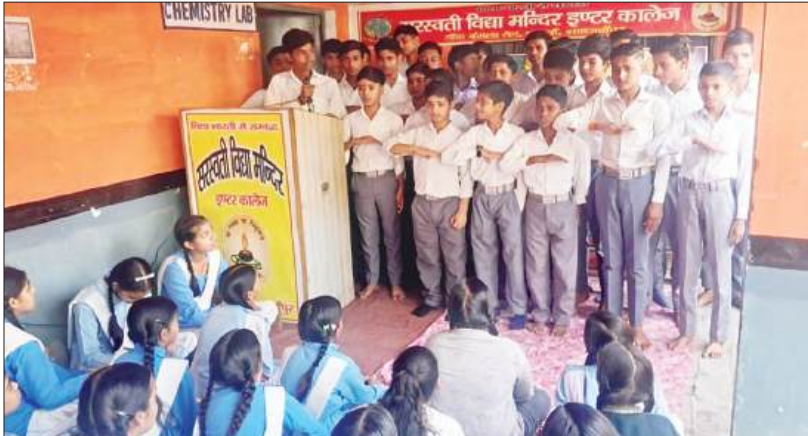
पुवायां, शाहजहांपुर, समृद्धि न्यूज।