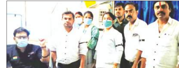
काली पट्टी बांधकर विरोध करते सविदा स्वास्थ्य कर्मी

राष्ट्रीय स्वास्थ्य मिशन कर्मचारी संघ के प्रदेश नेतृत्व के आवाहन पर जिले भर में सविदा स्वास्थ्य कर्मियों ने काली पट्टी बांधकर विरोध प्रदर्शन किया। जनपद में लगभग राष्ट्रीय स्वास्थ्य मिशन के अन्तर्गत एक हजार कर्मचारी सविदा पर विभिन्न संवर्गों में कार्यरत हैं। स्वास्थ्य विभाग को अपनी सेवायें दे रहे हैं। मार्च एवं अप्रैल 2026 का मानदेय अभी तक प्राप्त नहीं हुआ है। मई माह भी आधा हो चुका है। मानदेय संबंधी सभी कर्मचारियों को विगत 2025 के सितम्बर माह से परेशानी हो रही है। इस कारण तीन से चार माह तक का कर्मचारियों को मानदेय नहीं मिल पाता है। जिसके विरोध में जिलाध्यक्ष