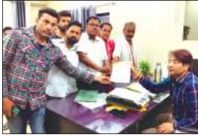
उपजिलाधिकारी को ज्ञापन सौंपते व्यापारी