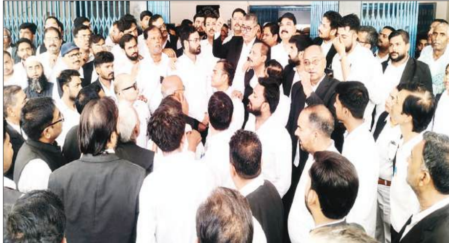
से घायल हुए हैं और उनका इलाज चला रहा है। इन लोगों ने पुलिस के लाठी चार्ज के विरोध में घटना को न्यायिक जांच की मांग किया और