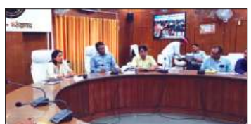
बैठक लेती डीएम

► खराब प्रगति पर बाल विकास परियोजना अधिकारी मोहम्मदाबाद व क्षेत्रीय मुख्य सेविका जो कारण बताओ नोटिस जारी