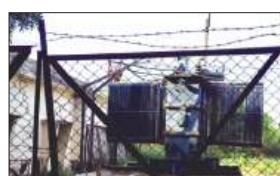
खराब पड़ा ट्रांसफार्मर

भीषण गर्मी के बीच नगर की बिजली व्यवस्था पूरी तरह बेपटरी हो गई है। पिछले तीन दिनों से लगातार हो रही बिजली ट्रिपिंग ने लोगों का जीना बेहाल कर दिया है। रविवार रात हालात उस समय और बिगड़ गए, जब अत्यधिक ट्रिपिंग और तेज वोल्टेज उतार-चढ़ाव के कारण नगर के कई घरों में टीवी, फ्रिज, इनवर्टर, कूलर, पंखे और अन्य विद्युत उपकरण फुंक गए। अचानक हुए धमाकों और स्पार्किंग की आवाजों से कस्बे में हड़कंप मच गया। लोग घबराकर देर रात तक घरों से बाहर निकल आए। कस्बावासियों के अनुसार रविवार को बिजली दर्जनों बार तेजी से ट्रिप हुई। कभी बिजली कुछ सेकेंड के लिए