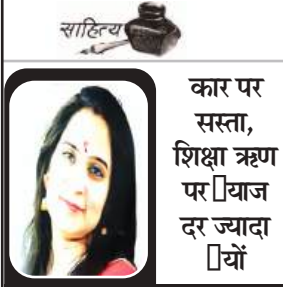
कार पर सस्ता, शिक्षा त्रण पर जायदर ज्यादा प्यो

प्रेशर सिंचाई प्रणाली, सिंचाई हेतु कृषि विकास की दिशा में एक प्रभावी कदम प्रदेश के मुख्यमंत्री योगी आदित्यनाथ के नेतृत्व में किसानों को फसल उत्पादन बढ़ाने के लिए अनेकों सुविधाएं दी जा रही हैं। इन्हीं सुविधाओं में सिंचाई सुविधा एक महत्वपूर्ण विधा है। प्रदेश के किसानों को नहरों, राजकीय नलकूपों, निजी नलकूपों, तालाबों, बांध-बन्धियों आदि के माध्यम से सिंचाई सुविधा दी जा रही है। इसके अलावा अन्य सिंचाई विधाओं पर भी प्रदेश सरकार अधिकतर ध्यान का निर्माण कर रही है। प्रदेश में कृषि क्षेत्र की सम्पत्ता अधिकांश सिंचाई व्यवस्था पर निर्भर करती है, लेकिन प्रांशिक नहर आधारित प्रणालियों में जल की बर्बादी, असमान जल वितरण और सीमित पहुंच जैसी समस्याएँ लंबे समय से बनी रही हैं। सरयू नहर परियोजना, जिसकी प्रस्तावित सिंचाई क्षमता लगभग 14.04 लाख हेक्टेयर है, भी इन चुनौतियों से अछूती नहीं रही।