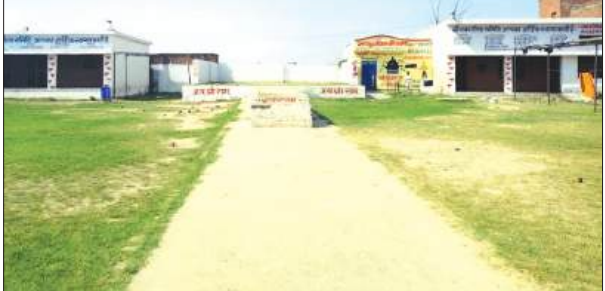
रामलीला मैदान का मंच

इसके लिए कमेटी के चंदे पर निर्भर नहीं रहेंगे। उद्देश्य यह था कि टीन शेड लगने से न केवल मैदान की शोभा बढ़ेगी, बल्कि मंचन के दौरान कलाकारों को होने वाली परेशानियों से भी मुक्ति मिलेगी।