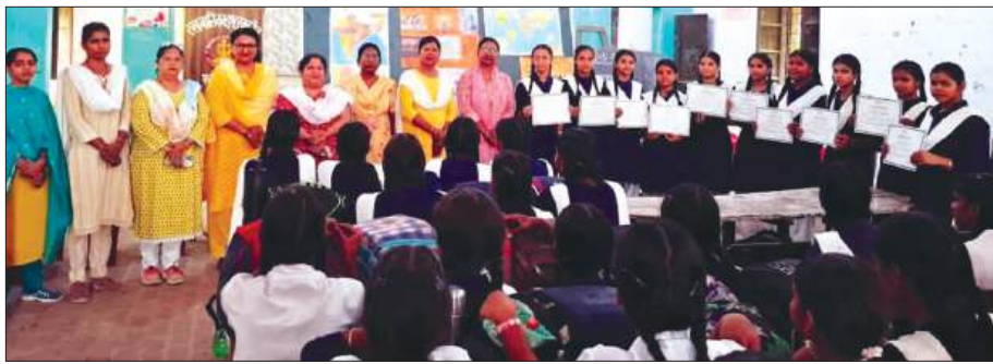
समर कैम्प में मौजूद शिक्षिकों व छात्रों

रखा बालिका इंटर कालेज फतेहगढ़ में भारतीय भाषा समर कैम्प का आयोजन हुआ। जिसका उद्देश्य राष्ट्रीय शिक्षा नीति 2020 के अनुरूप बहुभाषिका को बढ़ावा देना व राष्ट्रीय एकता की भावना को सुदृढ़ करने तथा विभिन्न भाषाओं के माध्यम से सांस्कृतिक आदान-प्रदान को प्रोत्साहित करने के उद्देश्य से भारतीय भाषा समर कैम्प का आयोजन किया गया। समर कैम्प के अन्तर्गत छात्रों को वर्णमाला का ज्ञान व दैनिक जीवन व नैतिक कर्तव्यों का मूल, अभिवादन की जानकारी दी