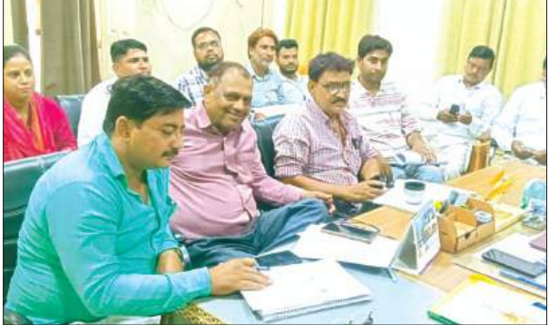
बैठक में मौजूद सचिव

आईडी पर भी विशेषता से जोर दिया। बीडीओ ने सभी ग्राम पंचायत को बताया इस पर सरकार तथा अधिकारी अप्रसर हैं, इसलिए हर हाल में सरकारी योजनाओं को धरातल पर लाने का