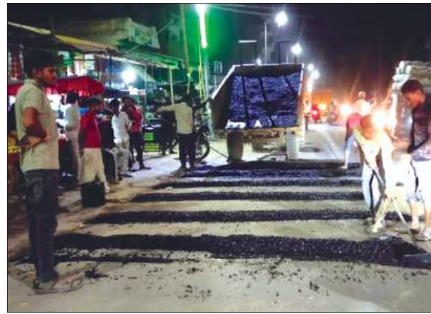
स्पीड ब्रेकर बनाते कर्मचारी

डंपर की टक्कर से हुई थी बाइक सवार की मौत स्थानीय लोगों के मुताबिक, इस मुख्य चौराहे और इसके आसपास के क्षेत्रों में आए दिन दुर्घटनाएं होती रहती हैं, जिनमें कई लोग अपनी जान गंवा चुके हैं। सोमवार को नवाबगंज नगर के मोहम्मदाबाद रोड पर एक भीषण