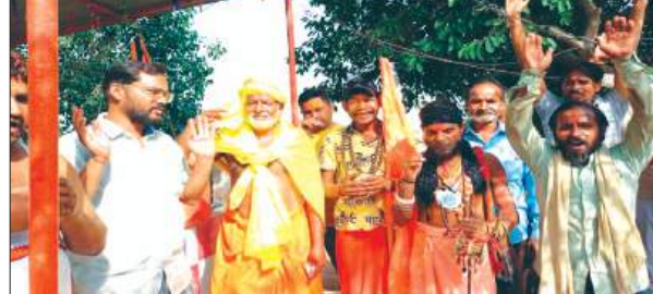
पदयात्रा में शामिल सामु-संत