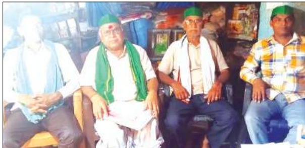
बैठक में मौजूद माकियू नेता

मांग पूरी न होने पर किया जायेगा आंदोलन कायमगंज, समृद्धि न्यूज़।