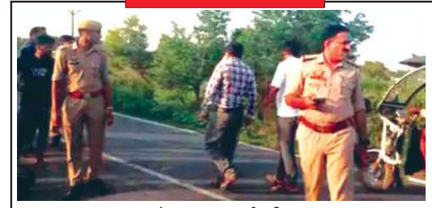
जाँच पड़ताल करती पुलिस

पर बढ़ते आक्रोश के बाद पीडब्ल्यूडी विभाग हकत में आया। मंगलवार शाम को विभाग के कर्मचारियों ने मुख्य चौराहे के पास पहुंचकर युद्धतर पर स्पीड ब्रेकर बनाने का काम शुरू कर दिया। स्थानीय निवासियों का कहना है यहाँ से गुजरने वाले भारी वाहन बेहद तेज गति में होते हैं। स्पीड ब्रेकर बनने से वाहनों की रफ्तार पर लगाम लगेगी और भविष्य में होने वाले हादसों को रोका जा सकेगा। हालांकि, यह कदम और पहले उठाना जाना चाहिए था, ताकि किसी की जान न जाती। विभाग का कहना है कि चौराहे के सभी संवेदनशील पॉइंट पर गति अवरोधक बनाने का काम तेजी से पूरा किया जा रहा है, ताकि यातायात को सुरक्षित बनाया जा सके।