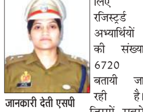
जानकारी देती एएसपी

21 मई को जनपद में लेखपाल मुख्य परीक्षा (प्रा.अ.प.-2025)/01 के दृष्टिगत परीक्षा में भारी संख्या में परीक्षार्थियों एवं उनके अभिभावकों के आगमन की संभावना है। परीक्षार्थियों को समय से परीक्षा केंद्रों पर पहुँचने, यातायात व्यवस्था को सुगम-सुचारु रूप से संचालित करने तथा शहर को जाम से मुक्त रखने हेतु 21 मई को परीक्षा समाप्ति तक हल्के एवं भारी वाहनों के लिए रूट डायवर्जन किया गया है। इसके लिए जिले में 19 परीक्षा केंद्र बनाए गए हैं। सबसे बड़ा केंद्र रजिस्ट्री इंटर कालेज बनाया गया है। जिसमें 600 अभ्यर्थी बैठेंगे। लेखपाल भर्ती परीक्षा के लिए सभी 19 केंद्रों के लिए सेक्टर मजिस्ट्रेट तैनात किये गये हैं। सभी 19 केंद्रों के