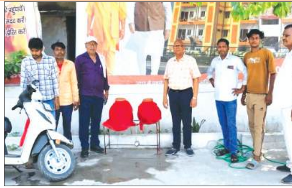
प्याऊ का शुभारम्भ करते ईओ