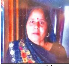
मृतका का फाइल फोटो

गांव के बाहर बने नए मकान पर जाने की बात कहकर निकली थी