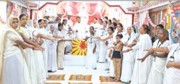
फर्रुखाबाद, समृद्धि न्यूज़।