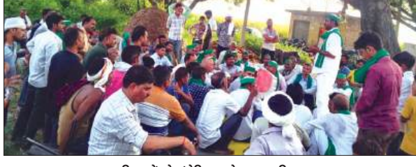
किसानों को संबोधित करते अजय कटियार

ग्राम पंचायत नीबकरौरी की ग्राम सभा नगला दरियाव में लिक एक्सप्रेसवे के कटो में जा रही जमीनों को के विरोध में बैठक की गई। निर्णय लिया गया कि लिक एक्सप्रेसवे बनाया जा रहा है, उसके कटो पर ज्यादा जमीनें ली जा रही है, जबकि आगरा लखनऊ एक्सप्रेसवे में रोड के समानांतर उत्तरने चढ़ने के लिए रोड बनाए गए हैं, ऐसा ही इस लिक एक्सप्रेसवे में बनाए जाए। जिलाध्यक्ष अजय कटियार ने कहा कि किसानों 2013 भूमि अधिग्रण कानून के हिसाब से मानसिक क्षतिपूर्ण राशि देनी पड़ेगी और कटो पर जो बेतहाशा जमीन ली जा रही है उनको भी छोड़ना पड़ेगा। किसानों को एक जुट रहना ही पड़ेगा। उन्होंने कहा है कि 22