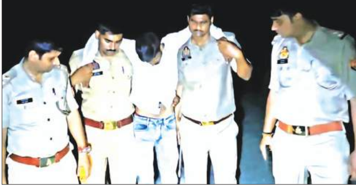
लगातार आरोपी की तलाश में संभावित ठिकानों पर दबिश दे रही थी। पुलिस अधिकारियों के अनुसार आरोपी की गिरफ्तारी को लेकर धाना खीरी पुलिस लगातार रणनीति के तहत काम कर रही थी।