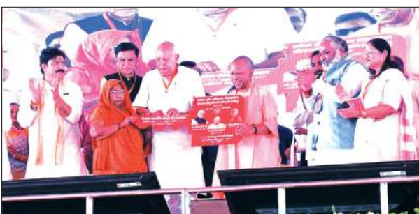
हम समस्या नहीं, समाधान देते हैं : सीएम

सीएम योगी शुक्रवार को देवरिया शहर से सटे पोखरभंडा गांव में आयोजित जनसभा को संबोधित कर रहे थे। इस दौरान उन्होंने 655 करोड़ 45 लाख रुपये लागत की 19 विकास