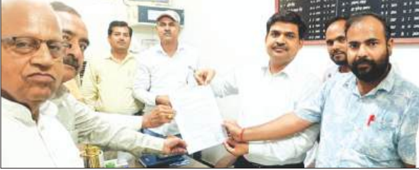
डीआईओएस को ज्ञापन सौंपते कर्मचारी

दवा-इलाज एवं रोजगार की जरूरतें पूरी कर पाना संभव नहीं है। सत्य तो यह है कि 8315 में आजकल कोई दैनिक मजदूर भी कार्य करने को तैयार नहीं होता।