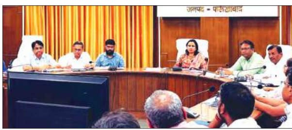
बैठक लेती डीएम मौजूद अधिकारीगण

जिलाधिकारी डॉ. अंकुर लाटर की अध्यक्षता में कलेक्ट्रेट सभागार में मुख्यमंत्री देशबोर्ड के अंतर्गत विकास कार्यों की माह अप्रैल 2026 की समीक्षा बैठक आयोजित की गई। बैठक में विभिन्न विभागों द्वारा संचालित योजनाओं एवं विकास कार्यों की प्रगति की विस्तृत समीक्षा की गई। समीक्षा में जनपद को प्रदेश स्तर पर विकास कार्यों में 14वां स्थान प्राप्त हुआ। बैठक के दौरान 28 विभागों की कुल 86 योजनाओं की प्रगति का बिंदुवार परीक्षण किया गया। जिलाधिकारी ने योजनाओं के क्रियान्वयन, लक्ष्य प्राप्ति, प्रगति रिपोर्ट