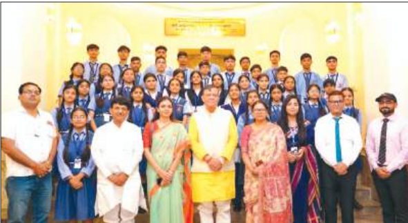
विधानसभा अध्यक्ष के साथ विधायक व स्कूली बच्चे