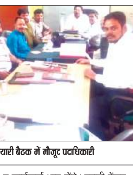
तैयारी बैठक में मौजूद पदाधिकारी

फर्रुखाबाद, समृद्धि न्यूज़। सयुक्त संघर्ष संचालन समिति के नवनियुक्त जिलाध्यक्ष की देखरेख में 24 मई को डॉ. राममनोहर लोहिया चिकित्सालय पुरुष सभागार में मण्डलीय संकल्प सम्मेलन का आयोजन होगा। जिसमें कानपुर