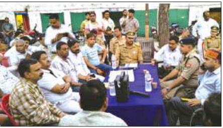
छिब्रामऊ, कन्नौज समृद्धि न्यूज।