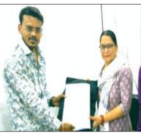
स्व गणना का समापन होने के बाद 22 मई से प्रगणकों एवं पर्यवेक्षकों को फील्ड में जाकर डिजिटल टूलस का उपयोग करते हुए हर मकान की सही नंबरिंग, विवरण संकलन और मैपिंग करना है। विदित हो कि अप्रैल माह में नगर क्षेत्र के लिए 40-40 के तीन बीच में कुल 93 प्रगणकों एवं 12 सुपरवाइजरों को मास्टर ट्रेनिंग में प्रशिक्षण दिया गया।

नगर पालिका परिषद क कार्यालय में भारत की आगामी जनगणना 2027 के प्रथम चरण (मकान सूचीकरण एवं मकानों की गणना) के लिए प्रशिक्षण प्राप्त प्रगणकों एवं सुपरवाइजरों को किट का वितरण किया गया।