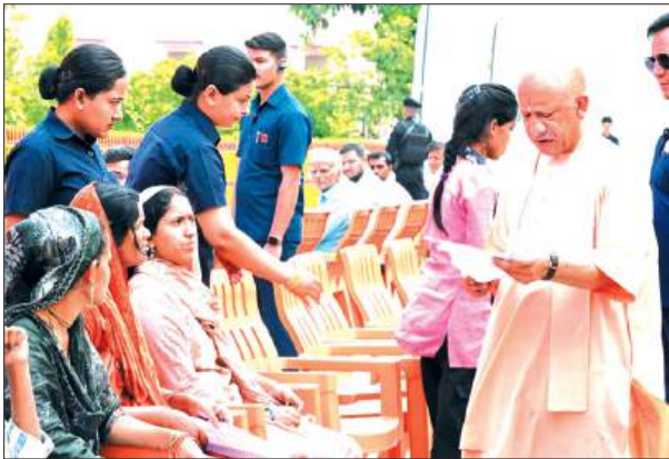
लापरवाही बर्दाश्त नहीं होगी।

मुख्यमंत्री योगी आदित्यनाथ ने गोरखपुर में सुबह गोरखनाथ मंदिर में जनता दर्शन में लोगों को आश्चर्य करते हुए कहा कि सबकी समस्या का समाधान सरकार की प्राथमिकता है। उन्होंने अधिकारियों को निर्देशित किया कि जन समस्याओं का निस्तारण तत्परता, पारदर्शिता और संवेदनशील ढंग से किया जाए। इसमें शिथिलता या