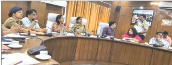
बैठक लेती डीएम मौजूद एएसपी आदि