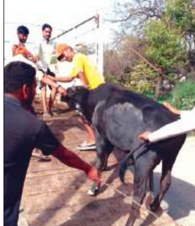
गौवंश पकड़ने पालिका कर्मी