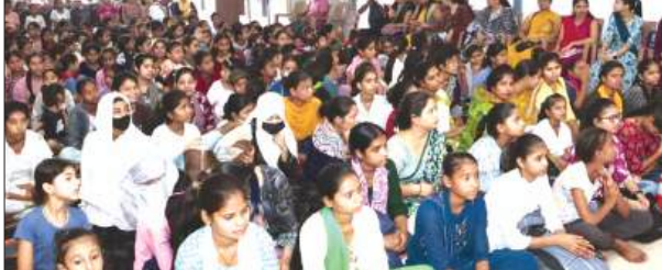
प्रशिक्षण में मौजूद छात्रों