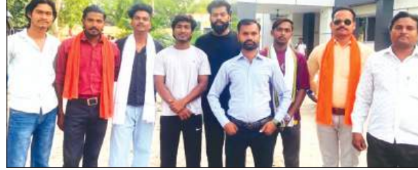
ज्ञापन देने के बाद जानकारी देते पदाधिकारी