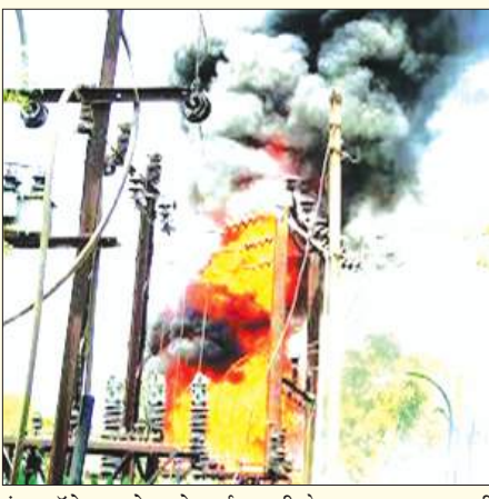
इंटर कॉलेज जाने वाले मार्ग पर भी केबल बार-बार जलती

समृद्धि न्यूज, खुदागंज, शाहजहांपुर। नगर एवं ग्रामीण क्षेत्रों में लगातार हो रही रात्रिकालीन बिजली कटौती से आमजन का जनजीवन बुरी तरह प्रभावित हो रहा है। भीषण गर्मी और मच्छरों के बढ़ते प्रकोप के बीच घंटों बिजली गुल रहने से लोगों में बिजली विभाग के प्रति भारी नाराजगी व्याप्त है। खुदागंज पावर हाउस से जुड़े नगर और ग्रामीण इलाकों के उपभोक्ताओं का आरोप है कि रात के समय कई-कई घंटे तक बिजली आपूर्ति बाधित रहती है, जिससे लोगों की नींद हथकड़ी में रह गई है। सबसे अधिक परेशानी छोटे बच्चों, बुजुर्गों और बीमार लोगों को उठानी पड़ रही है। उमस भरी गर्मी में लोग पूरी रात जागने को मजबूर हैं। बृहस्पतिवार को नगर के मोहल्ला गठन में ट्रांसफार्मर से सप्लाई के लिए लगी पेंच केबल जल जाने के कारण करीब 12 घंटे तक विद्युत आपूर्ति बाधित रही। इसके चलते लोगों को भीषण गर्मी का सामना करना पड़ा। वहीं नगर के मुख्य चैराहे से लाल हरिाराम