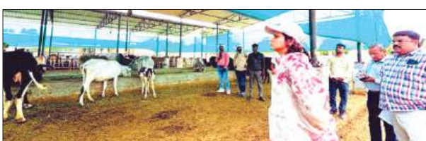
गौशाला का निरीक्षण करती डीएम

जिलाधिकारी डॉ. अंकुर लाउर ने कान्हा गौशाला देवसम गादिशा का आंचक निरीक्षण कर वहां संरक्षित गौवंशों की व्यवस्थाओं का जायजा लिया। निरीक्षण के दौरान गौशाला में गौवंश सुरक्षित एवं संरक्षित पाए गए। जिलाधिकारी ने गौशाला में संचालित व्यवस्थाओं की विस्तार से समीक्षा करते हुए पशु टीकाकरण रजिस्टर, सहभागिता रजिस्टर, स्टॉक रजिस्टर सहित अन्य अभिलेखों का निरीक्षण किया। निरीक्षण के दौरान उपस्थित पशु चिकित्सक द्वारा अवात कराया गया कि सहभागिता योजना के अंतर्गत अब तक 70 गौवंश विभिन्न व्यक्तियों को सुपुर्द किए जा चुके हैं तथा उनका प्रत्येक माह नियमित स्वास्थ्य परीक्षण एवं चेकअप कराया जाता है। साथ ही