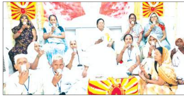
प्रशिक्षण शिविर में मौजूद लोग