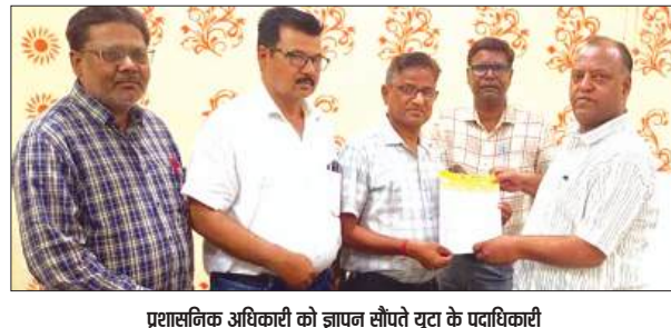
प्रशासनिक अधिकारी को ज्ञापन सौंपते यूटा के पदाधिकारी

यूनाइटेड टीचर्स एसोसिएशन ने मुख्यमंत्री संबोधित ज्ञापन कलेक्ट्रेट पहुंचकर मुख्य प्रशासनिक अधिकारी को सौंपा। ज्ञापन में मांग की गई कि भीषण गर्मी के चलते तीब्र धूप एवं मौसम विभाग की हीटवेव, लू की चेतावनी को ध्यान में रखते हुए जनगणना कार्य जुलाई में कराये जाने की मांग की है। जनगणना निदेशालय द्वारा दिये गये निर्देशों के क्रम में प्रदेश भर में जनगणना का कार्य प्रक्रियारत है। समूचे प्रदेश में भयंकर गर्मी, तीब्र असहनीय धूप का प्रकोप है। अधिकांश जनपदों में दिन में तापमान 45 डिग्री से अधिक हो जाता है।