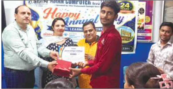
कार्यक्रम में सम्मानित होता छात्र