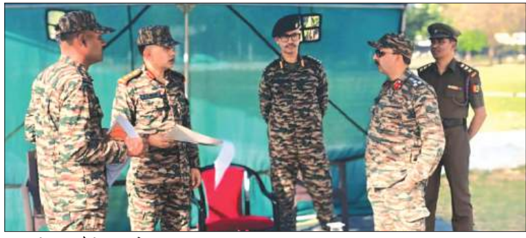
कैम्प का निरीक्षण करते हुए कमांडर