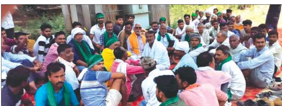
धरने पर बैठे भाकियू नेता

भारतीय किसान यूनियन अखण्ड प्रदेश के नेतृत्व में किसानों ने बिजली कटौती के विरोध में धरना देकर एसडीओ कार्यालय नवाबगंज जाकर ज्ञापन सौंपा। शमशाबाद के अन्तर्गत हजियापुर फीडर पर सैकड़ों की संख्या में किसानों ने पहुंचकर धरना में भाग लिया। समस्याओं का निस्तारण करने के लिए एसडीओ ने आशवासन दिया। तब देर शाम धरना समाप्त हुआ। मुख्यमंत्री संबोधित ज्ञापन एसडीओ को सौंपा गया। जिसमें मांग की गई कि ग्राम