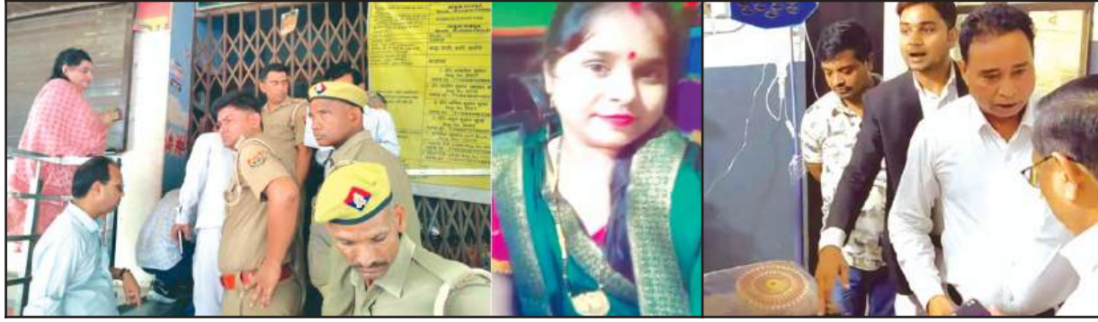
परिचय-अस्पताल सील कराती नगर मजिस्ट्रेट व मृतका का फाउल फोटो