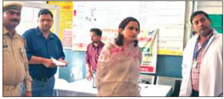
सीएचसी का निरीक्षण करती डीएम

जिलाधिकारी डॉ. अंकुर लाउर ने सामुदायिक स्वास्थ्य केंद्र कमालगंज का आंचक निरीक्षण किया। निरीक्षण के दौरान जिलाधिकारी ने स्वास्थ्य सेवाओं की गुणवत्ता, स्वच्छता व्यवस्था एवं मरीजों को उपलब्ध कराई जा रही सुविधाओं का गहनता से जायजा लिया तथा संबंधित अधिकारियों को आवश्यक दिशा-निर्देश दिए। निरीक्षण के दौरान डीएम ने रजिस्ट्रेशन काउंटर पर रजिस्ट्रेशन रजिस्टर का अवलोकन किया। जिसमें कुल 200 मरीजों के पंखे बनाए जाने पाये। डीएम ने निर्देशित किया कि रजिस्ट्रेशन के समय प्रत्येक मरीज की आभा आईडी अनिवार्य रूप से बनाई जाए, जिससे स्वास्थ्य सेवाओं का डिजिटल रिकॉर्ड सुव्यवस्थित रखा जा सके। आयुष्म ओपीडी के निरीक्षण के दौरान जिलाधिकारी ने वहां उपलब्ध दवाओं की सूची चष्मा कराने के निर्देश दिए। निरीक्षण में अस्पताल की बेडरोट एवं बाथरूम गंदे पाए गए, जिस पर जिलाधिकारी ने नाराजगी व्यक्त करते हुए तत्काल साफ-सफाई सुनिश्चित कराने के निर्देश दिए। डीएम ने बायो मेडिकल वेस्ट प्रबंधन व्यवस्था का भी निरीक्षण किया। निरीक्षण में डस्टबिन कवर कोडिंग के अनुसार नहीं पाए गए तथा गंदगी की स्थिति भी पाई गई। इस पर उन्होंने संबंधित