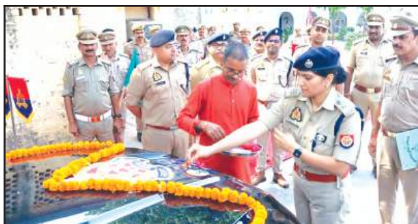
नये वाहनों का पूजन करती एसपी

पुलिस अधीक्षक द्वारा पुलिस लाइन फतेहगढ़ परिसर से आपातकालीन सेवा डायल 112 की 17 चार पहिया वाहनों को हरी झण्डी दिखाकर विधिवत रवाना किया गया। इस अवसर पर संबंधित पुलिस कर्मियों को आवश्यक दिशा-निर्देश देते हुए कहा कि डायल 112 सेवा आमजन की त्वरित सहायता एवं सुरक्षा का महत्वपूर्ण माध्यम है नई गाड़ियों के आने से पुलिस का रिसॉन्स टाइम बेहतर होगा और घटनास्थल पर तेजी से पहुंचना संभव होगा। साथ ही इन वाहनों से शहर और ग्रामीण क्षेत्रों में गश्त भी मजबूत होगी। जिससे अपराध नियंत्रण में मदद मिलेगी। अतः प्रत्येक