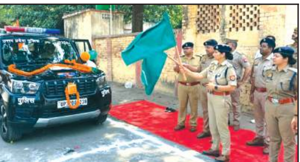
पीआरवी को हरी झण्डी दिखाती पुलिस अधीक्षक