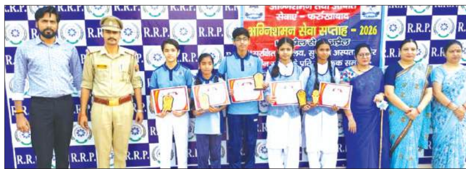
कार्यक्रम में सम्मानित होते विद्यार्थी