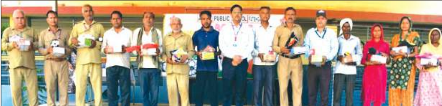
फर्रुखाबाद, समृद्धि न्यूज़।