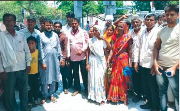
ज्ञापन देने के बाद जानकारी देते ग्रामीण

स्मार्ट मीटर को लेकर थाना कमालगंज के ग्रामीणों का गुस्सा फूट पड़ा। नाराज ग्रामीण बड़ी संख्या में फतेहगढ़ आफिसर क्लब पहुंच गये और स्मार्ट मीटर बदलने के लिए मुख्यमंत्री संबोधित ज्ञापन संबंधित अधिकारी को सौंपा। थाना कमालगंज के ग्राम जरारी के एक दर्जन से अधिक ग्रामीण आफिसर क्लब पहुंचे। जहां उन्होंने स्मार्ट मीटर के खिलाफ विरोध प्रदर्शन किया और मुख्यमंत्री संबोधित ज्ञापन सौंपा। दिये गये ज्ञापन में कहा कि स्मार्ट मीटर