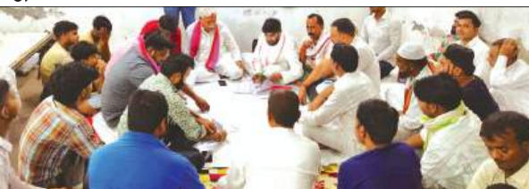
वोटर लिस्ट स्कैनिंग करते सपा नेता