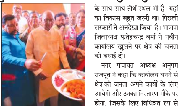
नवीन कार्यालय का उद्घाटन करते सांसद व विधायक