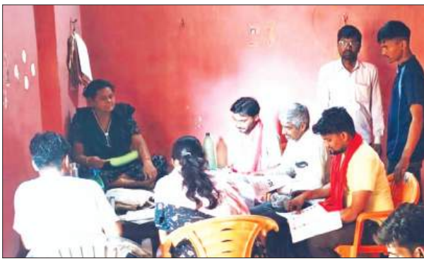
वोटर लिस्ट चेक करते सपा नेता

समाजवादी पार्टी 2027 विधानसभा चुनाव को मद्देनजर रखते हुए पूरी तरह से चुनावी मोड़ में आ चुकी है। सपा मुखिया एक तरफ जहां आए दिन महंगाई, बेरोजगारी, पेपर लीक, आरक्षण एवं अपराध को लेकर सरकार पर हमलावर रहने के साथ ही पीछे के बैनर तले जहां पार्टी की सोशल इंजीनियरिंग मजबूत करने में लगे हैं, वहीं दूसरी तरफ एसआईआर प्रक्रिया पूर्ण होने के बाद अचानक से पार्टी के पदाधिकारी कार्यकर्ता बूथ पर माइक्रो लेवल मैनेजमेंट के लिए एक