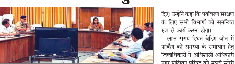
बैठक लेती डीएम

गतिविधियों को सुगम बनाने के लिए आवश्यक कदम उठाए जाएंगे। डीएम ने नगर क्षेत्र में बढ़ती आवारा गौशय की समस्या के समाधान हेतु प्रतिदिन अभियान चलाकर गौशयों को पकड़ने एवं उन्हें सुरक्षित गोशालाओं में भेजने के निर्देश दिए। उन्होंने कहा कि इससे यातायात व्यवस्था सुचारू होगी तथा व्यापारियों एवं आमजन को राहत मिलेगी। बैठक में शहर के विभिन्न क्षेत्रों में अतिक्रमण की समस्या भी उठाई गई। डीएम ने संबंधित अधिकारियों को नियमित अभियान चलाकर अतिक्रमण हटाने के निर्देश दिए। साथ ही उन्होंने कहा कि सड़क एवं फुटपाथ को अतिक्रमण मुक्त बनाए रखने के लिए सतत निगरानी की जाए। ठेली एवं रेहड़ी संचालकों के संबंध में