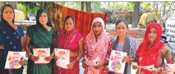
अमृतपुर में महिलाओं को जागरूक करती महिला पुलिस