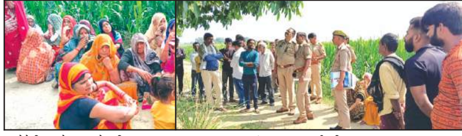
रोते बिलखते मृतक के परिजन