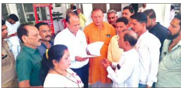
एडीएम को ज्ञापन सौंपते व्यापारी नेता

जिससे कन्नौज, गुरुसहायगंज, कमालगंज, फतेहगढ़, फर्रुखाबाद, कायमगंज व हरदोई मैनुपरी भोगांव आदि के व्यापारियों व आम जनता को काफी राहत है, जबकि कालिंदी एक्सप्रेस बराबर भरकर जाती और आती है। अब जानकारी प्राप्त हो रही है की कानपुर में रावतपुर एवं कल्याणपुर रेलवे स्टेशन पर लाइन को