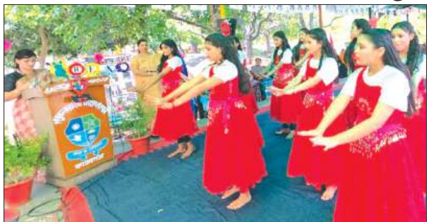
कार्यक्रम प्रस्तुत करते बच्चे