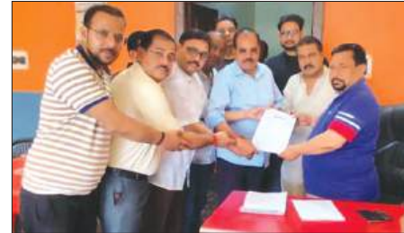
सांसद को ज्ञापन सौंपते एसो के पदाधिकारी

केमिस्ट एंड ड्रगिस्ट एसोसिएशन के प्रतिनिधिमंडल ने सांसद मुकेश राजपूत के आवास पर पहुंचकर स्वास्थ्य मंत्री संबोधित ज्ञापन सौंपा। जिसमें दवा की ऑनलाइन बिक्री बंद करने की मांग उठाई। इसके साथ ही आगामी 20 मई को होने वाले देशव्यापी बंद की अग्रिम सूचना दी। स्वास्थ्य मंत्री संबोधित दिये गये ज्ञापन में कहा कि दवाओं की ऑनलाइन बिक्री के चलते दुकानदारों को घाते का सामना करना पड़ रहा है, इसके अलावा अन्य और भी समस्याएं हैं। विभिन्न तरीके से दवा विक्रेताओं को परेशान किया जाता है, कभी किसी धारा को लेकर तो कभी किसी जीआरएस को लेकर, दवा विक्रेताओं का मानसिक उर्पीड़न किया जाता है, जो बंद होना चाहिए। ज्ञापन में अवगत कराया गया कि यदि मांगे नहीं मानी गईं तो आगामी 20 मई को संगठन