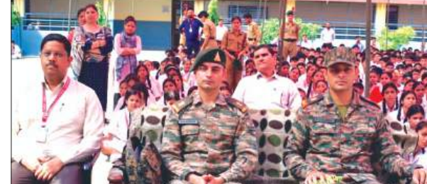
कार्यक्रम में मौजूद सैन्य अधिकारी व विद्यार्थी

आतंकवादियों को मार गिराया और उनके ठिकानों को तबाह कर दिया। उन्होंने पाकिस्तान के द्वारा किए गए डी, मुम्बई, नगरोटा, दिल्ली में संसद भवन पर किये गये नापाक आतंकवादी हमलों का उल्लेख करते हुए कहा कि जब जब पाकिस्तान के द्वारा भारत में सूख और शान्ति भंग करने का प्रयास किया गया तब-तब उसे अपने मुंह की खानी पड़ी है। कार्यक्रम के दौरान विद्यालय के