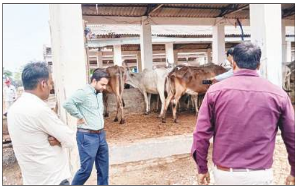
शाहजहांपुर, समृद्धि न्यूज।

सीडीओ के निरीक्षण में बीएसए समेत कई कुर्सियां खाली, स्पष्टीकरण मांगा