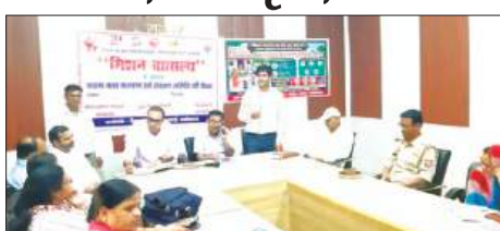
बैठक को संबोधित करते सहित सिंह