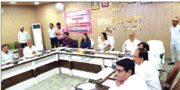
► जनसमस्याओं के त्वरित निस्तारण, बाढ़ तैयारियों की समीक्षा और निर्माण कार्यों की गुणवत्ता पर आयुक्त सख्त

देवीपाटन मंडल की आयुक्त दुर्गा शक्ति नागपाल ने श्रावस्ती जनपद के दौरे के दौरान जनसुनवाई, विभागीय समीक्षा, निर्माण कार्यों के निरीक्षण तथा संस्था संवाद कार्यक्रम में प्रतिभाग कर आमजन से सीधे संवाद किया। इस दौरान उन्होंने प्रशासनिक व्यवस्थाओं, जनकल्याणकारी योजनाओं तथा निर्माणधीन परियोजनाओं की प्रगति एवं गुणवत्ता का गहन निरीक्षण किया।