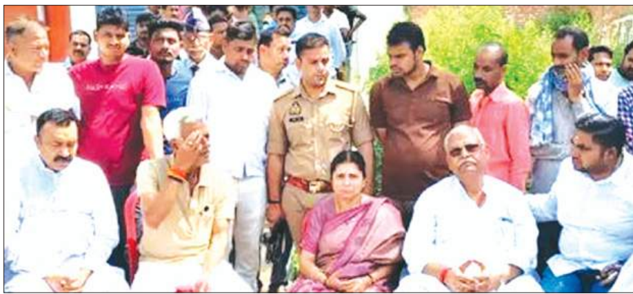
सड़कों को ढाँस बंधारी विधायिका अर्चना पांडेय व अन्य जनप्रतिनिधि, मृतक का फ़ाइल फ़ोटो

► तिलक समारोह से लौटते समय हरोदोई के मटियामऊ मोड़ पर अनियंत्रित होकर खाई में जा गिरी कार