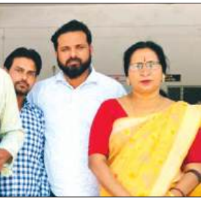
ज्ञापन देने के बाद जानकारी देते भाजपा नेता