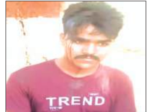
जानकारी देता पीड़ित

नवाबगंज, समृद्धि न्यूज़। बाइक की चॉबी देने से मना करने पर चचेरे भाइयों ने युवक को मारपीट कर घायल कर दिया। पीड़ित ने घटना के संबंध में पुलिस को तहरीर दी है।