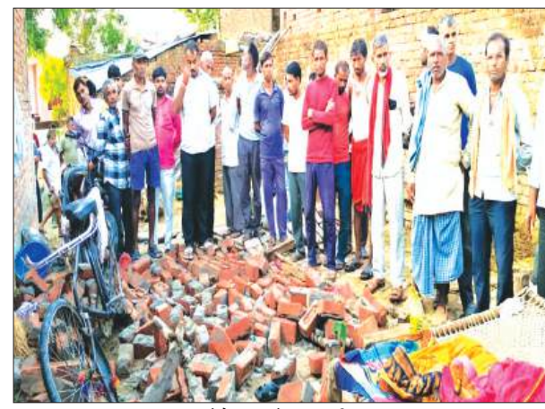
मौके पर मौजूद ग्रामीण