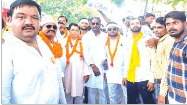
शोभायात्रा में मौजूद पदाधिकारी