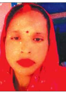
मृतका का फाइल फोटो

कायमगंज, समृद्धि न्यूज़। संदिग्ध परिस्थितियों में विवाहिता का शव फांसी के फंदे पर लटक मिल्ने से सनसनी फैल गई। मौके पर पहुंची पुलिस ने जांच पड़ताल कर मृतका के शव का पंचनामा भरवाकर पोस्टमार्टम के लिए भिजवाया।