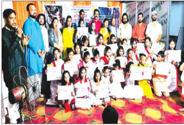
प्रमाण पर के साथ मौजूद बच्चे