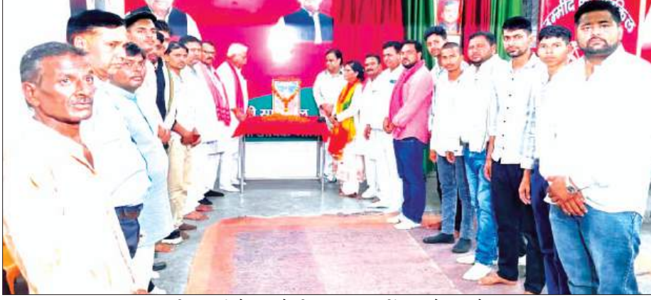
अहिल्याबाई होल्कर के चित्र पर पुष्प अर्पित करते सपा नेता

सपा नेताओं ने राज माता अहिल्याबाई होल्कर की मनाई जयंती