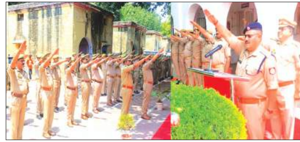
पुलिस कर्मियों को शपथ दिलाते सीओ लाइन

फर्रुखाबाद, समृद्धि न्यूज़। पुलिस अधीक्षक के निर्देशन में क्षेत्राधिकारी लाइन व प्रतिस्तर निरीक्षक द्वारा विश्व तम्बाकू निषेध दिवस पर रिजर्व पुलिस लाइन फतेहगढ़ में समस्त पुलिस अधिकारी/कर्मचारियों को तम्बाकू उत्पादों का उपयोग न करने की शपथ दिलाई गई। क्षेत्राधिकारी लाइन व सभी कर्मिकों को स्वस्थ जीवनशैली अपनाने तथा तम्बाकू मुक्त