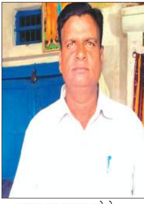
मृतक का फाइल फोटो

कायमगंज, समृद्धि न्यूज़। बेटी को बीएड का पेपर दिलाने जा रहे पूर्व की बाइक में रोडवेज बस ने टक्कर मार दी। जिससे पिता-पुत्री दोनों लोग गंभीर रूप से घायल हो गये। जिन्हे उपचार के लिए सीएचसी में भर्ती कराया गया। हालत बिगड़ने पर पूर्व प्रधान को लोहिया अस्पताल के लिए रेफर कर दिया गया। लोहिया पहुंचने पर चिकित्सक ने मृत घोषित कर दिया। मौत की सूचना पर परिजनों में कोहराम मच गया। सूचना पर पहुंची पुलिस ने जांच पड़ताल की और शव का पंचनामा भरकर पोस्टमार्टम के लिए भिजवाया।