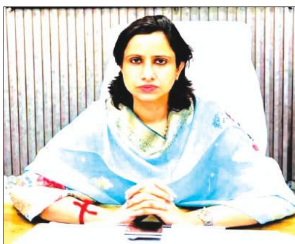
जानकारी देती जिलाधिकारी

तहसील कायमगंज क्षेत्र के ग्राम सिकंदरपुर तिहाई कापिल में 30 मई को हुई अग्निकांड की घटना में प्रभावित परिवारों को जिला प्रशासन द्वारा त्वरित राहत प्रदान करने की कार्यवाही की गई है। घटना की सूचना प्राप्त होते ही राजस्व विभाग की टीम मौके पर पहुंची तथा क्षति का स्थलीय निरीक्षण कर विस्तृत आकलन किया गया।