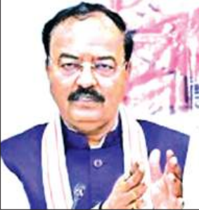
सरकार देश के सर्वांगीण विकास के लिए प्रतिबद्ध : उप मुख्यमंत्री

लखनऊ, समृद्धि न्यूज़। उत्तर प्रदेश के उप मुख्यमंत्री केशव प्रसाद मौर्य आज नई दिल्ली के मंगोलपुर स्थित सैनी भवन में अखिल भारतीय शक्य महासभा द्वारा बुद्ध जयंती एवं प्रतिभा सम्मान समारोह में मुख्य अतिथि के रूप में सम्मिलित हुए। इस भव्य समारोह में समाज की उल्लेख्य प्रतिभाओं को सम्मानित किया गया और भगवान बुद्ध के विचारों व सिद्धांतों पर विस्तार से चर्चा की गई। भारतीय शक्य महासभा के पदाधिकारियों ने मुख्य अतिथि उप मुख्यमंत्री केशव प्रसाद मौर्य को स्मृति चिह्न और शॉल भेंट कर उनका स्वागत व अभिनंदन किया। उप मुख्यमंत्री ने समाज की होनहार प्रतिभाओं को मेडल और प्रशस्ति पत्र