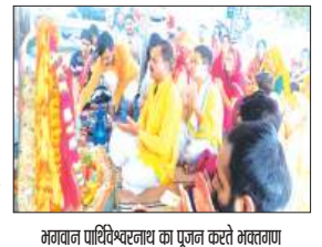
अनवार पाथिवेश्वरनाथ का पूजन करते भक्तगण

फर्रुखाबाद, समृद्धि न्यूज़। गंगा मड़या स्वच्छता एवं दीपदान आयोजन समिति द्वारा पाञ्चाल घाट, निकट दुर्वासा ऋषि आश्रम पर प्रति रविवार को आयोजित होने वाले भगवान पार्थिवेश्वरनाथ पूजन, गंगा पूजन और गंगा दीपदान कार्यक्रम का 630वां आयोजन पुरुषोत्तम मास की पूर्णिमा पर संपन्न हुआ। समिति के अध्यक्षता भगवान पार्थिवेश्वरनाथ और अधिष्ठात्री भगवती