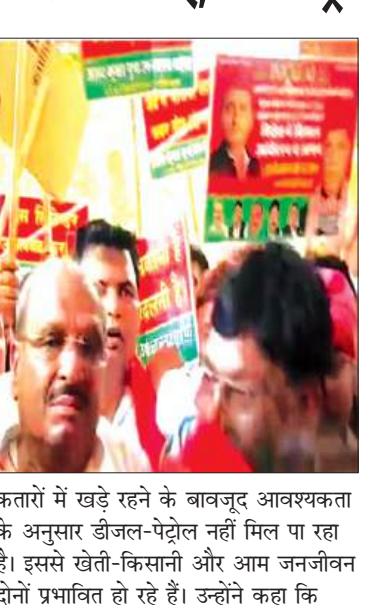
कतारों में खड़े रहने के बावजूद आवश्यकता के अनुसार डीजल-पेट्रोल नहीं मिल पा रहा है। इससे खेती-किसानी और आम जनजीवन दोनों प्रभावित हो रहे हैं। उन्होंने कहा कि

वर्तमान सरकार महंगाई, बेरोजगारी और कानून व्यवस्था के मुद्दों पर पूरी तरह विफल साबित हुई है। प्रदेश में अपराध की घटनाएं लगातार बढ़ रही हैं तथा महिलाओं, छात्रों और कमजोर वर्गों के खिलाफ अत्याचार के मामलों में वृद्धि हुई है। किसानों को अपनी उपज का उचित मूल्य नहीं मिल रहा है, जबकि बिचौलिए, डीलर, पेट्रोल और गैस की कालाबाजारी कर अधिक कीमतों पर बेच रहे हैं। सपा जिलाध्यक्ष ने प्रतियोगी परीक्षाओं में लगातार सामने आ रहे पेपर लीक मामलों को भी गंभीर मुद्दा बताते हुए कहा कि इससे युवाओं के भविष्य के साथ खिलवाड़ हो रहा है। उन्होंने आरोप लगाया कि भर्ती प्रक्रियाओं में पिछड़े, दलित और अल्पसंख्यक वर्गों के आरक्षण अधिकारों को अनदेखी की जा रही है, जिससे इन वर्गों के युवाओं को सरकारी नौकरियों से वंचित होना पड़ रहा है।