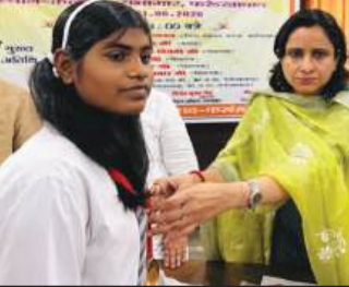
मेधावी छात्रों को सम्मानित करती डीएम मौजूद जनप्रतिनिधि