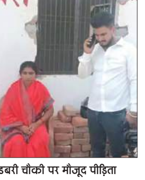
इबरी चौकी पर मौजूद पीड़िता

पुत्र के साथ बाइक से रिश्तेदारी में जा रही महिला से इटावा-बरेली हाइवे पर दिन दहाड़े बाइक सवार बदमाशों ने तमंचे की नोक पर सोने की चैन लूट ली। घटना की सूचना पुलिस को दी गई। सूचना मिलने पर स्थानीय पुलिस ने पहुंचकर जांच पड़ताल की। वहीं सूचना पर अपर पुलिस अधीक्षक ने भी पहुंचकर जांच पड़ताल की। पुलिस आसपास क्षेत्र में लगे