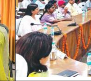
मुख्यमंत्री को सुनते अधिकारी व जनप्रतिनिधि