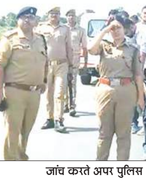
जांच करते अपर पुलिस अधीक्षक व सीओ