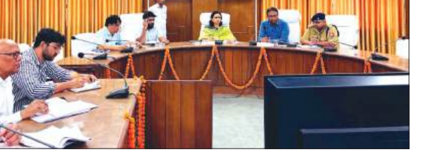
बैठक लेती डीएम मौजूद अधिकारियों

दौरान गौशाला कडियोली एवं मोधा में भूमि ऊसर होने के कारण लगाए गए पौधों के सूखने की जानकारी मिलने पर जिलाधिकारी ने प्रभागीय वनाधिकारी को भूमि उपचार एवं पौधों की बेहतर वृद्धि हेतु आवश्यक तकनीकी एवं सुधारात्मक कार्यवाही करने के निर्देश दिए। बैठक में यह भी पाया गया कि गैर सरकारी संस्था एनजीओ द्वारा संचालित गौ आश्रय स्थल सितवनपुर पिथू एवं सुल्तानपुर पलनापुर का संचालन संतोषजनक नहीं है। इस पर गंभीर नाराजगी व्यक्त करते हुए जिलाधिकारी ने तत्काल प्रभाव से इन गौ आश्रय स्थलों का संचालन संबंधित ग्राम पंचायतों को हस्तांतरित करने के निर्देश दिए, जिससे व्यवस्थाओं में सुधार लाया जा सके।