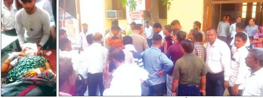
अस्पताल में भर्ती महिला

घर में सिलाई करते समय शराबी देवर ने भाभी पर टकोरे से हमला कर गम्भीर रूप से घायल कर दिया। घायल अवस्था में महिला को समुदायिक स्वास्थ्य केन्द्र में लाकर भर्ती कराया। जहाँ से प्राथमिक उपचार के बाद हालत गम्भीर होने पर लोहिया अस्पताल के लिए रेफर कर दिया गया। सूचना पर पहुंची पुलिस ने जांच पड़ताल की।