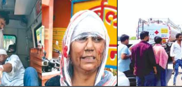
मौके पर खड़ा डीसीएम