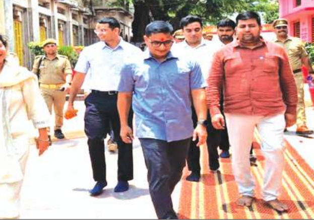
बैरिकेडिंग, पार्किंग तथा अन्य आवश्यक व्यवस्थाओं की भी समीक्षा की गई। अधिकारियों को निर्देशित किया गया कि कार्यक्रम स्थल पर आने वाले लोगों की सुविधाओं का विशेष ध्यान रखा जाए तथा सभी तैयारियों निर्धारित समय सीमा के