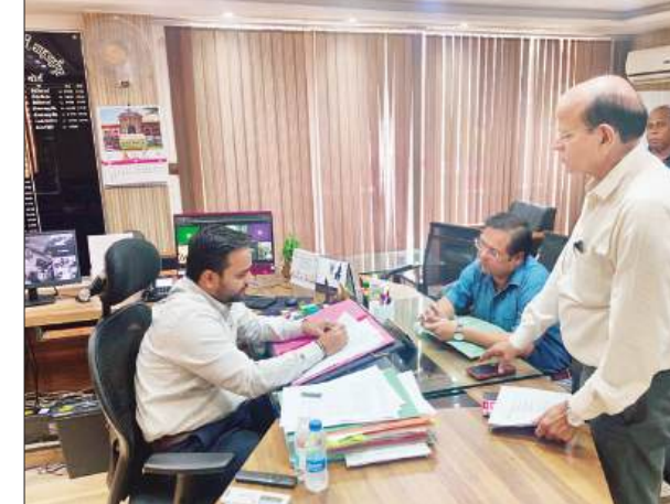
भागीदारी व जिम्मेदारी सुनिश्चित हो, कि वो एक पेड़-पौधा रोपित कर पर्यावरण संरक्षण का संदेश दे। विश्व पर्यावरण दिवस पर धरा को

विश्व पर्यावरण दिवस मनाने को जनपद तैयार है, सरकार भी प्रतिबद्ध है कि ज्यादा से ज्यादा वृक्षारोपण हो। जिले में विभागवार लक्ष्य का आवंटन पौधारोपण के लिए किया गया है। मरे द्वारा बैठक कर अधीनस्थों को दिशा निर्देश दिए गए हैं। साथ ही जनपदवासियों से भी अपील है कि ज्यादा संख्या में पौधारोपण कर पर्यावरण संरक्षण का संदेश दे।