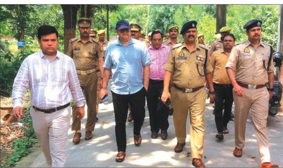
परीक्षा केन्द्र राजकीय पॉलिटेक्निक आसाम चौराहा भिनागा रोड का