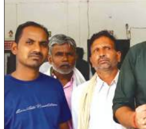
शिकायत करने के बाद जानकारी देते गाामीण