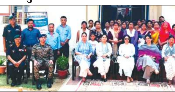
शिविर में मौजूद हेल्थ अधिकारी आदि

महिलाओं के स्वास्थ्य संरक्षण एवं सर्वाङ्कल कैंसर की शीघ्र पहचान को प्रोत्साहित करने के उद्देश्य से राजपूत रेजिमेंटल सेंटर फतेहाबाद में आर्मी वाइस वेलफेयर एसोसिएशन के तत्वावधान में पाप स्मीयर जांच शिविर का आयोजन किया गया। यह अभियान सर्वाङ्कल कैंसर जागरूकता एवं स्क्रीनिंग कार्यक्रम के अंतर्गत आयोजित किया गया। जिसका उद्देश्य महिलाओं को नियमित स्वास्थ्य जांच के प्रति जागरूक करना तथा रोग की प्रारंभिक अवस्था में पहचान सुनिश्चित करना था। शिविर के दौरान महिलाओं को सर्वाङ्कल कैंसर के लक्षणों, बचाव के उपायों एवं समय-समय पर स्वास्थ्य परीक्षण के महत्व के बारे में विस्तृत