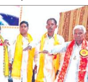
पर्यावरण संरक्षण की शायद लेते बीके बहनें व अन्य