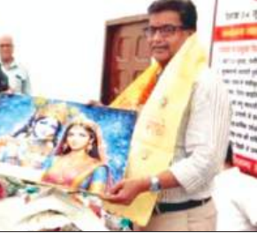
आयकर कमिश्नर का स्वागत करते व्यापारी