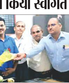
डीआईओएस का स्वागत करते परिचारी