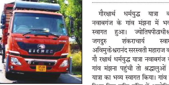
मौके पर खड़ा डीसीएम