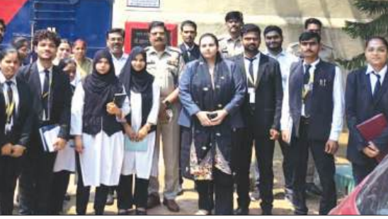
निरीक्षण के दौरान मौजूद एलाएलबी के छात्र-छात्राये