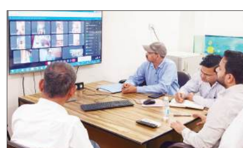
व एमओआईसी को आपसी समन्वय स्थापित कर अपने-अपने क्षेत्रों में संचारी रोग नियंत्रण संबंधी गतिविधियों की नियमित