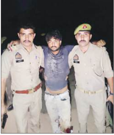
मोटरसाइकिल बरामद की है। पुलिस अधीक्षक के निर्देशन में अपराधियों की गिरफ्तारी के लिए

सदर बाजार थाना पुलिस, एसओजी और सर्विलांस टीम की संयुक्त कार्रवाई में कैंट क्षेत्र में महिला से सोने की चेन और मंगलसूत्र लूटने की घटना का सफल खुलासा करते हुए दो शांति बदमाशों को पुलिस मुठभेड़ के बाद गिरफ्तार कर लिया गया। मुठभेड़ के दौरान दोनों बदमाशों के पैरों में गोली लगी, जिसके बाद उन्हें हिरासत में लेकर उपचार के लिए अस्पताल भेजा गया। पुलिस ने उनके कब्जे से अवैध तमचे, कारतूस, नकदी, मोबाइल फोन और घटना में प्रयुक्त