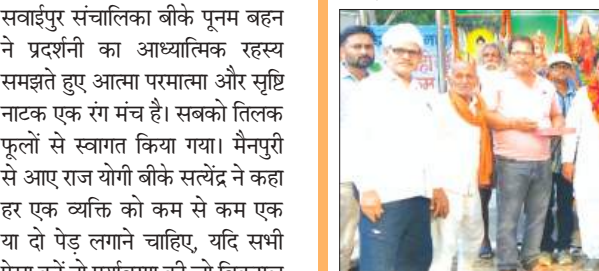
लोकार्पण के दौरान मौजूद सदर विधायक