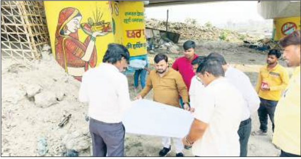
संयुक्त स्थल निरीक्षण किया। निर्माण कार्य की रूपरेखा, सुरक्षा व्यवस्थाओं तथा विकास कार्यों की प्रगति का जायजा लिया। नगर निगम द्वारा क्षेत्र के समग्र विकास एवं नागरिकों को बेहतर सार्वजनिक सुविधाएं उपलब्ध कराने के उद्देश्य से खन्नौत नदी तट पर भव्य एवं आधुनिक घाट के निर्माण कार्य

खन्नौत नदी लोदीपुर के घाटों का होगा काराकल्प, बदलेगी तस्वीर-तकदीर