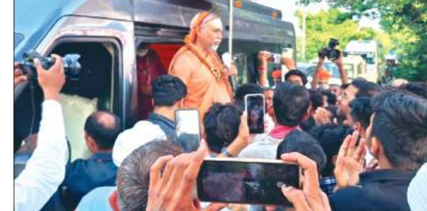
शंकराचार्य का स्वागत करते लोग

कमालगंज कोतवाली क्षेत्र में कन्नौज जनपद में स्थित रिश्तेदारी में अंतिम संस्कार में शामिल होकर लौट रहा एक ही परिवार से भरा टेंपो में गुरुवार दोपहर करीब डेढ़ बजे भरपुरा मोड़ के निकट फतेहगढ़ की ओर से जा रही डीसीएम ने जोरदार टक्कर मार दी। इससे बेकाबू हुआ टेंपो सड़क पर पलट गया।