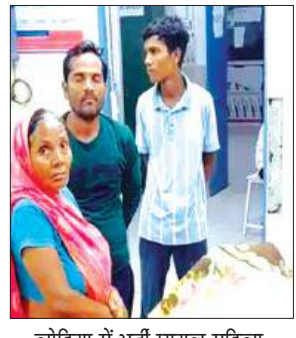
लोहिया में भर्ती घायल महिला

शनिवार सुबह आधी तेज आंधी बारिश के कारण एक मकान की दीवार गिरने से बर्तन धो रही एक महिला गंभीर रूप से घायल हो गई। परिजनों ने उसे उपचार के लिए सीएचसी में भर्ती कराया। हालत बिगड़ने पर चिकित्सक ने लोहिया अस्पताल के लिए रेफर कर दिया।