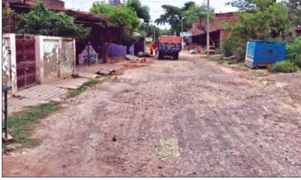
बछरावां रायबरेली, समृद्धि न्यूज़।

रामपुर सुदौली से समोधा को मिलने वाली सड़क बढ़ाहली का शिकार हो चुकी है। जबकि जनपद के जन प्रतिनिधि भव्नेश्वर मंदिर में आया जाया करते हैं। समोधा से मौरावा जाने के लिए राहगीर सुगम रास्ता को खोजते हुए संपर्क मार्ग से गुजरते हैं, लेकिन वर्तमान समय में सड़क बड़े बड़े गड्ढों