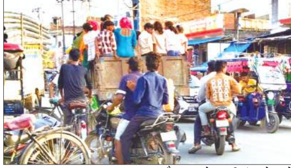
जाम में फंसे वाहन

कस्बा नवाबगंज में अतिक्रमण, ई-रिक्शा और डग्गामार वाहनों की मनमानी के चलते आए दिन जाम की समस्या गंभीर होती जा रही है। मुख्य चौराहे और बाजार क्षेत्र में दिनभर वाहनों की लंबी कतारें लगने से राहगीरों, व्यापारियों, दुकानदारों को भारी परेशानी का सामना करना पड़ रहा है। स्थानीय लोगों का आरोप है कि ई-रिक्शा और डग्गामार वाहन चालक सवारियों बैटने के लिए आपस में प्रतिस्पर्धा करते हैं। इस दौरान कई बार उनके बीच गाली-गलौज और धक्का-मुक्की तक की नौबत