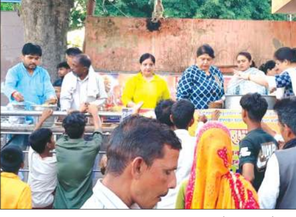
भण्डारे में प्रसाद लेते भक्तगण