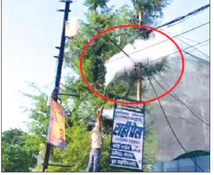
आग बुझाता युवक

फर्रुखाबाद, समृद्धि न्यूज़। फतेहगढ़ कोतवाली क्षेत्र स्थित लाइफ लाइन अस्पताल के बाहर लगे बिजली के खंभे पर लगे विद्युत बॉक्स में अचानक शॉर्ट सर्किट से आग लग गई। देखते ही देखते आग ने विकराल रूप धारण कर लिया, जिससे आसपास के लोगों में हड़कंप मच गया। सूत्रों के अनुसार