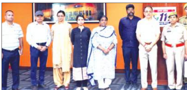
अमेठी, समृद्धि न्यूज़।

जगदीशपुर अंतर्गत ग्राम सेरेसर में विवाद होने की सूचना प्राप्त हुई। सूचना पर पीआरवी की टीम तत्काल मौके पर पहुंची और पाया कि एक व्यक्ति का परिचय देते हुए फांसी पर लटकते हुए एक व्यक्ति की जान बचाई है। जगदीशपुर पर पीआरवी 5344 पर तैनात पुलिसकर्मियों की सतर्कता के कारण एक बड़ा हादसा होने से टल गया। शुक्रवार को यूपी-112 को थाना