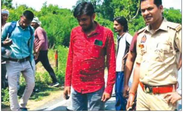
घटना स्थल पर मौजूद पुलिस

लोहिया में मौजूद परिजन कमालगंज क्षेत्र की बहार चौकी के निकट सामने से आ रही एक कार ने उनकी बाइक में टक्कर मार दी। जिससे बाइक सवार दोनों लोग घायल हो गये। सूचना पर पहुंची पुलिस और स्थानीय