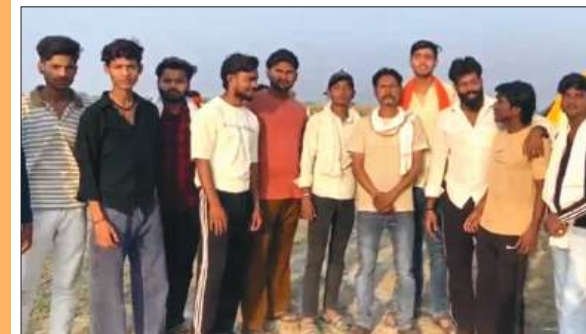
पांचाल घाट पर मौजूद हिन्दू रक्षा दल के एटाधिकारी