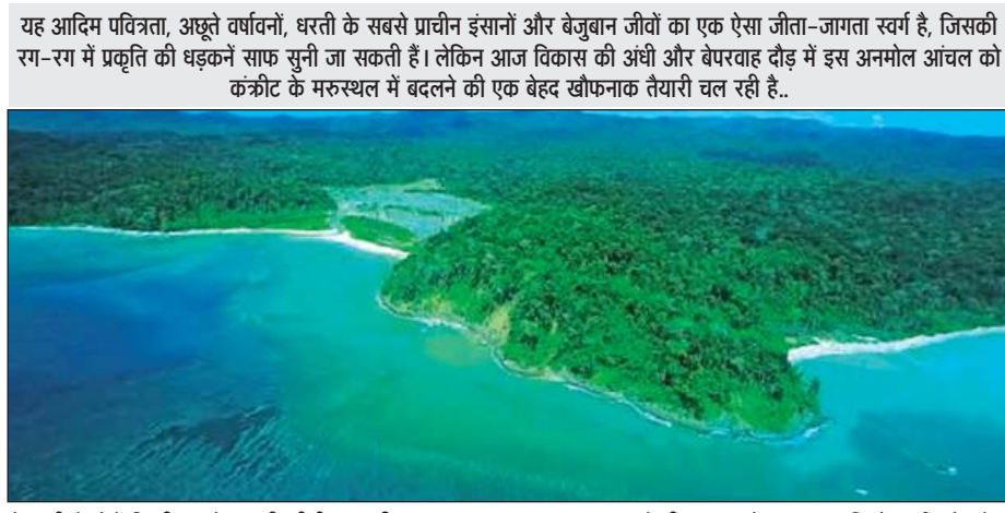
यह आदिम पवित्रता, अछूते वर्षावनों, धरती के सबसे प्राचीन इंसानों और बेजुबान जीवों का एक ऐसा जीता-जागता स्वर्ग है, जिसकी रंग-रंग में प्रकृति की धड़कनें साफ सुनी जा सकती हैं। लेकिन आज विकास की अंधी और बेपरवाह दौड़ में इस अनमोल आंचल को कंक्रीट के मरुस्थल में बदलने की एक बेहद खोफनाक तैयारी चल रही है..