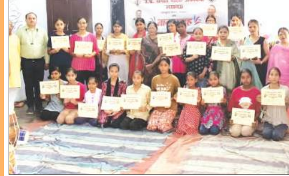
प्रमाण पत्र के साथ बच्चे