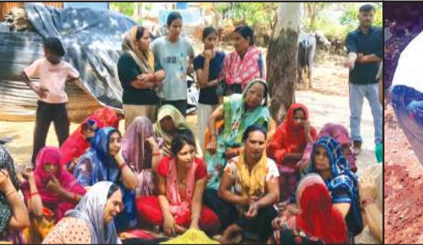
घटे बिलखते मृतक के परिजन