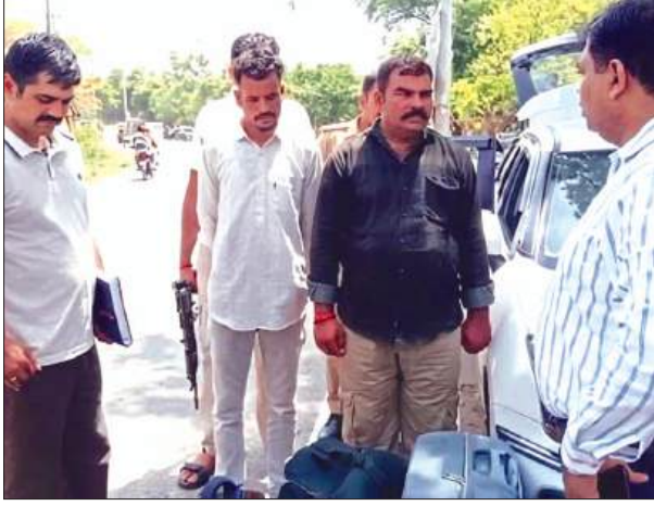
आरोपियों से पूछताछ करती टीम

मेरठ की एटी नारकोटिक्स टास्क फोर्स ने मुखबिर की सूचना पर कायमगंज बाईपास मार्ग स्थित बेरिया तिराहे से दो अंतर्राज्यीय मादक तस्करो को रोग हाथों दबोच लिया। आरोपियों के पास से एक सूटकेस और दो बैग में भरा 42.5 किलो अवैध गांजा बरामद हुआ है, जिसकी कीमत नारकोटिक्स कंट्रोल ब्यूरो के अनुसार लगभग 21 लाख रुपये है। टीम को इनपुट मिला था कि भारी मात्रा में गांजा लेकर दो तस्कर कायमगंज पहुंचने वाले हैं। टीम ने कायमगंज बेरिया तिराहे पर जाल बिछाया। जैसे