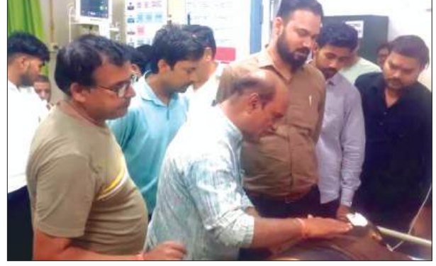
लोहिया में मौजूद परिजन