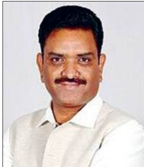
▶ हर पेड़ का तैयार होगा डिजिटल डाटा बैंक ▶ पेड़ों को मिलेगा संस्थान की संपत्ति का दर्जा