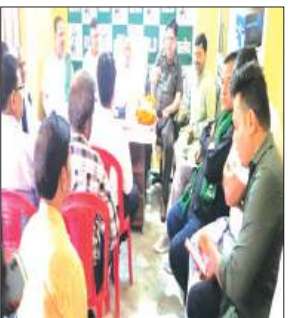
बैठक में मौजूद पदाधिकारी