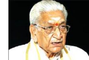
▶ अयोध्या में होगी विधि केन्द्रीय प्रबन्ध समिति की बैठक