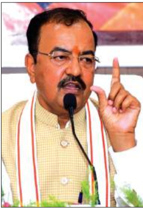
विकास, वित्तीय सहायता, आधुनिक कृषि तकनीक, आजीविका संवर्धन तथा बाजार से जोड़ने जैसी सुविधाएं उपलब्ध कराई जाएगी। वित्तीय वर्ष 2026-27 के लिए

ग्रामीण विकास मंत्रालय, भारत सरकार की दीनदयाल अंत्योदय योजना-राष्ट्रीय ग्रामीण आजीविका मिशन (DAY-NRLM) के अंतर्गत संचालित महिला किसान सशक्तिकरण परियोजना का उद्देश्य कृषि क्षेत्र में महिलाओं की महत्वपूर्ण भूमिका को पहचानते हुए उन्हें सशक्त बनाना है। इस परियोजना के अंतर्गत वित्तीय वर्ष 2026-27 के लिए 4 करोड़ 95 लाख 83 हजार रुपये से अधिक की धनराशि की वित्तीय स्वीकृति प्रदान की है।