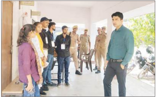
सुबह 9:30 बजे से 11:30 बजे तक एक ही सत्र में आयोजित की गई। जिला प्रशासन और शिक्षा विभाग,

▶ एडीएम प्रशासन-एसपी ग्रामीण ने परीक्षा केंद्रों पर परतवी सुरक्षा व्यवस्थाएं शाहजहांपुर, समृद्धि न्यूज।