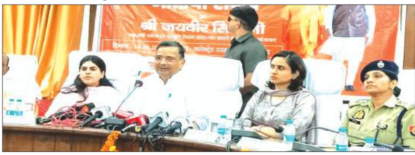
वार्ता के दौरान प्रभारी मंत्री, अधिकारी व जनप्रतिनिधि

सरकार के 12 साल पूर्ण होने पर जन जागरूकता अभियान के तहत प्रभारी मंत्री ने केंद्र व प्रदेश सरकार की उपलब्धियों गिनाते हुए कहा कि सबका साथ सबका विकास और सरकार के 12 साल बेमिसाल साबित हुए हैं। उत्तर प्रदेश सरकार के पर्यटन एवं संस्कृति विभाग के मंत्री तथा जनपद के प्रभारी मंत्री जयवीर सिंह एक दिवसीय दौरे पर आये थे। जिन्होंने कई कार्यक्रमों में भाग लेने के बाद कलेक्ट्रेट सभागार में वार्ता के दौरान केंद्र सरकार के 12 वर्ष पूर्ण होने के अवसर पर प्रधानमंत्री नरेन्द्र मोदी को बधाई देते हुए कहा कि इस अवसर पर जन जागरूकता अभियान के तहत सरकार द्वारा कराये गये कार्यों का रिपोर्ट कार्ड पेश किया। उन्होंने बताया कि मोदी सरकार के 12 वर्ष की विकास, विश्वास और जन कल्याण। मोदी सरकार ने सबका साथ, सबका विकास, साथ