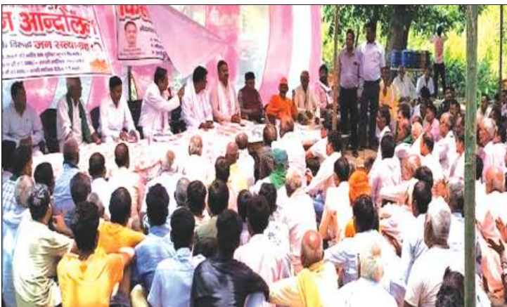
सम्मेलन में मौजूद किसान