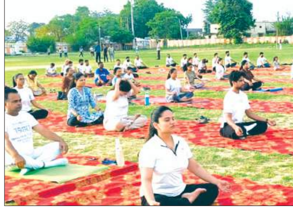
योगाभ्यास में गान लेते लोग

प्रोटोकॉल के अनुसार योगाभ्यास कराया गया। योग सत्र में विभिन्न आसन,