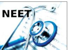
आश्वासन दिया कि जल्द ही सभी उम्मीदवार अपने प्रवेश पत्र डाउनलोड कर सकेंगे। एनटीई ने अभ्यर्थियों को एडमिट कार्ड डाउनलोड करने में सहायता के लिए 24x7 हेल्पलाइन शुरू की है।

देश के प्रसिद्ध उद्योगपति मुकेश अंबानी ने सोमवार को उत्तराखंड स्थित भगवान बदरीविशाल और बाबा केदारनाथ के दर्शन कर देश की सुख-समृद्धि एवं खुशहाली की कामना की। इस दौरान उन्होंने बदरीनाथ-केदारनाथ मंदिर समिति (बीकेटीसी) को 10 करोड़ रुपये का दान भी दिया। बीकेटीसी के अनुसार अंबानी ने सबसे पहले बदरीनाथ धाम पहुंचकर भगवान बदरीविशाल के दर्शन और पूजा-अर्चना की। इसके बाद उन्होंने केदारनाथ धाम में बाबा केदारनाथ के दर्शन किए। दोनों धामों में मंदिर समिति के पदाधिकारियों ने उनका स्वागत कर प्रसाद भेंट किया। इस दौरान अंबानी