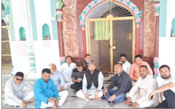
बैठक में गौगुरु शिया समाज के लोग

► शहर में साफ-सफाई की व्यवस्था बनाये रखने की मांग