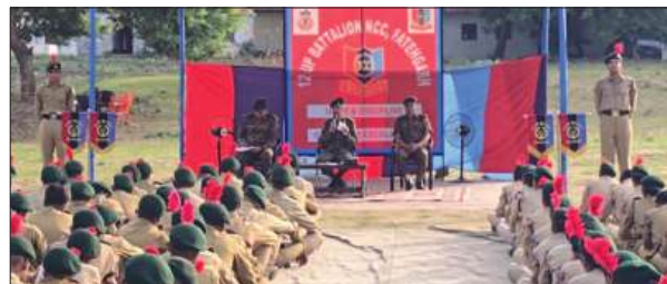
शिविर में गौगुरु अधिकारी व एनसीसी कैडेट्स