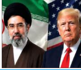
समझौते से पश्चिम एशिया में शांति-स्थिरता की उम्मीद : मोदी

अमेरिका और ईरान पश्चिम एशिया में शांति बहाल करने के मुद्दे पर राजी हो गये हैं। दोनों देशों के बीच रविवार को जंग खत्म करने के लिए शांति समझौते पर सहमति बन गयी और अब आधिकारिक हस्ताक्षर समारोह शुक्रवार 19 जून को स्विट्जरलैंड में होगा।