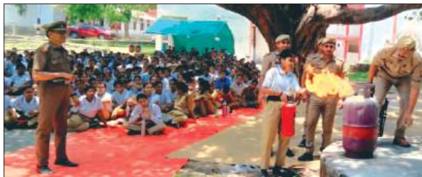
आग बुझाने का प्रशिक्षण देते फायर कर्मी