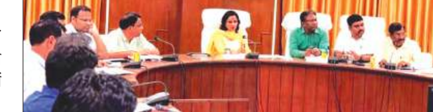
बैठक लेती डीएम

जिलाधिकारी डॉ. अंकुर लाठर की अध्यक्षता में जिला पेयजल एवं स्वच्छता समिति की बैठक सम्पन्न, जल जीवन मिशन की योजनाओं की प्रगति की समीक्षा की।