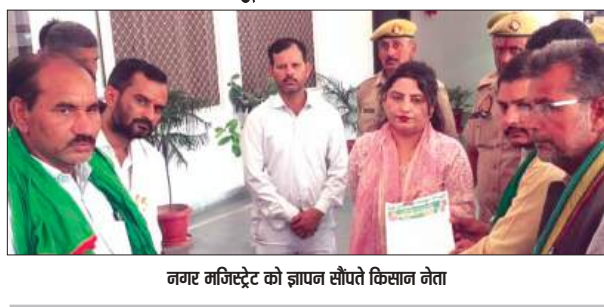
नगर मजिस्ट्रेट को ज्ञापन सौंपते किसान नेता

भारतीय किसान यूनियन अखंड ने उपजिलाधिकारी कायमगंज की तानाशाही, मनमानी निरंतर किसानों के साथ किया गया जा रहे अभद्र व्यवहार, अवैध वसूली, गौशाला में निरंतर हो रही गो हत्याओं को लेकर मुख्यमंत्री संबोधित ज्ञापन नगर मजिस्ट्रेट को सौंपा। भक्तियू अखंड प्रदेश के पदाधिकारियों ने कायमगंज गौशाला में गोवंशों की सदियह मौतों की निष्पक्ष जांच करने की मांग की है। संगठन ने आरोप लगाया कि गौशाला प्रकरण को उजागर करने वाले किसानों और गोशुक्कों पर झूठे मुकदमे दर्ज किए गए तथा उनके साथ अभद्र