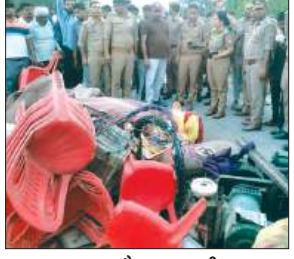
पलटा पड़ा ट्रैक्टर ट्राली मौजूद सीओ व पुलिस बल