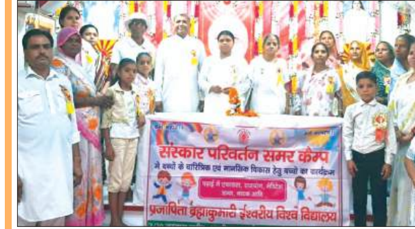
परिवर्तन समर केम्प में मौजूद लोग