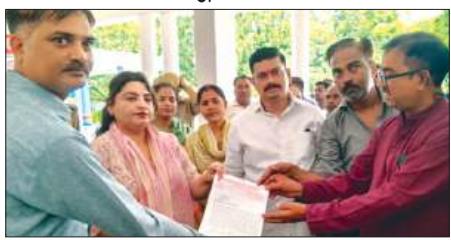
नगर मजिस्ट्रेट को ज्ञापन सौंपते कर्मचारी संघ के लोग