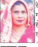
मृतका का फोटो