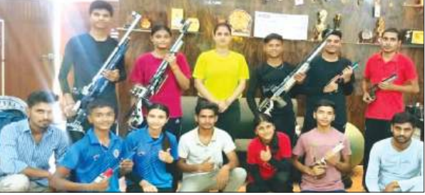
फर्रुखाबाद, समृद्धि न्यूज।