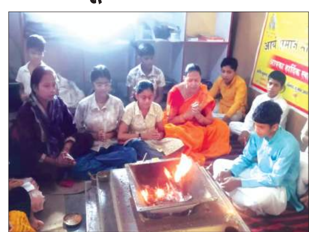
हवन में गण लेते बच्चे