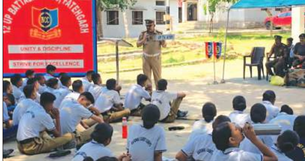
कैडेट्सों को नियमों की जानकारी देते टीएसआई