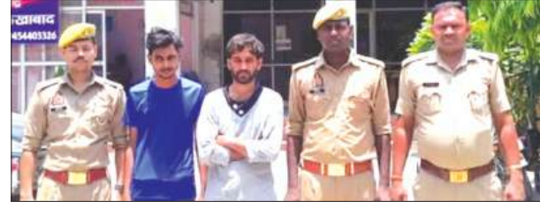
पुलिस हिरासत में आरोपीगण