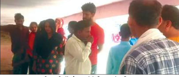
सीएचसी में मौजूद राते बिलखते परिजन

जनपद कासगंज के थाना सिकन्दरपुर वैश्य क्षेत्र के ग्राम राजा रिशोर निवासी एक महिला की बाइक से गिरकर दर्दनाक मौत हो गई। महिला अपने बेटे का अल्ट्रासाउंड कराने कायमगंज आ रही थी। सूचना पर पहुंची पुलिस ने जांच पड़ताल की और शव का पंचनामा भरकर पोस्टमार्टम के लिए भिजवाया।