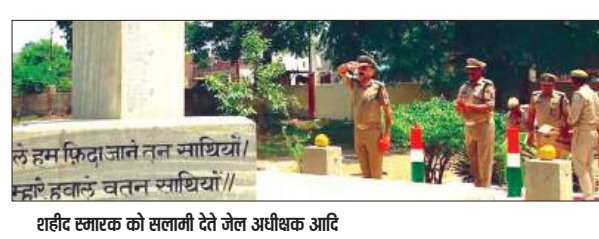
शहीद स्मारक को सलामी देते जेल अधीक्षक आदि

केन्द्रीय कारागार फतेहगढ़ पर अमर शहीद मणीन्द्र नाथ बनर्जी की 93वीं पुण्यतिथि की पूर्व संस्था पर कारागार परिसर में स्थित मणीन्द्र नाथ बनर्जी स्मारक स्थल को रंग बिरंगी झालरों से सजाया गया। 20 जून शनिवार को अमर शहीद मणीन्द्र नाथ बनर्जी की पुण्यतिथि मनावे जांन का शुभारम्भ स्मारक स्थल पर मणीन्द्र नाथ बनर्जी की प्रतिमा का माल्यार्पण एवं शहीद उपवन में स्थित कीर्ति स्तम्भ पर पुष्पांजलि अर्पित करने के साथ किया गया। अमर शहीद मणीन्द्र नाथ बनर्जी की प्रतिमा पर माल्यार्पण के उपरान्त कारागार वैण्ड की धुन पर जेल गार्ड द्वारा सलामी दी गई। वरिष्ठ जेल