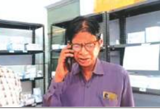
मरीजों के ऊपर दवाई लेने का दबाव बना रहा है। जिस कारण क्षेत्रीय लोगों में रोष व्याप्त है। गौरतलब है कि शासन के निर्देश पर जन औषधि केंद्र में सिर्फ जन औषधि की दवाइयों को रखा जाने का प्रावधान है। लेकिन सीएचसी में तैनात एक डॉक्टर की

समृद्धि न्यूज, उरई (जालौन)। कदीरा कस्बे में स्थित सामुदायिक स्वास्थ्य केंद्र (सीएचसी) एक बार भी चर्चा में है। सीएचसी परिसर में मौजूद जन औषधि केंद्र में इस समय तीमारदारों की जेबें हल्की हो रही है। सीएचसी में तैनात एक डॉक्टर जन औषधि केंद्र में अस्पताल की सरकारी दवाइयों को रखवा कर बिकवा रहा है। आने वाले