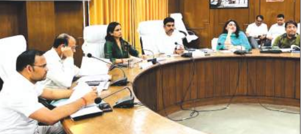
बैठक लेती डीएम मौजूद अधिकारीगण

फर्रुख़ाबाद, समृद्धि न्यूज़। ने गहरी नाराजगी व्यक्त करते हुए विभागीय अधिकारियों को प्रवर्तन कार्यों में तेजी लाने तथा लक्ष्य के अनुरूप वसूली सुनिश्चित करने के निर्देश दिए। वहीं आबकारी विभाग की वसूली संतोषजनक पाई गई। बैठक में मंडी मोहम्मदाबाद एवं मंडी कायमगंज की मासिक राजस्व वसूली अपेक्षाकृत कम पाए जाने पर भी चिंता व्यक्त की गई। समीक्षा के दौरान पाया गया कि वाणिज्य कर विभाग की राजस्व वसूली निर्धारित लक्ष्य की तुलना में अत्यंत कम है, जिस पर जिलाधिकारी