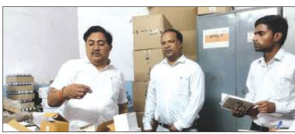
पीएचसी का निरीक्षण करते सीएमओ

मुख्य चिकित्सा अधिकारी ने शनिवार को प्राथमिक स्वास्थ्य केंद्र अमृतपुर का औचक निरीक्षण कर स्वास्थ्य सेवाओं, दवा उपलब्धता, जांच व्यवस्थाओं एवं अस्पताल की कार्यप्रणाली का जायजा लिया। निरीक्षण के दौरान सीएमओ ने उपलब्ध दवाएँ, दवा वितरण केंद्र, पैथोलॉजी कक्ष एवं अस्पताल परिसर का निरीक्षण किया। उन्होंने अस्पताल में उपचार के लिए आए मरीजों से बातचीत कर स्वास्थ्य सेवाओं की जानकारी ली। मरीजों ने अस्पताल में