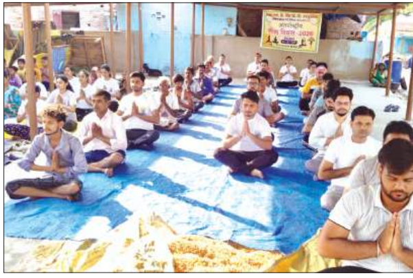
योगाभ्यास में गण लेते छात्र-छात्राएँ

मेजर एसडी सिंह पीजी आयुर्वेद मेडिकल कॉलेज एवं चिकित्सालय द्वारा चल रहा है कार्यक्रम फर्रुखाबाद, समृद्धि न्यूज।