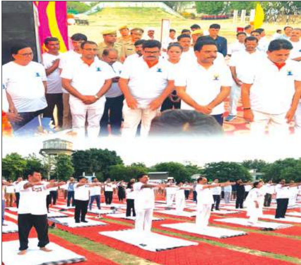
स्वस्थ रहता है और मानसिक तनाव से भी राहत मिलती है।