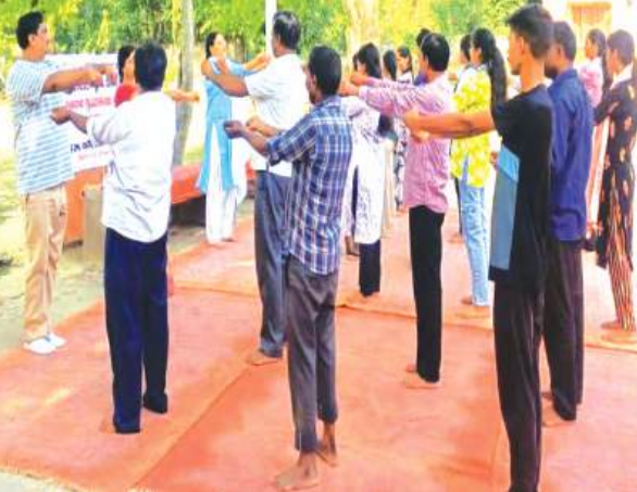
समृद्धि न्यूज़, छिबरामऊ, कन्नौज।

अंतर्राष्ट्रीय योग दिवस पर नेहरू कॉलेज में राष्ट्रीय सेवा योजना (एनएसएस) इकाई के तत्वावधान में