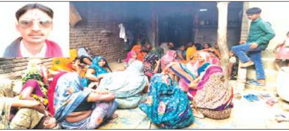
नशे में आरोपी ने कबूला जुर्म, दो हिरासत में

कायमगंज, समृद्धि न्यूज़। कोतवाली क्षेत्र के क्लिसरी गांव में शनिवार रात सनसनीखेज वारदात सामने आई। एक युवक की ईंट से वार कर हत्या करने के बाद शव को आम के पेड़ से लटका दिया गया। आरोपी ने नशे की हालत में खुद हत्या की बात कबूली, जिसके बाद पुलिस ने दो संदिग्धों को हिरासत में लिया है। पुलिस ने शव का पंचनामा भरकर पोस्टमार्टम