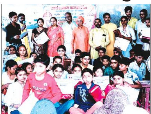
प्रशांति पत्र के साथ मौजूद बच्चे