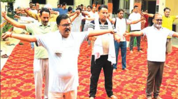
समृद्धि न्यूज़, गुरसहायगंज, कन्नौज।

विश्व योग दिवस के अवसर पर नगर पालिका द्वारा नगर में सामूहिक योगाभ्यास कार्यक्रम का भव्य आयोजन किया गया। योगाभ्यास नगर पालिका कार्यालय परिसर, सरस्वती शिशु मंदिर, अंबेडकर पार्क एवं