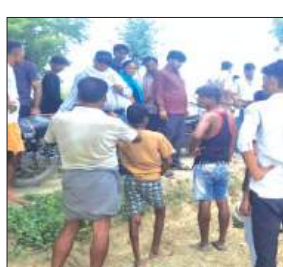
पलटा पड़ा ट्रैक्टर मौजूद लोग

नवाबगंज, समृद्धि न्यूज़। अचरा मार्ग पर थाना क्षेत्र के ग्राम ल्यौरी और फतनपुर के बीच रविवार दोपहर दवा लेने जा रहे बाइक सवार युवक को एक ट्रैक्टर चालक ने ओवरटेक करने के दौरान टक्कर मार दी। हादसे में युवक की मौके पर ही दर्दनाक मौत हो गई। वारदात के बाद भागने के प्रयास में अनियंत्रित होकर ट्रैक्टर-ट्रॉली भी रास्ते में पलट गई, जिसके बाद चालक वाहन छोड़कर फरार हो गया।