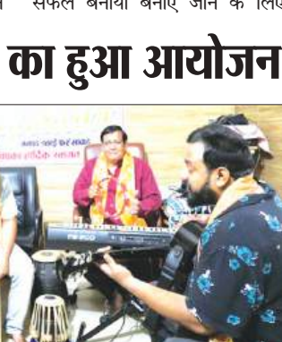
संगीत प्रस्तुत करते कलाकार