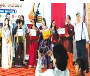
फिल्म अभिनेत्री के साथ कार्यशाला की शिक्षिकाएँ