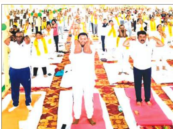
अधिकारी, कर्मचारी, सामाजिक संस्थाओं के प्रतिनिधि एवं आमजन