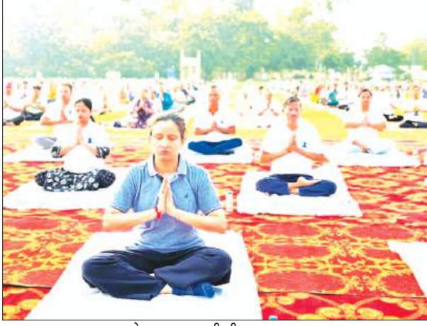
योगाभ्यास करती डीएम व अन्य