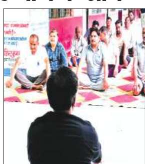
योग करते लोग

अमृतपुर, समृद्धि न्यूज़। अंतरराष्ट्रीय योग दिवस पर अमृतपुर तहसील परिसर में सामूहिक योगाभ्यास किया गया। उप जिलाधिकारी अमृतपुर रविंद्र सिंह के नेतृत्व में अधिकारियों, कर्मचारियों एवं क्षेत्रीय लोगों ने उत्साहपूर्वक भाग लिया और विभिन्न योगासन व प्राणायाम का अभ्यास किया। उपस्थित लोगों ने ताडसन, वृक्षासन, भुजंगासन, वज्रासन सहित विभिन्न योग क्रियाओं का अभ्यास कर स्वस्थ