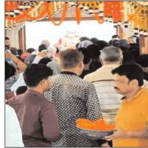
की गलियों तक में भंडारे लगे हैं। शहरभर के मंदिरों में भक्तों के जयकारे और लाउडस्पीकर पर बज रहे भजनों से माहौल फिफकम है। अलीगंज प्राचीन मंदिर, पुरतधाम, गुलाचीन, लेटे हनुमान मंदिर और दक्षिणमुखी हनुमान मंदिर में भक्तों का दर्शन के लिए तांता लगा है।

राजधानी लखनऊ में ज्येष्ठ माह के आठवें और अंतिम बड़े मंगल पर हनुमान मंदिरों में भीड़ है। सुबह 4 बजे से ही बड़ी संख्या में श्रद्धालु हनुमान मंदिरों में दर्शन और पूजा-अर्चना के लिए पहुंचने लगे। शहर के प्रमुख मंदिरों कृष्णमठ धाम, हनुमान सेतु, अलीगंज स्थित श्री महावीर हनुमान मंदिर, प्राचीन हनुमान मंदिर सहित सभी हनुमान मंदिरों में श्रद्धालुओं की लंबी कतारें देखने को मिल रही हैं। भक्तों ने बजरंगबली के दर्शन कर सुख-समृद्धि और परिवार की खुशहाली की कामना की। आज शहर में 1000 हजार से ज्यादा भंडारे हो रहे हैं। मुख्य मार्गों से लेकर मोहल्ले