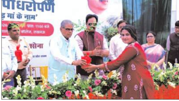
पौधरोपण के उपरान्त वन मंत्री तथा समस्त उपस्थित लोगों ने अलीगंज, लखनऊ में अग्निकांड में जान गवाने वालों को श्रद्धांजलि अर्पित करने के बाद कहा कि हमारी सरकार दोषियों के विरुद्ध कठोर कार्रवाई करेगी तथा घायलों को हर सम्भव सहायता उपलब्ध करवाई जा रही है। मुख्य अतिथि डा.अरूण सक्सेना ने

डॉ. श्यामा प्रसाद मुखर्जी के बलिदान दिवस के अवसर पर उनकी राष्ट्रसेवा, एकात्मकता एवं जनकल्याण के आदर्शों को स्मरण करते हुए पर्यावरण संरक्षण के प्रति जन-जागरूकता बढ़ाने के उद्देश्य से मंगलवार को कालिन्ध तालुकदार कॉलेज, लखनऊ में वन मंत्री डा.अरूण सक्सेना ने अशोक का पौधा रोपित किया।