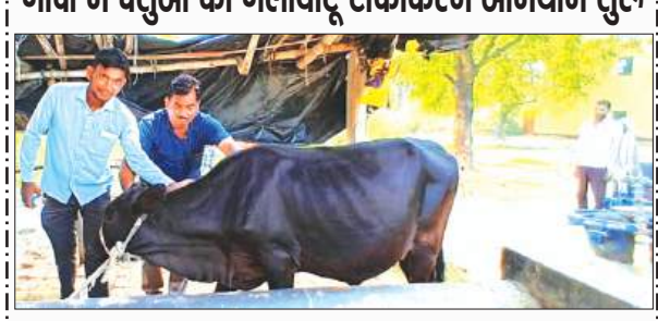
समृद्धि न्यूज, गोला गोकर्णनाथ खीरी।