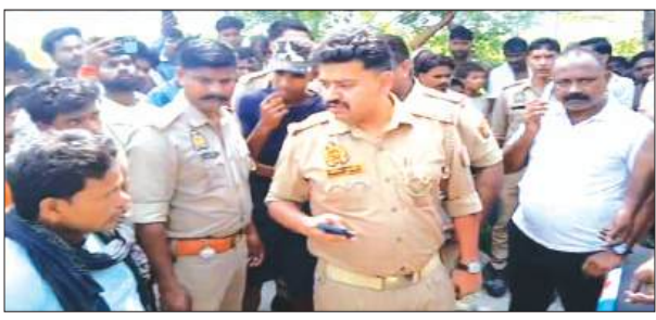
समृद्धि न्यूज, निधासन, खीरी।

पड़ुआ थाना क्षेत्र में मंगलवार सुबह एक दर्दनाक हादसे में डीसीएम चालक की कंठ लगने से मौत हो गई। परमोधापुर गांव के निकट झूल रही हाईटेंशन विद्युत लाइन की चपेट में आने से वाहन में कंठ दौड़ गया। बताया जा रहा है कि चालक लाइन को हटाने के लिए वाहन की छत पर चढ़ था, तभी वह कंठ की चपेट में आ गया और मौके पर ही उसकी मौत हो गई। घटना के बाद क्षेत्र में हड़कंप मच गया और बड़ी संख्या में ग्रामीणों पर जुट गए। जानकारी के अनुसार मंगलवार सुबह करीब नौ बजे एक डीसीएम वाहन परमोधापुर गांव के एक किसान के खेत से केला लाने जा रही थी। वाहन जब खरवहिया-परमोधापुर मार्ग पर पहुंचा तो सड़क के ऊपर से गुजर रही हाईटेंशन विद्युत लाइन का तार काफी नीचे झूल रहा था। प्रत्यक्षदर्शियों के मुताबिक झूलता हुआ तार डीसीएम की ऊपरी छत से छू गया, जिससे पूरे वाहन में कंठ प्रवाहित हो गया। बताया जाता है कि चालक ने स्थिति को सामान्य करने के उद्देश्य से वाहन के ऊपर चढ़कर तार को हटाने का प्रयास किया। इसी दौरान वह