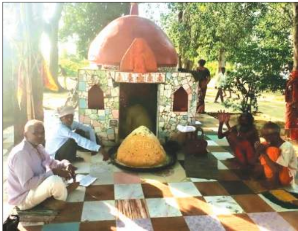
पूजा-अर्चना के साथ 1 कुंटल 25 किलोग्राम लड्डू प्रसाद तैयार कर

गोला गोकर्णनाथ खीरी। ज्येष्ठ मास के अंतिम बड़े मंगल के पावन अवसर पर थाना हैदराबाद क्षेत्र के गोला-बांकेगंज रोड स्थित गैस गोदाम के सामने, नगरा सलेमपुर और ग्राम पंचायत कोरैया की सीमा पर बने सार्वजनिक हनुमान मंदिर में श्रद्धा, भक्ति और सेवा का अद्भुत संगम देखने को मिला। मंदिर परिसर में आयोजित धार्मिक कार्यक्रम में बड़ी संख्या में श्रद्धालु शामिल हुए और पूरे क्षेत्र में भक्तिमय वातावरण छा गया। इस अवसर पर भगवान श्री बालाजी (हनुमान जी) के लिए विशेष