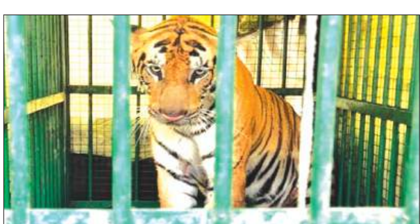
समृद्धि न्यूज, निधासन, खीरी।

मझगाई वन क्षेत्र में पिछले कुछ दिनों से लोगों की नींद उड़ाने वाला बाघ आखिरकार वन विभाग के कब्जे में आ गया। दो ग्रामीणों की जान लेने के बाद यह बाघ पूरे इलाके में दहशत का कारण बना हुआ था। खेतों में काम करने से लेकर घरों से बाहर निकलने तक लोग भयभीत थे। वन विभाग की लगातार निगरानी और अभियान के बाद बाघ को पिंजरे में कैद कर लिया