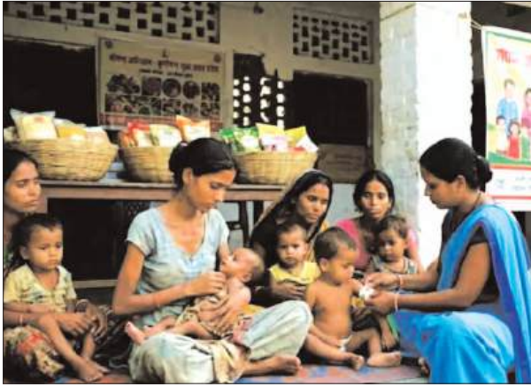
ध्यान दिया जाएगा। संभव 6.0 अभियान को प्रभावी बनाने के लिए आईसीडीएस, स्वास्थ्य विभाग, पंचायती राज

मुख्यमंत्री योगी आदित्यनाथ के मार्गदर्शन में बाल विकास एवं पुष्टहार विभाग ने मातृ एवं बाल कुपोषण को कम करने तथा पोषण सुरक्षा को मजबूत बनाने के उद्देश्य से संभव 6.0 अभियान की शुरुआत की है। अभियान का राज्य स्तरीय शुभारम्भ बीती 18 जून को लखनऊ से किया गया। इस वर्ष अभियान की थीम गर्भावस्था से बाल्यावस्था तक पोषण सुरक्षा निर्धारित की गई है, जिसके अंतर्गत नवजात महिलाओं, धात्री माताओं, गर्भवता शिशुओं और बच्चों को बेहतर पोषण एवं स्वास्थ्य सेवाएं उपलब्ध कराने पर विशेष