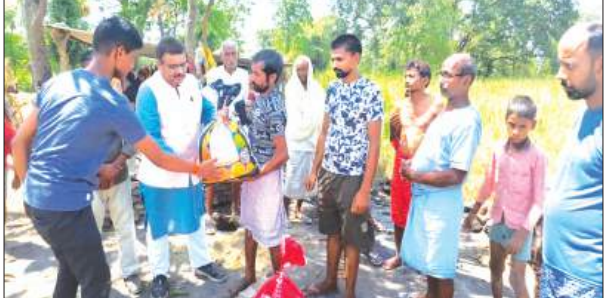
समृद्धि न्यूज, निधासन, खीरी।