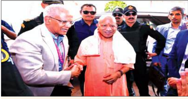
भारत में सेफ्टी, स्टेबिलिटी व स्पीड का थ्री-एस मॉडल बना यूपी

मुख्यमंत्री योगी आदित्यनाथ ने कहा कि उत्तर प्रदेश भारत के लिए सेफ्टी, स्टेबिलिटी व स्पीड का थ्री-एस मॉडल बन चुका है। उद्योग के लिए ये तीनों आयाम सबसे महत्वपूर्ण हैं। सुदृढ़ कानून-व्यवस्था, वर्ल्ड क्लास इंफ्रास्ट्रक्चर, बेमिसाल कनेक्टिविटी, पारदर्शी प्रशासन और संस्थाओं का बेहतर नेटवर्क नए उत्तर प्रदेश की पहचान है। स्विट्जरलैंड, टेक्नोलॉजी और इन्वेस्टमेंट-फ्रेंडली पॉलिसी, कुल मिलाकर एक संपूर्ण इंडस्ट्रियल इकोसिस्टम आज नए भारत के नए यूपी में मौजूद है। मुख्यमंत्री बुधवार को बेंगलुरु में 'उत्तर प्रदेश ग्लोबल ग्रोथ डायलॉग 2026' के तहत रोडशो में बिजनेस लीडर्स को संबोधित कर रहे