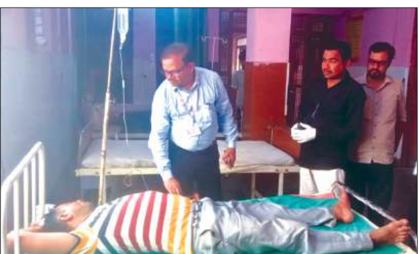
नरीय का हालवाह लेते एसीएमओ

अपर मुख्य चिकित्साधिकारी डॉ. सर्वेश कुमार यादव ने कायमगंज सामुदायिक स्वास्थ्य केंद्र का औचक निरीक्षण किया। निरीक्षण के दौरान उन्होंने अस्पताल की व्यवस्थाओं का जायजा लिया और स्टाफकी उपस्थिति जांची। सीएचसी पहुंचकर एसीएमओ डॉ0 सर्वेश कुमार यादव ने सबसे पहले अटेंडेंस रजिस्टर चेक किया। उन्होंने ड्यूटी पर तैनात डॉक्टरों और कर्मचारियों की उपस्थिति की जानकारी ली। अनुपस्थित मिलने वाले