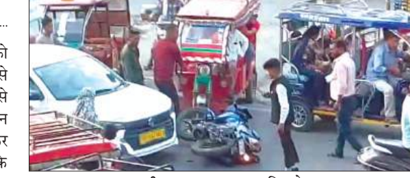
घटना स्थल पर पड़ी बाइक