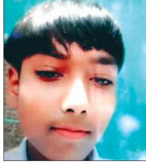
मृतक का फाइल फोटो

गंगा में डूबने से किशोर की मौत हो गयी। जानकारी होने पर परिजनों में कोहराम मच गया। सूचना पर पहुंची पुलिस ने जांच पड़ताल की और शव का पंचनामा भरकर पोस्टमार्टम के लिए भिजवाया।