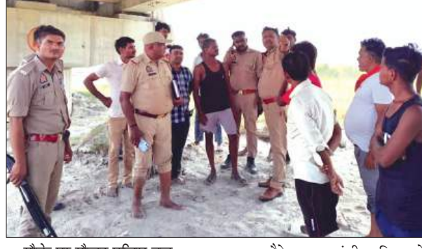
मौके पर मौजूद पुलिस बल

गहरे पानी में चला गया। जिससे तेज बहाव में आने पर वह डूबने लगा। साथियों ने बचाने का काफी प्रयास किया, लेकिन वह अस्फल रहे। जिसके कारण उसकी मौके पर ही मृत्यु हो गई। जिसकी सूचना परिवार वालों तथा पुलिस को दी गई। मौके पर पहुंची