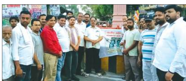
श्रद्धांजलि कार्यक्रम में मौजूद लोग

लखनऊ के अलीगंज स्थित कोचिंग सेंटर में हुई दर्दनाक अग्निकाण्ड की घटना में जान गवाने वाले छात्रों को श्रद्धांजलि अर्पित करने के लिए कायमगंज में कैडिल मार्च निकाला गया। भारतीय उद्योग व्यापार मंडल नगर समिति के तत्वावधान में आयोजित कार्यक्रम में बड़ी संख्या में व्यापारी, समाजसेवी और नगर के गणमान्य नागरिक शामिल हुए। शिवाजी मूर्ति से हुई, जहां उपस्थित लोगों ने दो मिनट का मौन रखकर दिवंगत छात्रों की आत्मा की शांति के लिए प्रार्थना की। हाथों में मोमबतियां लेकर श्रद्धांजलि मार्च निकाला गया, जो नगर के प्रमुख