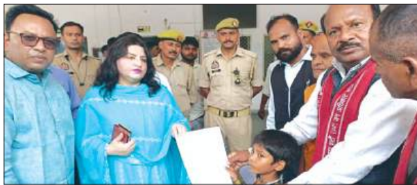
नगर मजिस्ट्रेट को ज्ञापन सौंपते लोग