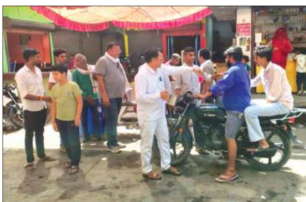
कायमगंज, समृद्धि न्यूज़।

गंगा दशहरा के पावन पर्व पर उत्तर प्रदेश उद्योग व्यापार संगठन के जिलाध्यक्ष के नेतृत्व में गल्ल मंडी चौराहा स्थित जिला कार्यालय एवं प्रतिष्ठान पर शीतल शरबत वितरण