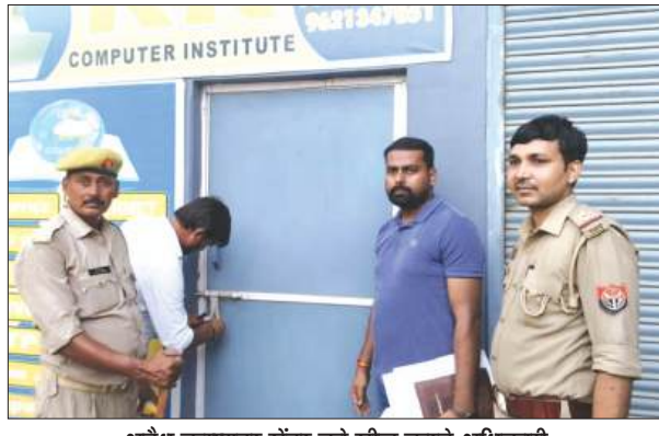
अवैध कम्प्यूटर सेंटर को सील करते अधिकारी

लखनऊ के अलीगंज स्थित कोचिंग सेंटर में हुई दर्दनाक अग्निकांड की घटना के बाद मुख्यमंत्री के आदेश के बाद जिला प्रशासन सख्त है। बुधवार को नगर मजिस्ट्रेट की अगुवाई में कई जगह छापेमारी कर फतेहगढ़ में दो कोचिंग सेंटरों पर छाप मारा गया। पुलिस, प्रशासन, अतिरिक्त विभाग, प्राधिकरण और विद्युत सुरक्षा से जुड़े अधिकारियों टीमों ने कोचिंग संस्थानों में सुरक्षा मानकों और नियमों की अनदेखी का निरीक्षण किया। खामियां मिलने पर विशाल मेगा मार्ट सहित दो कोचिंग सेंटर को सील कर दिया गया