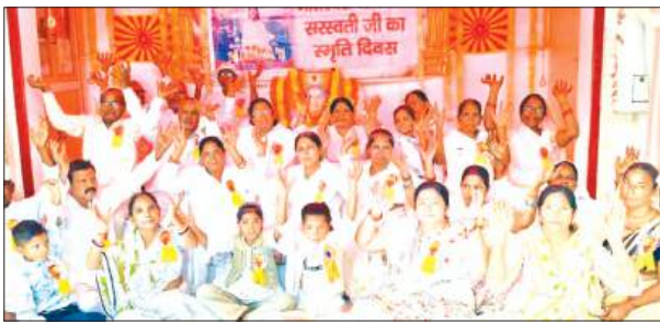
कार्यक्रम में मौजूद बीके बहने व बच्चे