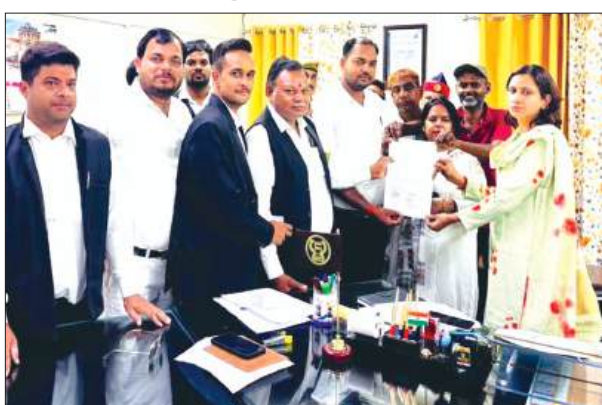
डीएम को ज्ञापन सौंपते लोग

कैन्ट बोर्ड जनरल लैण्ड रजिस्टर (जी.एल.आर.) रिकार्ड और न्यायालय के आदेश का उल्लंघन कर राजपूत रजिमेंट सेन्टर आर.आर.सी. द्वारा किलाघाट मार्ग को मनमाने ढंग से बन्द किये जाने और रास्ता बहाल कराने के संबंध में डीएम को ज्ञापन सौंपा गया।