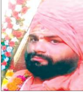
मृतक का फाइल फोटो