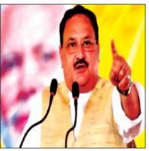
एम्स ऋषिकेश स्वास्थ्य क्षेत्र में अग्रणी संस्थान के रूप में उभरा: केंद्रीय स्वास्थ्य एवं परिवार कल्याण मंत्री

उन्होंने बताया कि एम्स ऋषिकेश स्वास्थ्य क्षेत्र में अग्रणी संस्थान के रूप में उभरा है और ऊधमसिंह नगर में लगभग 500 करोड़ रुपये की लागत से इसका सैटेलाइट सेंटर स्थापित किया जा रहा है। उन्होंने कहा कि एम्स ऋषिकेश में 124 करोड़ रुपये की लागत से क्रिटिकल केयर ब्लॉक विकसित किया गया है। इसके अलावा अल्मोड़ा, ऊधमसिंह नगर, पिथौरागढ़ और हरिद्वार में एक हजार करोड़ रुपये से अधिक की लागत से चार नए मेडिकल कॉलेज विकसित किए जा रहे हैं, जिससे पर्वतीय और दूरस्थ क्षेत्रों में स्वास्थ्य सेवाओं की पहुंच और मजबूत होगी। मानसिक स्वास्थ्य के क्षेत्र में केंद्र सरकार की पहल का उल्लेख करते हुए कहा कि लंबे समय तक मानसिक स्वास्थ्य को पर्याप्त प्राथमिकता नहीं मिली। उन्होंने कहा कि मानसिक रोगों से प्रभावित लोग अक्सर अपनी समस्या को सार्वजनिक नहीं करना चाहते और कई बार उसे बीमारी के रूप में स्वीकार करने से भी हिचकते हैं। उन्होंने बताया कि इसी चुनौती को ध्यान में रखते हुए केंद्र सरकार ने 'टेली-मानस' पहल शुरू की है, जिसके तहत टेल-फ्री माध्यम से मानसिक स्वास्थ्य संबंधी समस्याओं से जुड़ रहे लोगों को विशेष परामर्श और मार्गदर्शन उपलब्ध कराया जा रहा है। केंद्रीय मंत्री ने कहा कि वर्तमान सरकार 'सबका साथ, सबका विकास' के मंत्र के साथ कार्य कर रही है और विकास योजनाओं का लाभ समाज के सभी वर्गों तक पहुंचाने का प्रयास किया जा रहा है।