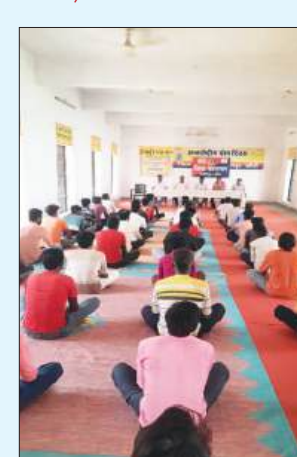
जागरूकता, समय पर परामर्श और उचित उपचार बेहद जरूरी है। कार्यक्रम के दौरान कैदियों को नशा विरोधी शपथ दिलाई गई तथा स्वस्थ जीवनशैली अपनाने और अन्य लोगों को भी नशे से दूर रहने के लिए प्रेरित