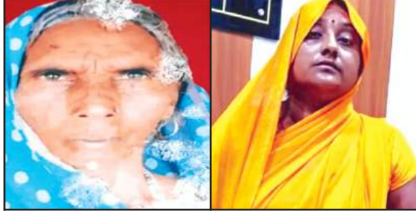
मृतका का फाइल फोटो