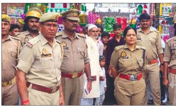
मोहरम जुलूस में मौजूद पुलिस बल के साथ सीओ

निरीक्षण किया। इस दौरान ताजिया मार्गों, प्रमुख चौराहों एवं संवेदनशील स्थानों पर तैनात पुलिस बल को आवश्यक दिशा-निर्देश दिए गए तथा सुरक्षा व्यवस्था का जायजा लिया गया। मोहरम पर्व को सफुल्ल एवं शांतिपूर्ण