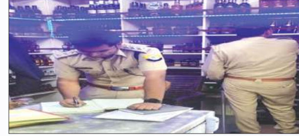
शराब ठेके पर जांच करते आबकारी इंसपेक्टर

शराब दुकान अमेठी कोहना, खानपुर, नरकसा, कम्पोजिट दुकान कादरी गेट तिराहा, कादरी गेट 2, मॉडल शॉप अमेठी कोहना की जांच की गई। निरीक्षण के दौरान दुकानों के स्टॉक रजिस्टर, ऑनलाइन भुगतान व्यवस्था, मशीन से बिक्री एवं सीसीटीवी कैमरों की कार्यशीलता का परीक्षण किया तथा देशी दुकानों की कैटिन की भी सघन जांच की गई। संबंधित अनुज्ञापियों को निर्देशित किया गया कि सभी अभिलेख अद्यतन रखें तथा शासन द्वारा निर्धारित