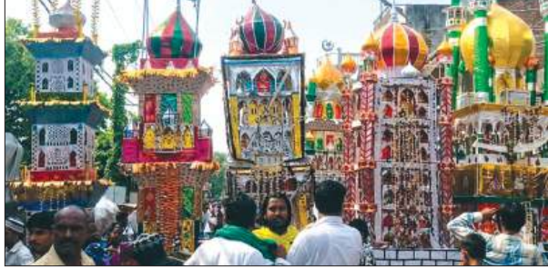
जुलूस में शामिल शिया समाज के लोग

इस्लामी मान्यता के अनुसार, कर्बला के मैदान में हजरत इमाम हुसैन और उनके 72 साथियों एवं परिवार के सदस्यों ने सत्य, न्याय और इस्लाम की मूल शिक्षाओं की रक्षा के लिए अपनी शहादत दी थी। उनकी याद में हर वर्ष मोहरम के दौरान दुनिया भर में मुस्लिम समुदाय शोक और श्रद्धा के साथ विभिन्न धार्मिक कार्यक्रम आयोजित करता है। कमालगंज में ताजिया जुलूस