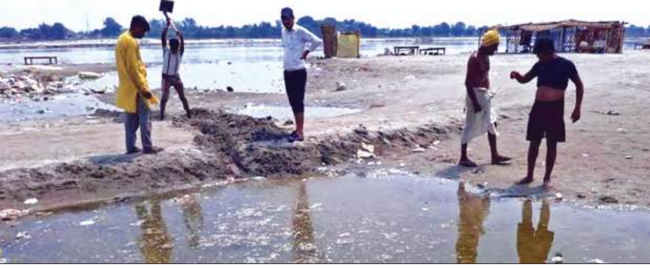
कड़ह में मरी पड़ी मछलियां दखते लोग