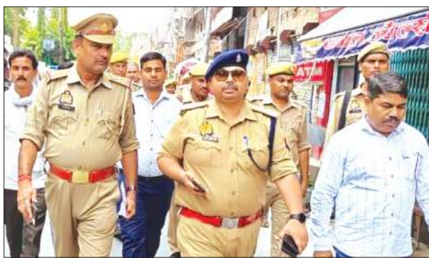
कमालगंज में भ्रमण करते एसपी मौजूद पुलिस बल

जिले में मोहरम के पर्व को शांतिपूर्ण और सौहार्दपूर्ण माहौल में संपन्न कराने के लिए पुलिस प्रशासन पूरी तरह से अलर्ट मोड पर रही। पुलिस अधीक्षक (एसपी) के कड़े निर्देशों के बाद जनपद के सभी थाना क्षेत्रों में सुरक्षा व्यवस्था चाक-चौबंद कर दी गई और पुलिस बल चप्पे-चप्पे पर मुस्तैद रही। एसपी के आदेशानुसार, शहर से लेकर ग्रामीण अंचलों तक सभी प्रमुख चौराहों, मिश्रित आबादी वाले क्षेत्रों, संवेदनशील इलाकों और इमामबाड़ों के आसपास भारी पुलिस बल की तैनाती की गई। वहीं अपर पुलिस अधीक्षक ने मोहरम पर्व के दृष्टिगत थाना कमालगंज क्षेत्र में भ्रमण कर सुरक्षा एवं कानून व्यवस्था का