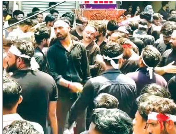
जुलूस में मातम करते शिया समाज के लोग

शहर में मोहरम की दसवीं तारीख (आशुरा) पर पारंपरिक अकीदत और गमगीन माहौल के बीच मोहरम का मुख्य जुलूस निकाला गया। हजरत इमाम हुसैन और कर्बला के शहीदों की याद में अकीदतमंदों ने या हुसैन की सदाओं के साथ मातम किया और गानभेदी नारों के बीच आकर्षक ताजिये उठाए। शहर के असगर रोड से सुनहरी मस्जिद होते हुए बुरा वाली गली से चुमना, नेहरु रोड से चौक पर हुसैन की याद में अकीदतमंदों ने सदाओं के साथ मातम किया और खुनी मंजर देख लोग कर्बला के शहीदों को याद किया।