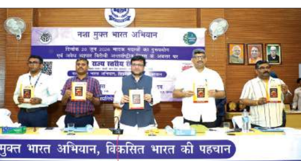
मुक्त भारत अभियान, विकसित भारत की पहचान