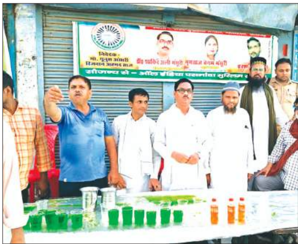
शरबत वितरित करते लोग