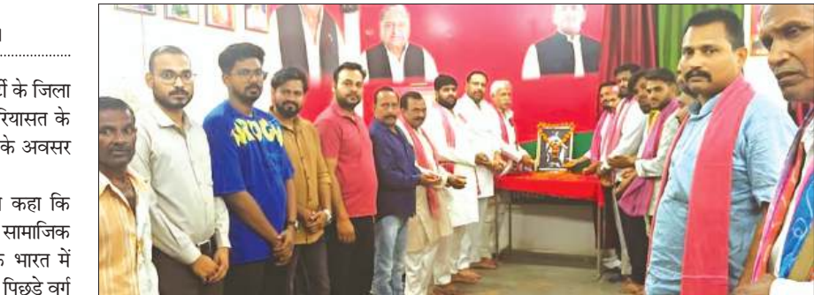
गोष्ठी में पुष्प अर्पित करते सपा नेता