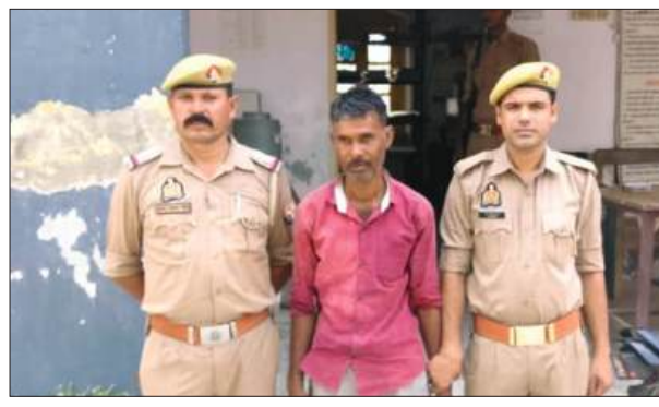
पुलिस हिरासत में आरोपी