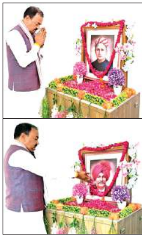
प्रदान की, वहीं राजर्षि छत्रपति शाहू जी महाराज ने शिक्षा, सामाजिक

उप मुख्यमंत्री अपने सोशल मीडिया पोस्ट में लिखा कि बंकिम चन्द्र चट्टोपाध्याय ने अपने साहित्य और राष्ट्रीय 'वन्दे मातरम्' के माध्यम से देशभक्ति की चेतना को नई ऊर्जा