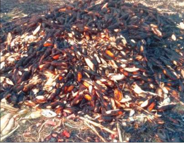
खेत में जली पड़ी मक्का

मक्का की फसल काटकर खेत में लगायी गयी थी। जिसके बाद किसान घर पर चला गया। इस दौरान अज्ञात व्यक्ति ने मक्के की फसल में आग लगा दी। जिससे मक्का की फसल जल गई। सूचना पर पहुंची पीड़ित के होश उड़ गये। घटना के संबंध में थाने में तहरीर दी।