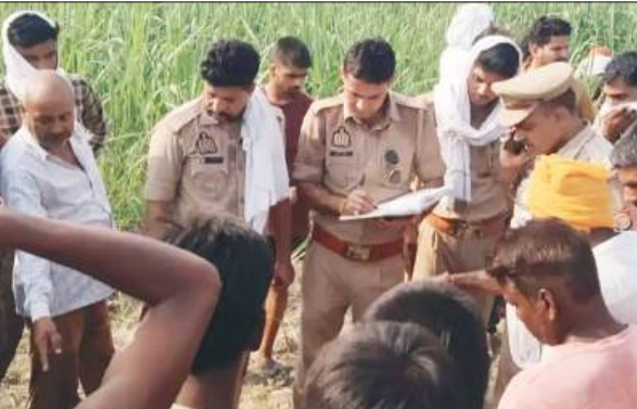
पीलीभीत, समृद्धि न्यूज़।