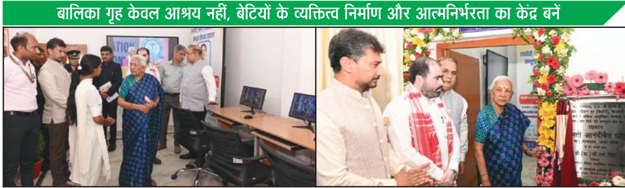
बालिका गृह केवल आश्रय नहीं, बेटियों के व्यक्तित्व निर्माण और आत्मनिर्भरता का केंद्र बनें

प्रदेश की राज्यपाल आनंदीबेन पटेल ने राजकीय संप्रेक्षण गृह (किशोरी), बाराबंकी में राम मनोहर लोहिया आयुर्विज्ञान संस्थान, लखनऊ द्वारा स्थापित कंप्यूटर लैब का उद्घाटन तथा सर्वाङ्कल कैम्पर जागरूकता एवं एचपीवी टीकाकरण अभियान का शुभारंभ व विभिन्न व्यवस्थाओं का निरीक्षण किया। इस अवसर पर उन्होंने संप्रेक्षण गृह में निवासरत किशोरियों से आत्मीय संवाद कर उनके जीवन, शिक्षा, स्वास्थ्य एवं भविष्य की योजनाओं के संबंध में जानकारी प्राप्त की। सर्वाङ्कल कैम्पर जागरूकता एवं एचपीवी टीकाकरण अभियान के अंतर्गत राजकीय संप्रेक्षण गृह (किशोरी), बाराबंकी तथा कस्तूरबा