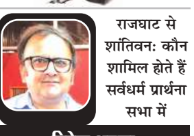
राजघाट से शांतिवन: कौन शामिल होते हैं सर्वधर्म प्रार्थना सभामें