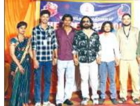
कार्यक्रम में मौजूद लोग