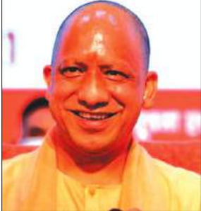
► जनता दर्शन में लोगों की सुनी बात, अफसरों को दिए समाधान के निर्देश

समृद्धि न्यूज, लखनऊ। मुख्यमंत्री योगी आदित्यनाथ ने कहा है कि शासन की कल्याणकारी योजनाओं का लाभ हर पात्र नागरिक तक पहुंचाना सुनिश्चित किया जाए। आवास से लेकर इलाज तक, बिटिया की पढ़ाई व विवाह से लेकर निशुल्क व बुजुर्गों की पेंशन तक, समाज के हर जरूरतमंद के लिए सरकार की अनेक योजनाएं हैं। पात्र लोगों से आवेदन करकर इन योजनाओं का लाभ उन तक पहुंचाया जाए। सीएम योगी मंगलवार को जनता दर्शन में अधिकारियों को निर्देशित कर रहे थे। मुख्यमंत्री योगी आदित्यनाथ ने मंगलवार सुबह गोरखनाथ मंदिर में जनता दर्शन में करीब 200 लोगों से मुलाकात कर उनकी समस्याओं पर त्वरित इन्वेस्टमेंट दिलाया। जनता दर्शन में सब बा भी कुछ लोग इलाज के लिए आर्थिक मदद की गुहार लेकर आए थे। मुख्यमंत्री ने उन्हें भरोसा दिया कि धन के अभाव में किसी का इलाज नहीं रहेगा। जौनपुर से आई एक महिला ने एक एनजीओ पर फर्जी प्रमाण पत्र देने का आरोप लगाते हुए उसके खिलाफ जांच की मांग की। मुख्यमंत्री ने