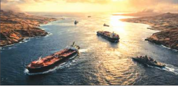
► अगले हफ्ते समझौते के साथ होर्मुज खुलने की उम्मीद : ट्रंप

एजेंसी, तेहरान/वाशिंगटन। ईरान की अब 'बाब अल-मंदेब जमडरूमध्य' को बंद करने की धमकी से मध्य पूर्व (पश्चिम एशिया/मिडिल ईस्ट) में जारी तनाव और बढ़ गया है। ईरान के इस रुख से होर्मुज जलडमरूमध्य के बंद होने से पहले से परेशान दुनिया पर नई गाज गिरने का अंदेश है। ईरान ने एक तरह से अमेरिकी राष्ट्रपति डोनाल्ड ट्रंप के पाले में गेंद उछाल दी है। उसने कहा कि अगर इजराइल-लेबनान के बीच त्रुण्ड नहीं रुकवाते, तो वह होर्मुज के बाद दूसरे सबसे बड़े रणनीतिक समुद्री मार्ग बाब अल-मंदेब जलडमरूमध्य को बाधित करने से पीछे नहीं हटेगा। इस सबसे निश्चित ट्रंप ने कहा कि मध्यस्थ वार्ताकारों के माध्यम से ईरान के साथ वार्ता तेजी