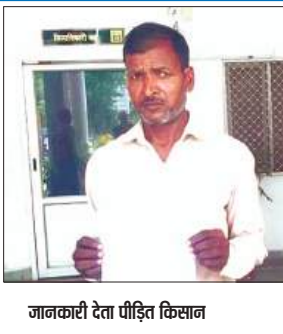
जानकारी देता पीड़ित किसान