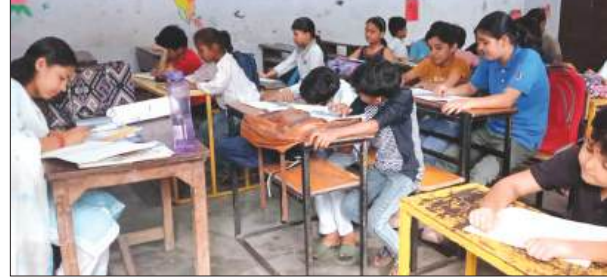
चित्रकला प्रतियोगिता में भाग लेते बच्चे

पिचवाई पेंटिंग से लेकर मंडला आर्ट तक का दिया जा रहा प्रशिक्षण फर्रुखाबाद, समृद्धि न्यूज़।