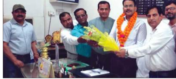
डीआईओएस को बुरे देते अटेवा नेता