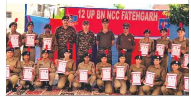
प्रमाण पत्र दिखाते एनसीसी कैडेट्स मौजूद अधिकारी