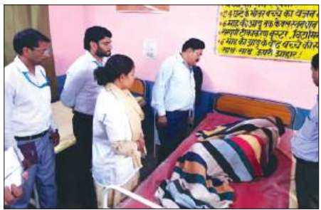
मरीज से बात करते सीएमओ

जन औषधि केंद्र, पैथोलॉजी लैब, राजकीय किशोर स्वास्थ्य केंद्र, लेबर रूम, जेएसवाई वार्ड, डेंटल केयर यूनिट, वीपीएन यूनिट तथा आरएनटीसीपी केंद्र सहित अन्य विभागों का निरीक्षण किया। इस दौरान उन्होंने भर्ती मरीजों से सीधे बातचीत कर स्वास्थ्य सेवाओं और उपचार व्यवस्था की जानकारी ली तथा मिलने वाली सुविधाओं के बारे में पूछा। निरीक्षण के बाद सीएमओ डॉ. आनंद उपाध्याय ने बताया कि सीएचसी में चिकित्सकों की कमी को दूर करने के लिए शासन स्तर पर प्रयास किए जा रहे हैं। जल्द ही आवश्यक डॉक्टरों की तैनाती कर स्वास्थ्य सेवाओं को और मजबूत बनाया जाएगा। उन्होंने कहा कि उपलब्ध संसाधनों और सीमित स्टॉफ के बावजूद अस्पताल की व्यवस्थाएं संतोषजनक मिली हैं तथा कर्मचारी पूरी निष्ठा के साथ अपने दायित्वों का निर्वहन कर रहे हैं।