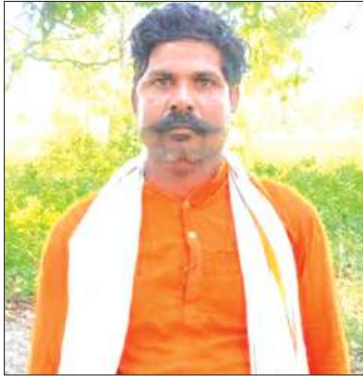
ब्रेन ट्यूमर का हुआ था ऑपरेशन पवन बताते हैं कि वर्ष 2021 में लगातार सिरदर्द और उल्टी की शिकायत पर लखनऊ के निजी अस्पताल में करीब 325 ग्राम की गांठ निकालने के लिए उनका ब्रेन ऑपरेशन हुआ। हालांकि, बायोप्सी जांच में 'ब्रेन टीबी' की पुष्टि हुई। असली संघर्ष तब शुरू हुआ जब ऑपरेशन के बाद सिर के घाव से लगातार मवाद बहने लगा। इसके कारण उन्हें भारी सामाजिक उपेक्षा झेलनी पड़ी, यहां तक कि नाई भी बाल काटने में सकोच करता था, जिससे उनका मनोबल टूट गया।

▶ ब्रेन ट्यूमर के ऑपरेशन के बाद निकली टीबी ▶ सिर से बहते मवाद और सामाजिक दंश से टूटी थी उम्मीद, अब 'टीबी चैंपियन' बन जगा रहे अलवर ▶ बाल और नाखून छोड़कर शरीर के किसी भी अंग में हो सकता है टीबी का संक्रमण