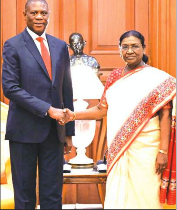
► दोनों देशों के संबंधों को नई ऊंचाई देने पर सहमति

एजेंसी, नई दिल्ली। दक्षिण अफ्रीका के उपराष्ट्रपति शिपोकासा पॉल्स माशातिले ने सोमवार को राष्ट्रपति भवन में राष्ट्रपति द्रौपदी मुर्मु से मुलाकात की। दोनों नेताओं ने भारत-दक्षिण अफ्रीका संबंधों को और मजबूत बनाने, व्यापार बढ़ाने तथा वैश्विक दक्षिण के हितों को आगे बढ़ाने के लिए आपसी सहयोग बढ़ाने पर सहमति जताई। राष्ट्रपति सचिवालय के अनुसार राष्ट्रपति मुर्मु ने भारत की पहली यात्रा पर आए माशातिले का स्वागत करते हुए कहा कि भारत और दक्षिण अफ्रीका के संबंध ऐतिहासिक और समकालीन दोनों दृष्टियों से विशेष महत्व रखते हैं। उन्होंने कहा कि साझा मूल्यों और पारस्परिक सम्मान पर आधारित दोनों देशों की बहुआयामी साझेदारी लगातार मजबूत हुई है। वर्ष 1997 में दक्षिण अफ्रीका पहला देश था, जिसके साथ अफ्रीकी संघ आयोग के साथ मिलकर कार्य करेगा। बैठक के दौरान दोनों नेताओं ने इस बात पर सहमति व्यक्त की कि भारत और दक्षिण अफ्रीका के बीच रणनीतिक साझेदारी स्थापित की थी। राष्ट्रपति ने कहा कि भारत और दक्षिण अफ्रीका हमेशा वैश्विक दक्षिण की मजबूत आवाज रहे हैं।