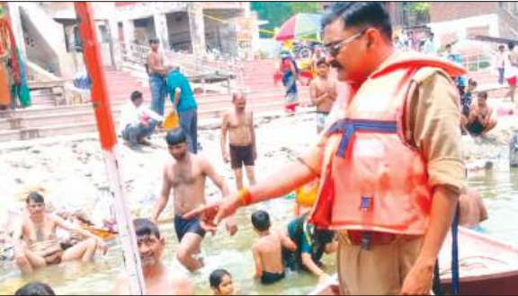
श्रद्धालुओं को जागृत करती पुलिस

फरुखाबाद, समृद्धि न्यूज़। ज्येष्ठ पूर्णिमा पर फतेहगढ़ में श्रद्धालुओं की भारी भीड़ को देखते हुए पुलिस प्रशासन द्वारा गंगा घाटों पर व्यापक सुरक्षा व्यवस्था सुनिश्चित की गई। इस दौरान पुलिस अधिकारियों एवं कर्मियों ने घाटों पर मौजूद श्रद्धालुओं से सुरक्षित एवं सावधानीपूर्वक गंगा स्नान करने की अपील की। पुलिस द्वारा श्रद्धालुओं को गहरे पानी में न जाने, बैरिक्डिंग के भीतर ही स्नान करने, बच्चों एवं बुजुर्गों का विशेष ध्यान रखने तथा किसी भी प्रकार की अफवाह पर ध्यान न देने की सलाह दी गई। साथ ही लोगों से प्रशासन द्वारा जारी दिशा-निर्देशों का पालन करने एवं किसी भी आपात स्थिति में तत्काल ड्यूटी पर तैनात पुलिसकर्मियों से संपर्क करने का आग्रह किया गया।