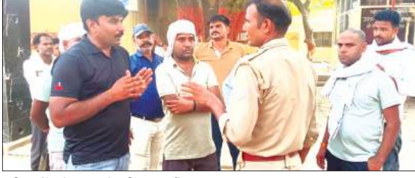
परिजनों को समझाते पुलिस कर्मी