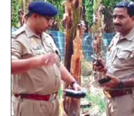
जांच पड़ताल करती पुलिस

विश्व हिन्दू परिषद गौरका दल की सूचना पर पुलिस व फॉरेंसिक टीम ने पहुंचकर की जांच कायमगंज, समृद्धि न्यूज़।