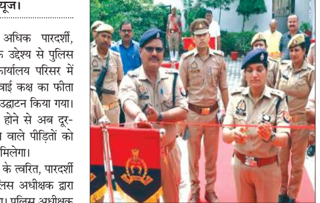
फीता काटकर उद्घाटन करती एसपी

सोमवार को आमजन की समस्याओं के त्वरित, पारदर्शी एवं प्रभावी निस्तारण के उद्देश्य से पुलिस अधीक्षक द्वारा नवीन जनसुनवाई कक्ष का उद्घाटन किया। पुलिस अधीक्षक ने कहा कि नवीन जनसुनवाई कक्ष के माध्यम से फेरियादियों की शिकायतों को सुव्यवस्थित एवं सहज वातावरण में सुना जाएगा तथा उनके गुणवत्तापूर्ण, निष्पक्ष एवं समयबद्ध निस्तारण के सर्वोच्च प्राथमिकता दी जाएगी। जनसेवा, पारदर्शिता एवं संवेदनशील पुलिसिंग की दिशा में यह एक महत्वपूर्ण कदम है। उन्होंने उपस्थित अधिकारियों और पुलिसकर्मियों को संबोधित करते हुए कड़े निर्देश दिए। उन्होंने कहा पुलिस का मूल मंत्र जनता की सेवा और सुस्था