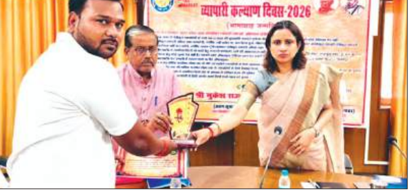
निवेशक के प्रतिनिधि को सम्मानित करते विधायक व डीएम