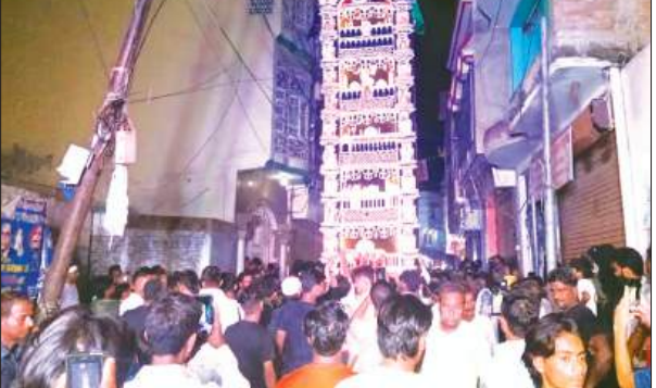
अलम जुलूस गौगुद लोग

नगर में मोहर्तम की 12वीं का पारंपरिक जुलूस रविवार देर रात 10 बजे अकीदत और शांतिपूर्ण माहौल में निकाला गया। जामा मस्जिद से मुख्य अलम का आगाज हुआ। इसमें 8-10 अन्य छोटे अलम भी शामिल थे। जुलूस में शामिल अकीदतमेंधनों में गहरा उत्साह देखा गया। यह जुलूस जामा मस्जिद से शुरू होकर नगर के प्रमुख व्यापारिक और व्यस्त इलाकों से गुजरा। इसमें बजरिया, श्यामा गेट, लोहाई बाजार, शुष्क चौराहा और गल्ला मंडी चौराहा शामिल थे। पूरे रास्ते में हुसैन की सदाएं गुंजती रहीं। जुलूस के दौरान दर्जनों ड्रोल वादक मातमी धुनें बजाते हुए चल रहे थे। अलम