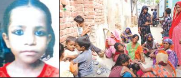
मृतका का फाइल फोटो