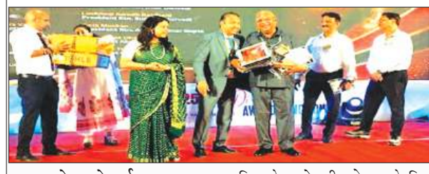
गोला गोकर्णनाथ, (लखीमपुर)।