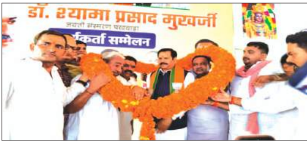
चलने वाली पार्टी है उनके बताएँ मार्ग हम सबके लिए अनुकरणीय है हमारी पार्टी की असली पूजा उसका कार्यकर्ता है भाजपा अपने कार्यकर्ताओं को निष्ठा का पाठ पढ़कर अनुशासन के साथ कार्य करना सिखाती है तो वहीं भाजपा में कार्यकर्ताओं का सम्मान सर्वप्रथम है भाजपा ही वह पार्टी है जहाँ एक