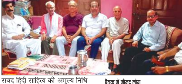
बैठक में गौगुद लोग