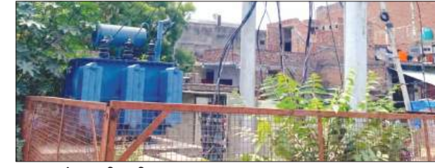
ग्रामगंज नवदिया स्थित ट्रांसफार्मर

की जानकारी देने के लिए जब संबंधित जेई को फोन किया जाता है तो अवसर फोन रिसीव नहीं किया जाता। इससे लोगों में बिजली विभाग के प्रति नाराजगी बढ़ती जा रही है। भीषण गर्मी के बीच लोगों का जनजीवन प्रभावित हो गया है। स्थानीय लोगों का कहना है कि रात होते ही ट्रांसफार्मर में स्पाकिंग होने लगती है और कई बार उसमें आग भी लग जाती है। इसके बावजूद विभाग की ओर से स्थायी समाधान नहीं किया जा रहा है। ट्रांसफार्मर में बार-बार आग लगने से आसपास रहने वाले लोगों में हमेशा हादसे का डर बना रहता है। मोहल्लावासियों का आरोप है कि समस्या