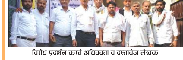
विरोध प्रदर्शन करते अधिवक्ता व दस्तावेज लेखक

फर्रुखाबाद, समृद्धि न्यूज़। तहसील सदर में कार्यरत समस्त अधिवक्ता व दस्तावेज लेखक व समस्त स्टाम्प विक्रेता सरकार की ई-रजिस्ट्री के विरोध में 25 जून से अनिश्चितकालीन हड़ताल पर है। सोमवार को तहसील सदर में कार्यरत समस्त अधिवक्ता व दस्तावेज लेखक व समस्त स्टाम्प विक्रेताओं ने कार्यालय उप रबिंधक सदर बैठककर धरना प्रदर्शन कर रहे हैं। सभी की शासन से मांग है कि ई-रजिस्ट्री की व्यवस्था के चलते प्रदेश भर में लाखों परिवार बेरोजगार हो जायेंगे। सभी ने कहा कि हम लोग शासन की डिजिटलाइजेशन नीति का विरोध नहीं कर रहे हैं। सरकार द्वारा इस नीति के चलते विलेख के रजिस्ट्रेशन की प्रक्रिया प्राइवेट संस्थानों से करायी जा रही है। हम उसका विरोध कर रहे हैं। सभी ने मांग की है कि ई-रजिस्ट्रेशन की प्रक्रिया को प्राइवेट हाथों में न देकर कार्यरत अधिवक्ताओं एवं दस्तावेज लेखकों के माध्यम से ही कार्य कराया जा सके। विरोध के चलते अधिवक्ता संघ व दस्तावेज लेखक संघ ने समाजिक संगठनों से सहयोग की मांग की है। इस दौरान कई अधिवक्ता व दस्तावेज लेखक तथा अन्य लोग मौजूद रहे।