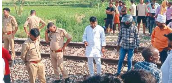
जलालाबाद, समृद्धि न्यूज़।

टाटा- छपरा एक्सप्रेस की चपेट में आने से एक युवक की मौत हो गई। सूचना पर पहुंची पुलिस ने शव को कब्जे में लेकर पोस्टमार्टम के लिए भेज दिया। घटना की जानकारी मिलते ही परिजनों में चीख पुकार मच गई। ब्लॉक क्षेत्र के गांव