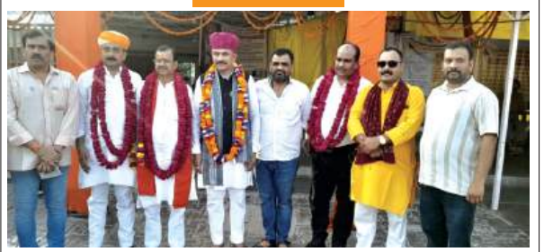
मुख्यमंत्री योगी आदित्यनाथ के जन्मदिन के अवसर पर हनुमान मंदिर मंदिर पर आयोजित भारतीय आखण्ड राष्ट्रवादी पार्टी, कर्णा सीना एवं अन्य क्षेत्रिय संगठनों द्वारा श्रद्धालुओं में फल वितरित किए गए तथा योगी जी की दीर्घायु एवं उत्तम स्वास्थ्य की कामना की गई।

नाले की सफाई के दौरान बिना सुरक्षा उपकरण के मैनहोल में उतरे कर्मचारी की मौत लखनऊ, समृद्धि न्यूज़। राजधानी में आज नाले की सफाई के दौरान एक कर्मचारी की मौत हो गई। वह 3 साधियों के साथ चिन्हट तिराहा फल मंडी के पास नाले की सफाई के लिए मैनहोल में उतारे। नाले में बने गैस की वजह से वह बेहोश हो गया। साधियों ने रस्सी की मदद से उसे बाहर निकाला और डॉ. राममनोहर लोहिया अस्पताल ले गए। स्थिति गंभीर होने पर उसे चंद्र अस्पताल लाया गया, जहां उपचार के दौरान उसकी मौत हो गई। पुलिस के मुताबिक, आज दोपहर में सूचना मिली कि चिन्हट तिराहा फल मंडी के पास नाला सफाई कर रहे कर्मचारियों में से एक अंदर फंस गया है। इस पर पुलिस मौके पर पहुंची। पता चला कि ललित, लाला राम, आकाश कुमार और राजन ठेकेदार आकाश के कहने पर नाले की सफाई कर रहे थे। कर्मचारियों ने बताया कि सफाई के दौरान लालाराम नाले के अंदर फंस गए हैं। उन्हें हम लोगों ने स्थानीय लोगों की मदद से बाहर निकालकर अस्पताल भेजा गया। लालाराम के साथ काम कर रहे ललित ने बताया कि हम लोग नाले के चौंकर की सफाई करने आए थे। लालाराम जैसे ही चौंकर में उतरे, गैस बनने से वह नाले में गिर गए। उनके कंधे पर रस्सी बांधकर उनको नाले से निकाला गया। वह पूरी तरह से अचेत हो गए थे। हम लोग भी लगभग बेहोशी की हालत में पहुंच गए थे। मौके पर कोई सुरक्षा बेल्ट या रस्सी नहीं बांधी थी। सुरक्षा उपकरण के नाम पर सिर्फखिवाड़ किया जा रहा है। घटना की जानकारी होने पर मेयर सुभाष खर्कवाल, नगर आयुक्त गौरव कुमार, चौफड़जीनियर रविश्वल महेश वर्मा, अपर नगर आयुक्त पंकज श्रीवास्तव सहित अन्य अधिकारी अस्पताल पहुंचे। लालाराम के साथ काम करने वाले कर्मचारियों से बातचीत की। घटनाक्रम जाना।