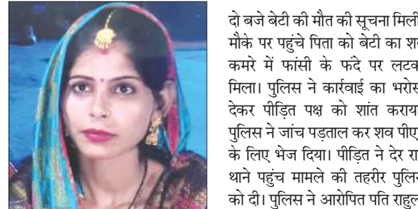
मृतका का फाइल फोटो