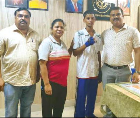
छात्र को बधाई देते जिला क्रीड़ाधिकारी व अन्य