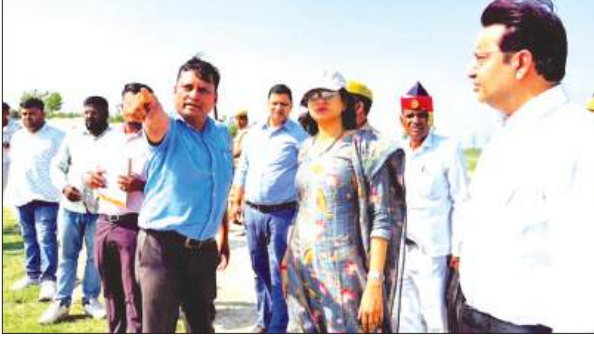
गंगा तट का निरीक्षण करती डीएम

निरीक्षण के दौरान अधिशासी अभियंता सिचाई ने बताया कि लगभग 400.02 लाख रुपये की लागत से 1400 मीटर लंबाई में परकोपाइन