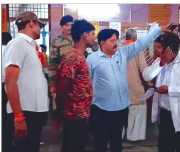
निरीक्षण करते सीएमओ

उन्होंने सख्त लहजे में चेतावनी दी कि भविष्य निधि में अस्पताल परिसर के भीतर किसी भी प्रकार का धूम्रपान या तंबाकू/गुटखा सेवन कतई बर्दाश्त नहीं किया जाएगा। उन्होंने दीवारों और फर्श पर गुटखे की पीक के निशान देखकर गहरा असंतोष जताया और मौके पर ही कर्मचारियों से तुरंत सफाई करवाकर पूरे फर्श को धुलवाया। पच्ची काउंटर पर वार्डबॉय की तैनाती और अस्पताल में स्टाफ की भारी कमी को