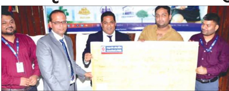
लाभकारी योजनाओं के बारे में विस्तृत जानकारी वहां उपस्थित सभी लोगों को दी। उन्होंने केसीसी एवं स्वयं सहायता समूह योजनाओं पर विशेष जोर दिया।

कहा कि भारत में ग्रामीण जनसंख्या का पूरी जनसंख्या में जितना हिस्सा है, उस अनुपात में उनकी देश की जीडीपी में भागीदारी कम है। इस अंतर को कम करने के लिए कृषि क्षेत्र को अधिक वित्तीय सहायता प्रदान करके देश के ग्रामीण विकास में हमारा बैंक योगदान कर रहा है। उन्होंने बैंक की विभिन्न कृषि संबंधित