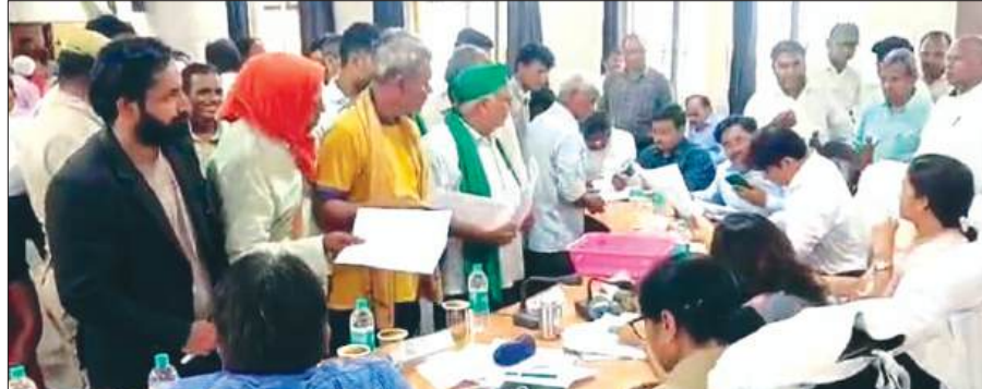
निस्तारण के निर्देश दिए। समाधान दिवस में राजस्व, पुलिस विभाग, विधुत और समाज कल्याण सहित विभिन्न विभागों से सम्बन्धित 216 शिकायतें प्राप्त हुईं।