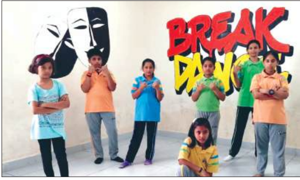
रंगारंग कार्यक्रम प्रस्तुत करते बच्चे

विद्यार्थियों ने प्रस्तुत किये रंगारंग कार्यक्रम मुख्य अतिथि ने विद्यालय की सराहना