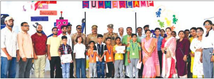
प्रमाण पत्र के साथ बच्चे मौजूद अतिथि व विद्यालय स्टाफ

उपस्थित अतिथियों और अभिभावकों का मन मोह लिया। कार्यक्रम के दौरान समर कैंप में विभिन्न गतिविधियों में उत्कृष्ट प्रदर्शन करने वाले विद्यार्थियों को प्रमाण-पत्र