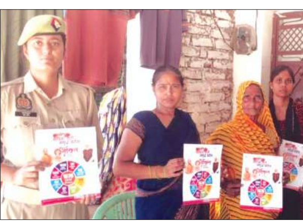
महिला सशक्तिकरण, लैंगिक अपराध, नवीन कानूनों, साइबर अपराध एवं उसके बचाव के उपायों, धरेलू हिंसा, विभिन्न हेल्पलाइन नंबरों एवं शासन द्वारा प्रचलित योजनाओं

पुलिस ने मिशन शक्ति 5.0 के तहत जागरूकता कार्यक्रम आयोजित किए। इस भीषण गर्मी में भी पुलिस शहर से लेकर ग्रामीण इलाकों में छात्राओं व महिलाओं को जागरूक कर रही है। मिशन शक्ति अभियान के तहत पुलिस की ओर से नारी शक्ति को जागरूक करने के लिए सभी थाना क्षेत्रों में महिला पुलिस कर्मी भ्रमण कर भीड़-भाड़ वाले स्थानों पर रुककर सरकार द्वारा महिलाओं की सुरक्षा के लिए चलाये जा रहे टोल फ्री नम्बरों के प्रति जागरूक किया जा रहा है। महिला थाना क्षेत्र में मिशन शक्ति टीम द्वारा महिलाओ/बालिकाओ को