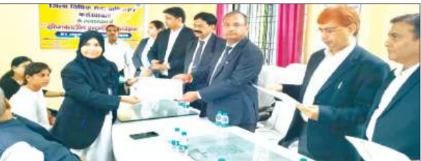
छात्रा को प्रमाण पत्र देते न्यायिक अधिकारी