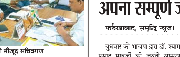
फर्रुखाबाद, समृद्धि न्यूज़।