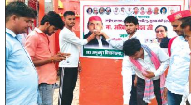
केक काटते सपा नेता