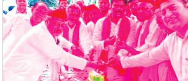
गुरुसहायगंज, कन्नौज समृद्धि न्यूज़।