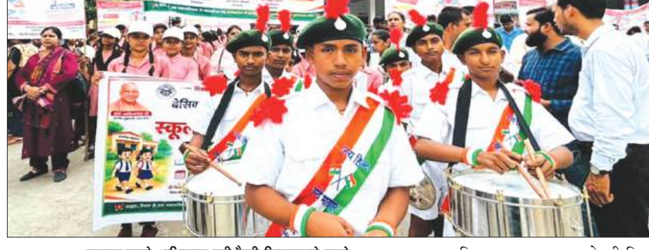
स्कूल चलो अभियान की रैली निकालते बच्चे