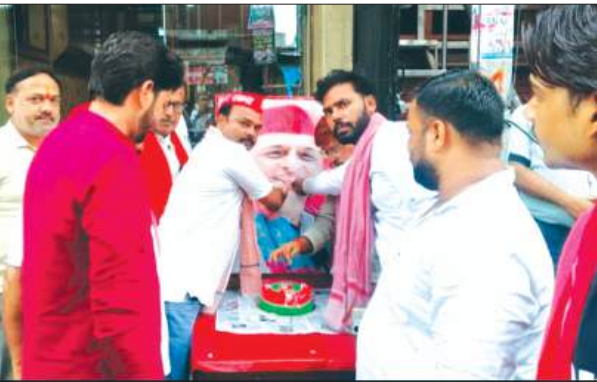
छिब्रामऊ, कन्नौज समृद्धि न्यूज़।