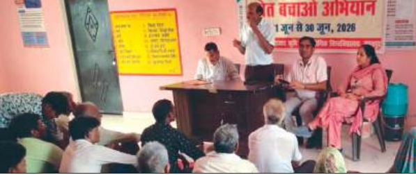
जलालाबाद, समृद्धि न्यूज़।

खेत बचाओ अभियान के तहत जून माह पर चलाए गए जागरूकता कार्यक्रमों की श्रृंखला में ग्राम बसोनापुर भाट में किसान जागरूकता गोष्ठी आयोजित की गई। गोष्ठी में किसानों को भूमि संरक्षण, उर्वरता बढ़ाने और आधुनिक कृषि तकनीकों के प्रति जागरूक किया गया।