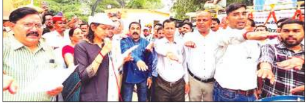
संचारी रोग नियंत्रण अभियान की शपथ दिलाती डीएम