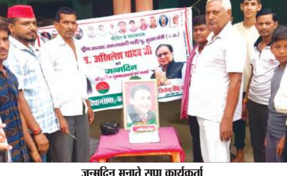
जन्मदिन मनाते सपा कार्यकर्ता