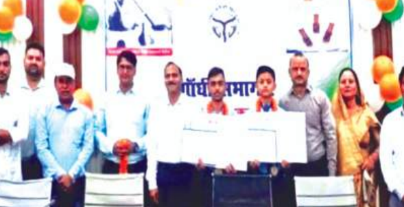
गुरुसहायगंज, कन्नौज समृद्धि न्यूज़।

माध्यमिक शिक्षा परिषद द्वारा आहूत की गई महत्वपूर्ण बैठक में जनपद कन्नौज से नगर की चर्चित संस्था आकाश एजुकेशन सेण्टर सीनियर सेकेंडरी स्कूल रामगंज गुरुसहायगंज को ही चयनित किया गया। विद्यालय की बढ़ती लोकप्रियता और हाईस्कूल के शानदार परीक्षा परिणाम के बाद संस्था को यह उपलब्धि मिली है। अन्य बोर्ड के छात्रों के प्रवेश पर हूड चर्चा परिषद की बैठक का मुख्य उद्देश्य कक्षा 10 व 12 में अन्य बोर्ड के विद्यार्थियों से आए विद्यार्थियों के सोधे प्रवेश की निर्धारित संख्या 10 पर विचार-विमर्श करना था। बैठक में