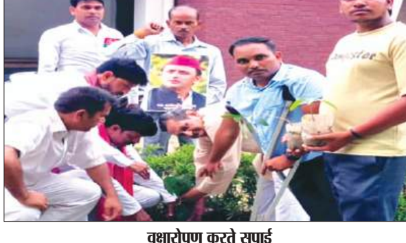
वृक्षारोपण करते साईद

फर्रुखाबाद। समाजवादी पार्टी के राष्ट्रीय अध्यक्ष एवं पूर्व मुख्यमंत्री अखिलेश यादव के जन्मदिवस पर विधानसभा अमृतपुर के सेक्टर नंबर 1 में सेक्टर अध्यक्ष कृपाल यादव द्वारा राष्ट्रीय अध्यक्ष अखिलेश यादव का केक काटकर जन्मदिन मनाया गया।