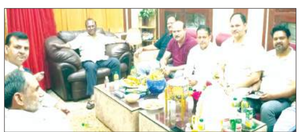
बैठक में मौजूद पदाधिकारी

हार्डस्कूल, इंटरमीडिएट के मुस्लिम मेधावी छात्र-छात्राओं को सम्मानित किया जायेगा। इसके साथ ही यू.पी. बोर्ड, सी.बी.एस.ई. बोर्ड, आई.सी.एस.ई. बोर्ड के हार्डस्कूल व इण्टरमीडिएट के जनपद टॉपर को भी सम्मानित किया जायेगा। निर्णय लिया गया कि जनपद में किसी भी प्रतियोगी परीक्षाओं में बेहतर परिणाम लाने वाले छात्र-छात्राओं को सम्मानित किया जायेगा। कार्यक्रम में सम्मानित किये जाने वाले छात्र-छात्राओं को पुरस्कार व प्रशस्ति पत्र प्रदान किये जायेंगे। इस वर्ष भी कार्यक्रम का आयोजन बड़पुर स्थित एक हाउस के ए.सी. हॉल में किया जाएगा। यह भी निर्णय लिया गया कि यू.पी. बोर्ड, सी.बी.एस.ई. बोर्ड,