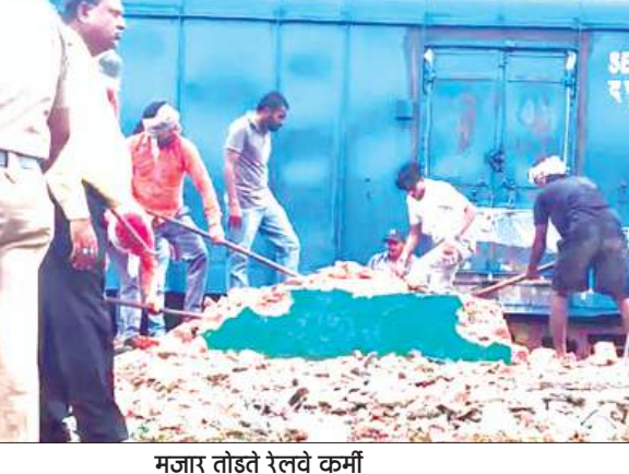
मजार तोड़ते रेलवे कर्म