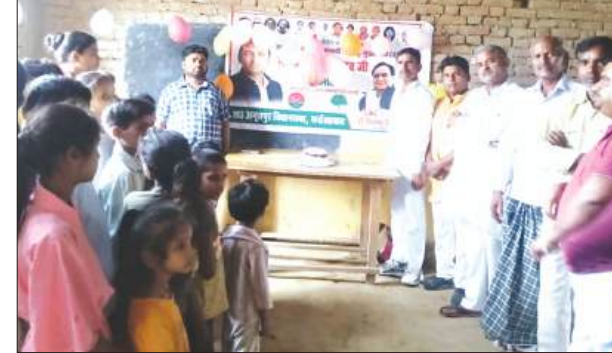
जन्मदिन मनाते सपा कार्यकर्ता