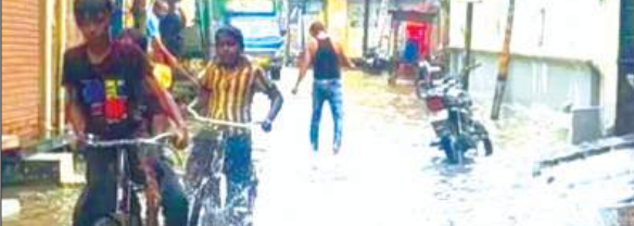
जलभराव से गुजरते लोग

धीषण गर्मी और उमस से जूझ रहे कायमगंज वासियों को मानसून की पहली बारिश ने बड़ी राहत दी। शुरू हुई तेज बारिश लगातार जारी रही। इसके बाद भी रुक-रुक कर फुहारें पड़ती रहें। बारिश के बाद तापमान गिरकर 26 डिग्री सेल्सियस दर्ज किया गया। वहीं 10 किमी प्रति घंटे की रफ्तार से चली ठंडी हवाओं ने मौसम को पूरी तरह सुहावना बना दिया। लोगों ने गर्मी से राहत की सांस ली। लगातार दो घंटे हुई बारिश से नगर के मुख्य मार्गों और रहियारी इलाकों में जलभराव हो गया। कई स्थानों पर