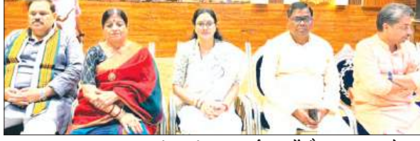
कार्यक्रम में मौजूद भाजपा नेता