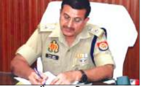
कन्नौज, समृद्धि न्यूज़।