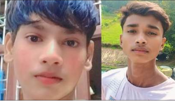
लापता युवकों का फोटो

कस्बा नवाबगंज से तीन किशोरों के एक साथ लापता हो जाने से पूरे क्षेत्र में सनसनी फैल गई है। मंगलवार दोपहर घर से निकले तीनों किशोर देर रात तक वापस नहीं लौटे, जिसके बाद परिजनों ने रिश्तेदारों और आसपास के इलाकों में काफी तलाश की, लेकिन उनका कोई सुराग नहीं लग सका। बुधवार सुबह परिजनों ने पुनः पुलिस को सूचना दी, जिसके बाद पुलिस सीसीटीवी फुटेज खंगालने में जुट गई है।