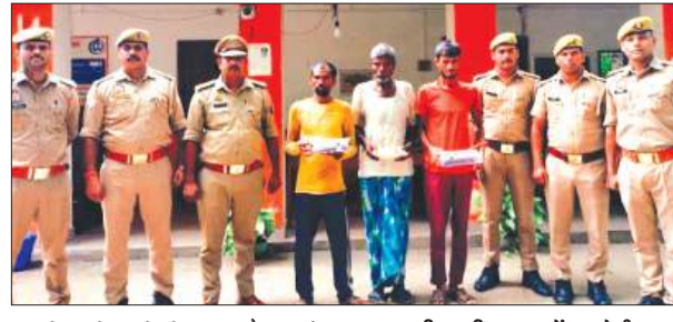
पुलिस हिरासत में आरोपी