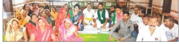
घरने पर बैठे महिलायें व बालीणा

बनीकोडर विकासखंड की कई ग्राम पंचायतों में ग्रामीणों को डिजिटल सुविधाएं उपलब्ध कराने के उद्देश्य से स्थापित किए गए इन्टरनेट वाई-फाई हॉटस्पॉट लंबे समय से बंद पड़े हैं। पंचायत भवनों में राउटर लगे होने के बावजूद इंटरनेट सेवा ठप होने से उपकरण केवल शोपीस बनकर रह गए हैं। वाई-फाई सेवा बंद होने से ग्रामीणों को आयुष्मान कार्ड, पेंशन, राशन कार्ड, प्रमाण-पत्र और अन्य भटकना सेवाओं के लिए इधर-उधर भटकना पड़ रहा है। इसका असर पंचायत स्तर पर संचालित डिजिटल सेवाओं पर भी पड़ रहा है। वहीं