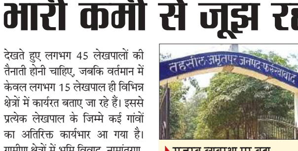
राजस्व व्यवस्था पर बढ़ा दबाव, फरियादियों को बार-बार लगाने पड़ रहे चक्कर

देखते हुए लगभग 45 लेखपालों की तैनाती होनी चाहिए, जबकि वर्तमान में केवल लगभग 15 लेखपाल ही विभिन्न क्षेत्रों में कार्यरत बताए जा रहे हैं। इससे प्रत्येक लेखपाल के जिम्मे कई गांवों का अतिरिक्त कार्यभार आ गया है। ग्रामीण क्षेत्रों में भूमि विवाद, नामांतरण, विरासत, सीमांकन, फसल गिरदावरी, आय-जाति निवास प्रमाण पत्रों के सत्यापन सहित अनेक कार्य प्रभावित होने की बात साहित्य में आई। इसी प्रकार तहसील कार्यालय की लिपिकीय व्यवस्था भी कर्मचारियों की कमी से प्रभावित बताई जा रही है। सूत्रों का कहना है कि जहां कई लिपिकों की आवश्यकता है। वहीं वर्तमान में सीमित कर्मचारियों के सहारे कार्यालय संचालित किया जा रहा है। परिणामस्वरूप फाइलों के निस्तारण में