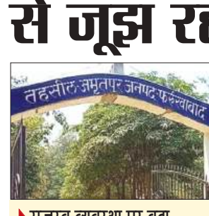
राजस्व व्यवस्था पर बढ़ा दबाव, फरियादियों को बार-बार लगाने पड़ रहे चक्कर

अपेक्षा से अधिक समय लग रहा है और कार्यालयी कार्यों पर अतिरिक्त दबाव बना हुआ है। तहसील में प्रतिदिन बड़ी संख्या में ग्रामीण अपनी समस्याओं को लेकर पहुंचते हैं। उभयजिहाती, तहसीलदार और नायब तहसीलदार शिकायतें सुनकर संबंधित मामलों में आवश्यक निर्देश भी देते हैं, लेकिन कर्मचारियों की कमी के कारण उन