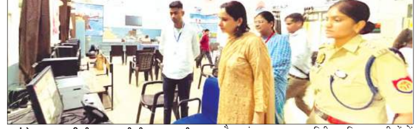
कंट्रोल रूम का निरीक्षण करती डीएम व एसपी

परीक्षा इयूटी में लगे अधिकारी एवं कर्मचारी पूरी जिम्मेदारी, निष्पक्षता एवं सजगता के साथ करें अपने दायित्वों का निर्वहन: जिलाधिकारी फर्रुखाबाद, समृद्धि न्यूज़।