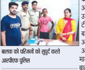
बालक को परिजनों को सुपुर्द करते आरपीएफ पुलिस