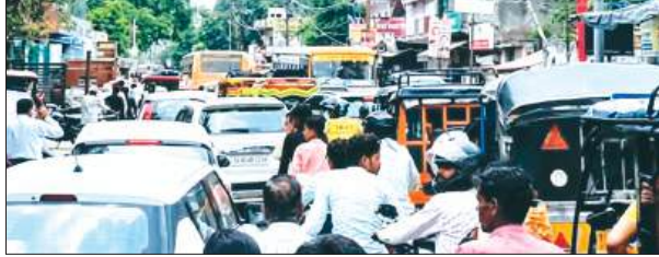
जाम में फंसे वाहन

दोपहर 12 बजे पहली पाती की परीक्षा समाप्त होते ही फतेहगढ़-फरुखाबाद मार्ग पर लंबा जाम लग गया। बड़ी विशाल ड्रिगो कॉलेज और क्रिश्चियन इंटर कॉलेज जैसे प्रमुख परीक्षा केंद्रों से यातायात व्यवस्था पूरी तरह एक साथ निकलने और अपने गंतव्यों की ओर जाने के कारण यह स्थिति बनी। देखते ही देखते बड़ी विशाल ड्रिगो कॉलेज से लेकर बहुपुर देवी मंदिर से आगे तक वाहनों की कतारें लग गईं। इस जाम में मोटरसाइकिल, स्कूटी, चार पहिया वाहन और रोडवेज की बसें भी फंस गईं, जिससे यातायात बाधित हो गया। शहर के अन्य हिस्सों में भी जाम का असर देखा गया। कादरी गेट चौराहे पर भी वाहनों के आड़े-तिरछे फंसने से जाम लग गया, जिससे पांचाल घाट की