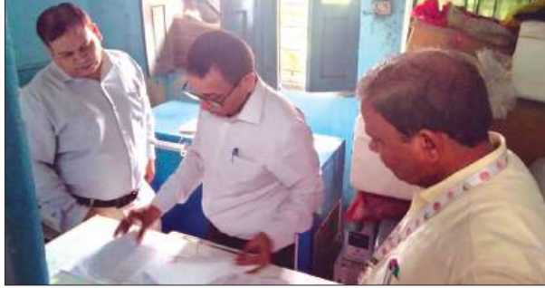
सीएचसी में अगिलेख देखते महाप्रबंधक व एसीएमओ

फ्रीजर में सुरक्षित रखी वैकसीन की जांच का भी निरीक्षण किया और उनके संरक्षण की व्यवस्था को परखा। निरीक्षण के दौरान कोल्ड चैन व्यवस्था संतोषजनक मिलने पर उन्होंने संबंधित कर्मचारियों की कार्यप्रणाली की सराहना की। उन्होंने स्वास्थ्य कर्मियों को किशोरियों में सर्वाइकल कैसर सहित अन्य गंभीर बीमारियों की रोकथाम के लिए लगाए जाने वाले एचपीवी (ह्यूमन पैपिलोमा वायरस) टीके के महत्व के बारे में भी जानकारी दी। उन्होंने कहा कि 14 से 15 वर्ष आयु वर्ग की किशोरियों को एचपीवी वैकसीन लगाना सबसे उपयुक्त समय होता है। इस आयु में टीकाकरण होने से भविष्य में सर्वाइकल कैसर जैसी