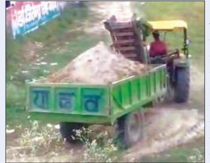
मिट्टी लेकर जाता ट्रैक्टर

खनन माफियाओं के हौसले बुलंद, नहीं रुक रहा अवैध मिट्टी खनन