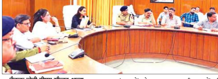
बैठक लेती डीएम मौजूद अन्य