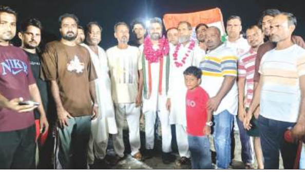
क्रिकेट उद्घाटन के दौरान मुख्यविधि व अंश