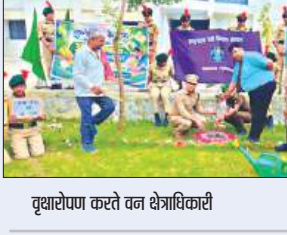
वृक्षारोपण करते वन क्षेत्राधिकारी