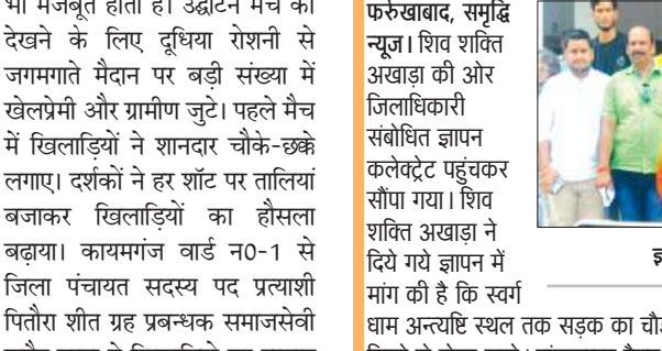
झापन देने के बाद जानकारी देते लोग