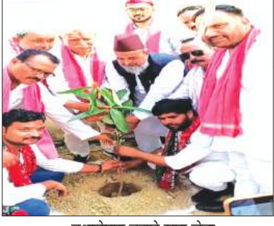
वृक्षारोपण करते सपा नेता