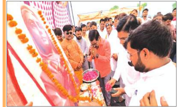
पुष्प अर्पित कर श्रद्धांजलि देते लोग