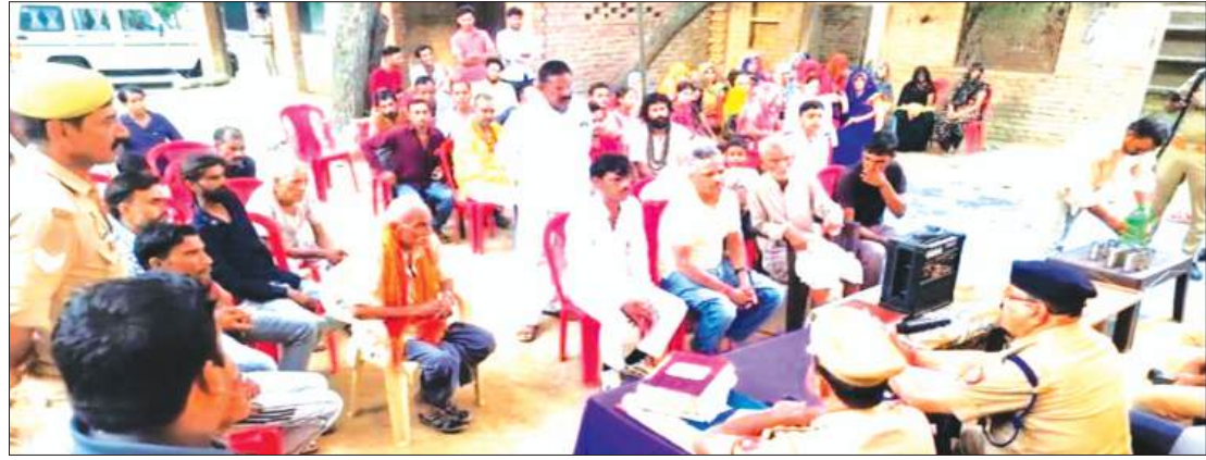
ग्रामीणों से संवाद करती पुलिस