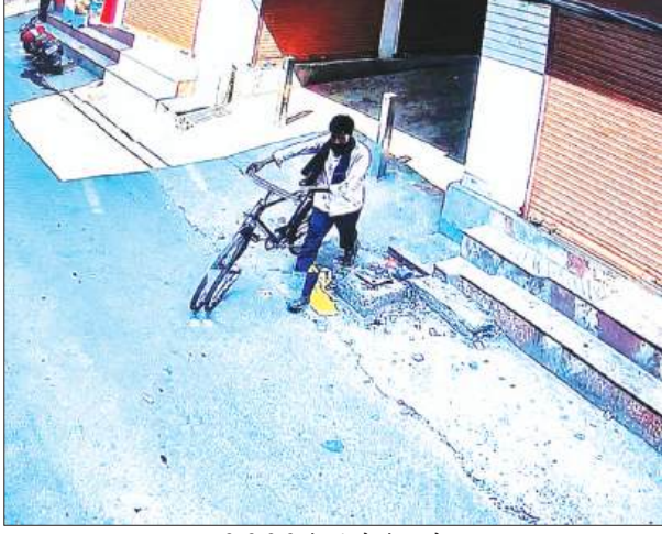
सीसीटीवी कैमरे में कैद चोर

कायमगंज, समृद्धि न्यूज़। नगर के हसन मार्केट स्थित पहला गेट के पास रविवार को दिनदहाड़े साइकिल चोरी की घटना सामने आई है। चोरी की यह वारदात पास में लगे सीसीटीवी कैमरे में कैद हो गई है।