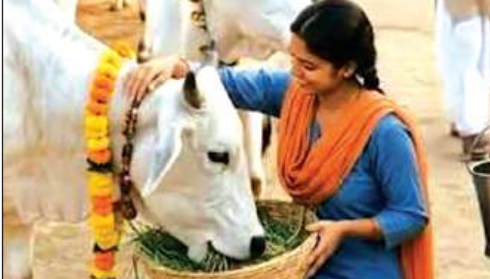
दूध तुम्हें देती है। (9.1.9) इन्द्र 'अघन्या रक्षक' (8.69.2) है तब वह और उनके अनुयायी आर्य अघन्या भक्षक कैसे होंगे? अघन्या अश्विनी देवों को भी दूध देती है। (1.164.27) गार् ऋग्वैदिक समाज में ही ऋषिपत्न्य की श्रेणी में पहुँच गई। वे सोम की स्तुति करती हैं। अथर्व. में तो खैर वे देवता हैं ही। धी, अग्नि का अत्र है। वैदिक समाज जो खाता था। अग्नि को भी जो खिलाता था। वे गाय के दूध में सोम मिलाकर इन्द्र को भेंट करते थे। एक अत्र था धाना/धान्या। वे इन्द्र को धाना खिलाते थे। (ऋ. 4.24.7) ऋषि इन्द्र से कहते हैं, प्रतिदिन पधारो, धाना खाओ। (ऋ. 3.53.7) खेती के देवता पूजन थे। वे 'करम्भ' प्रेमी हैं। माक्सवादी विचारक डॉ. रामविलास शर्मा ने बताया, करम्भ धुना हुआ अनाज था। करम्भ इन्द्र पूषन सम्भक प्रिय है। लेकिन जो साथ मिलाकर तैयार 'अपूप' अन्य देवों के साथ मरुतगण भी खाते हैं। (ऋ. 3.52.7) मैकडनल और कोथ ने एक और वैदिक व्यंजन 'पुरोडास' को 'यज्ञ की रोटी' बताया है। ऋषि इन्द्र से कहते हैं, प्रार्थना सुनो,

मृत्यु को प्राप्त होती हैं। जिस गोपति के सामने कौआ गाय के बाल नोचता है, उसकी संतानें मर जाती हैं आदि।' फिर गोहत्या के बारे में (अथर्व 12.9) कहा, 'गौधाति इस लोक और परलोक दोनों में दण्डनीय है।' ऋग्वेद (8.4.11) के एक मंत्र 'उक्षात्राय, वशात्राय, सोमपृष्यय वेधसे' के आधार पर मैकडनल और कोथ ने 'वैदिक इडेक्स' में आर्यों को गोमांस भक्षी बताया है। यहाँ ऋषि अग्नि की प्रार्थना करते हैं। उन्होंने उक्षा का अर्थ बैल तथा वशा का अर्थ गाय लगाया। उनके मुताबिक अग्नि देव मांस भक्षी हैं। इन विद्वानों ने उक्षा और वसा के साथ प्रयुक्त 'अत्राय' (अत्र) शब्दों पर गौर नहीं किया। सातवलेकर ने इसी मंत्र के अनुवाद में कहा, 'अत्र को रस से सिंचित करने वाले, अत्र को रमणीय बनाने वाले सोमपीठ अग्नि की हम उपासना करते हैं।' भारत में अत्र मांस नहीं था। 10वें मंडल के 27वें सूक्त के मंत्र 17 को भी गोमांस भक्षण के पक्ष में इस्तेमाल किया जाता है। वे मंत्र 17 के 'पीवान मेघ' का अर्थ भेड़ का पकाया जाना लगाते हैं। लेकिन लुडविग ने 'पीवान मेघ' का अर्थ जल से फूला मेघ किया है। सत्यकेतु विद्यालंकार ने बताया, 'ये मंत्र पहेलियों के रूप में हैं। यहाँ मेघ का अर्थ भेड़ न होकर मेघ राशि अभिप्रेत है... 'पीवानमेघ' का अर्थ मेघ राशि के तारा पुंज को चमकाना है।' (प्राचीन भारतीय इतिहास का वैदिक युग, पृ. 213) देवता मनुष्य की श्रद्धा है। मनुष्य अपना प्रिय खाद्य ही देवताओं को अर्पित करता है। गौधुय वैदिक समाज का प्रिय पेय है। एक ऋषि अग्नि को दूध देना चाहते हैं लेकिन उनके पास 'अघन्या गाय' है नहीं। (ऋ. 8.102.19) ऋषि इन्द्र से कहता है, अघन्या अपना