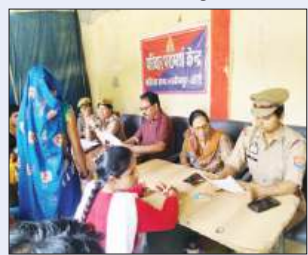
काउंसिलिंग के दौरान 5 पति-पत्नी आपसी मतभेद भुलाकर साथ रहने को तैयार हुए, जिसके बाद उनकी विवाह करार परिवारों को टूटने से बचाया गया।