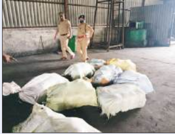
नशे के अंधे कारोबार के खिलाफ चलाए जा रहे अभियान के तहत जिला चिकित्साधिकारी एवं पुलिस अधीक्षक के निर्देशन में पुलिस ने सोमवार को बड़ी कार्रवाई करते हुए न्यायालय के आदेश पर विभिन्न मामलों में बरामद 424.100 किलोग्राम मादक पदार्थों का वैज्ञानिक विशिष्ट से निस्तारण कराया।

मीरानपुर कटरा, शाहजहांपुर। नशे के अंधे कारोबार के खिलाफ चलाए जा रहे अभियान के तहत जिला चिकित्साधिकारी एवं पुलिस अधीक्षक के निर्देशन में पुलिस ने सोमवार को बड़ी कार्रवाई करते हुए न्यायालय के आदेश पर विभिन्न मामलों में बरामद 424.100 किलोग्राम मादक पदार्थों का वैज्ञानिक विशिष्ट से निस्तारण कराया। यह कार्रवाई थाना कटरा क्षेत्र स्थित एसपी ग्रीन लाइट एनवायरमेंट वेस्ट मैनेजमेंट एलएलपी में प्रशासनिक अधिकारियों की मौजूदगी में संपन्न हुई। पुलिस के अनुसार जनपद के विभिन्न थानों में दर्ज चार मामलों से बरामद मादक पदार्थों को ऑपरेशन दहन के तहत नष्ट किया गया। नष्ट किए गए मादक पदार्थों में गांजा, डोडा पोस्ता, नशीली गोलियां व कैसूल, स्मैक (हेरोइन), अफीम तथा चरस शामिल थे। इनकी कुल मात्रा 424.100 किलोग्राम बताई गई, जिसकी अंतरराष्ट्रीय बाजार में अनुमानित कीमत करीब 1.60 करोड़ रुपये आंकी गई है। निस्तारण की पूरी प्रक्रिया न्यायालय के आदेशों और निर्धारित मानकों के अनुरूप पूरी की गई। जिला प्रशासन, पुलिस विभाग तथा प्रदूषण नियंत्रण से जुड़े अधिकारियों की निगरानी में पर्यावरणीय मानकों का पालन करते हुए मादक पदार्थों को सुरक्षित तरीके से नष्ट किया गया। कार्रवाई के दौरान संबंधित अधिकारियों ने आवश्यक अभिलेखीय औपचारिकताएं भी पूरी कीं।