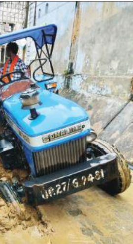
लोगों के लिए मुसीबत खड़ी कर रहे हैं और जिम्मेदार लोग सब कुछ जानकर भी अंजान बने हुए हैं। जिस कारण नागरिकों में सिस्टम में बैठे लोगों के प्रति आक्रोश व्याप्त है।