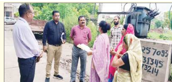
एसीएमओ ने टीम के सदस्यों से कहा कि अभियान के दौरान कोई भी पात्र बच्चा पोलियो की खुराक से वंचित नहीं रहना चाहिए। उन्होंने माइक्रोप्लान के अनुसार प्रत्येक घर तक पहुँच सुनिश्चित करने, प्रवासी परिवारों एवं उच्च जोखिम वाले क्षेत्रों