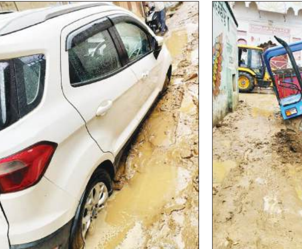
पड़ी होने से गड्डे में वाहन धंस गये। जिसके बाद इन वाहनों को निकलवाने के लिए निगम की जेसीबी मशीन तक को बुलाना पड़ा। तब जाकर गड्डे में फंसी गाड़ियों को निकाला जा सका। यह गड्डे

राज्य स्मार्ट सिटी के नाम से जाने वाले नगर निगम शाहजहांपुर में सीवर, पानी की पाइपलाइन को खोदी जा रही, सड़कों को बनाने की बात तो दूर उनकी ठीक से मरम्मत करने की भी कोई सुध नहीं ली जा रही है। जिस कारण शहर की रफ्तार खुदी सड़कों के गड्डों में रेंग रही है। इन गड्डों में आए दिन लोग गिरकर घायल भी रहे हैं। मंगलवार की सुबह हुई पहली बरसात से निगम के दवाओं की पोल खोल दी। मुख्य स्थानों में आईटीएमएस चैराहा, रोडवेज बस स्टैंड, बाइजई प्रथम समेत अन्य जगहों पर खुदी, टूटी सड़कों पर बारिश का पानी जमा हो गया। जिस कारण रहगीरो, वाहनों का निकलना दूभर हो गया। हालांकि कही कही तो नगर निगम द्वारा पॉपिंग सेट लगाकर पानी निकालने की प्रक्रिया की गई। लेकिन जिन जगहों पर पाइपलाइन को खुदी सड़कें पड़ी हुई थीं। वहाँ पर मिट्टी आदि