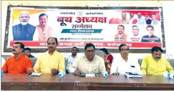
बूथ सम्मेलन कार्यक्रम में मौजूद भाजपा नेता

मंगलवार को भाजपा द्वारा जनपद की चारों विधानसभाओं में बूथ अध्यक्ष सम्मेलन आयोजित किया गया। फर्रुखाबाद एवं अमृतपुर विधानसभा का बूथ अध्यक्ष सम्मेलन जिला भाजपा कार्यालय पर आयोजित हुआ व कायमगंज विधानसभा का बूथ अध्यक्ष सम्मेलन एक गेस्ट हाउस एवं भोजपुर विधानसभा का बूथ सम्मेलन जहानगंज स्थित एक कोल्ड स्टोरेज में आयोजित हुआ। भाजपा कार्यालय पर जिलाध्यक्ष ने कहा विधानसभा चुनाव को 6 महीने