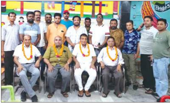
सम्मानित होते व्यापारी