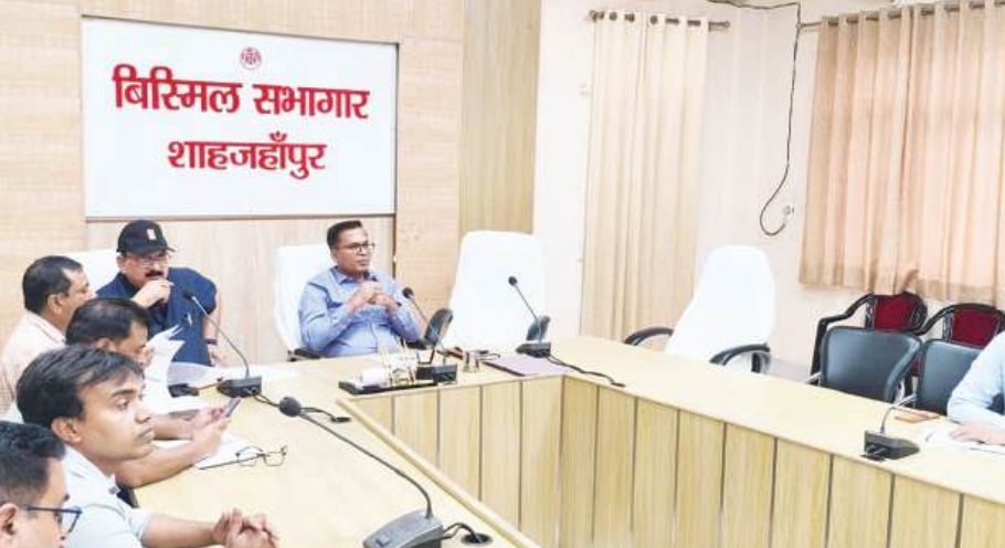
जिलाधिकारी ने सभी एमओआईसी को स्वास्थ्य केंद्रों पर समय से उपस्थित रहकर मरीजों को बेहतर उपचार उपलब्ध कराने के निर्देश दिए। उन्होंने कहा कि अभियान के दौरान स्वास्थ्य सेवाओं में किसी प्रकार की लापरवाही स्वीकार नहीं की जाएगी। बैठक में विकासखंड भावलखेड़ा और ददरौल के खंड विकास अधिकारियों को साफ-सफाई, झाड़ियों की कटाई,

जनपद में 1 से 31 जुलाई तक संचालित होने वाले विशेष संचारी रोग नियंत्रण अभियान तथा 11 से 31 जुलाई तक चलने वाले दस्तक अभियान की तैयारियों को लेकर सोमवार को कलेक्ट्रेट स्थित बिस्मिल सभागार में जिलाधिकारी धर्मेश प्रताप सिंह की अध्यक्षता में द्वितीय अंतर्विभागीय बैठक आयोजित हुई। बैठक में अभियान को प्रभावी ढंग से संचालित करने के लिए जिलाधिकारी ने संबंधित विभागों को आवश्यक दिशा निर्देश दिए। जिलाधिकारी ने सभी एमओआईसी