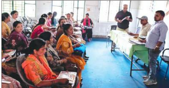
प्रशिक्षण में मौजूद आशा व एनएनएम

सामुदायिक स्वास्थ्य केंद्र में संचारी रोग नियंत्रण एवं दस्तक अभियान के सफल संचालन के लिए एक प्रशिक्षण कार्यक्रम आयोजित किया गया। प्रशिक्षण में आशा कार्यकर्ताओं, एएनएम, स्वास्थ्य कर्मियों और अन्य कर्मचारियों को अभियान के उद्देश्यों और कार्यप्रणाली की विस्तृत जानकारी दी गई। प्रशिक्षण के दौरान बताया गया कि आशा कार्यकर्ता घर-घर जाकर बुखार, खांसी, डेंगू, मलेरिया, चिकनगुनिया और जापानी इंसेफलाइटिस जैसे संचारी रोगों के संभावित मरीजों की पहचान करेंगी। इसके साथ ही वे लोगों को साफ-सफाई बनाए रखने, जलभराव रोकने,