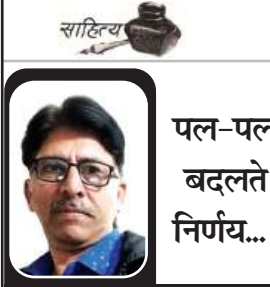
पल-पल बदलते निर्णय...!

उत्तर प्रदेश में सड़क सुरक्षा के क्षेत्र में प्राप्त ये परिणाम इस बात का प्रमाण हैं कि प्रभावी कानून प्रवर्तन, जवाबदेह प्रशासन और जनसहभागिता के समन्वित प्रयास समाज में सकारात्मक परिवर्तन ला सकते हैं। सुरक्षित सड़कें केवल बेहतर यातायात व्यवस्था का प्रतीक नहीं होतीं, बल्कि वे संवेदनशील शासन, जागरूक नागरिकों और सुरक्षित भविष्य की मजबूत पहचान भी बनती हैं। सड़क सुरक्षा की यह सतत पहल आने वाले समय में हजारों परिवारों के जीवन की रक्षा करते हुए सुरक्षित, जिम्मेदार और विकसित उत्तर प्रदेश के निर्माण में महत्वपूर्ण भूमिका निभाएगी।