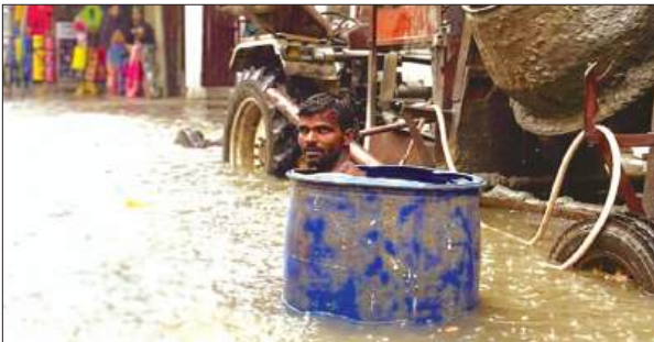
मुख्य मार्ग बना तालाब

शहर का प्रमुख रोड नितगंगा, लालसराय के पास कमर तक पानी भर जाने के कारण आवागमन बाधित हो जाता है। सुबह बच्चे स्कूल जाते हैं, उन्हें भी पानी में घुस जाना पड़ता है। कोई भी हादसा हो जाये, पर जिम्मेदार लोगों पर जू नहीं रंगती है। चंद लोग फोटो खिचाने की राजनीति