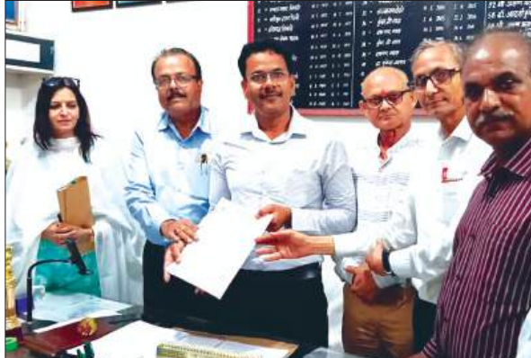
डीआईओएस को ज्ञापन सौंपते शिक्षक