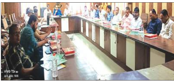
► मेडिकल अफसरों को दिया गया बाल टीबी प्रबंधन का प्रशिक्षण ► सीएमओ सभागार में राष्ट्रीय क्षय उन्मूलन कार्यक्रम के तहत कार्यशाला आयोजित

बहराइच समृद्धि न्यूज़। बच्चों में लगातार बुखार, खांसी या वजन कम होने जैसे लक्षणों को सामान्य कमजोरी मानकर नजरअंदाज करना भारी पड़ सकता है। ऐसे मामलों में बिना देरी किए समय पर टीबी की जांच करना बेहद जरूरी है। यह बात गुरुवार को सीएमओ कार्यालय सभागार में आयोजित राष्ट्रीय क्षय उन्मूलन कार्यक्रम के एक दिवसीय प्रशिक्षण सत्र में विशेषज्ञों ने कहा। वलुंड हेल्थ पार्टनर्स (डब्ल्यूएचपी) के पीडियाट्रिक प्रोग्राम के तहत जिले के मेडिकल अधिकारियों की क्षमता बढ़ाने के उद्देश्य से इस कार्यशाला का आयोजन किया गया। इस मौके पर वलुंड हेल्थ पार्टनर्स के प्रतिनिधियों सहित स्वास्थ्य विभाग के अन्य अधिकारी व कर्मचारी प्रमुख रूप से मौजूद रहे।