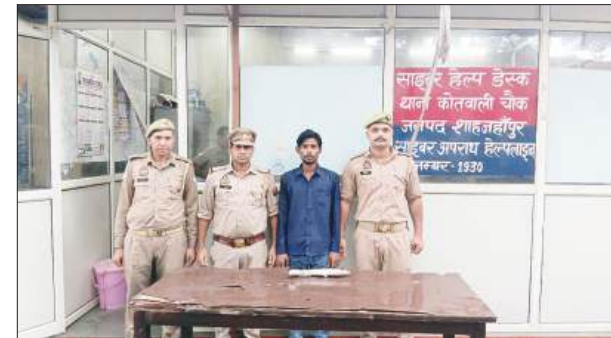
शाहजहांपुर, समृद्धि न्यूज।