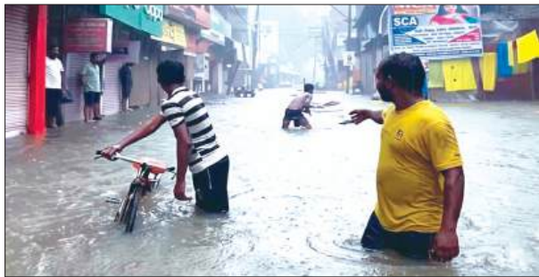
नितगंगा में गहरा बरसात का पानी

विभिन्न व्यापार मण्डल, समाजिक संघटना, राजनैतिक दल के लोग आवाज नहीं उठा रहे हैं और चुप बैठे हैं। कहीं न कहीं वह भी अपने आपको असह्य मान लिया है। शासन प्रशासन की चेतावनी के बावजूद भी पूर्ण रूप से नालों और नालियों की सफाई नहीं हुई। जिस कारण अधिकांश मोहल्लों में बारिश होते ही पानी भर जाता है।