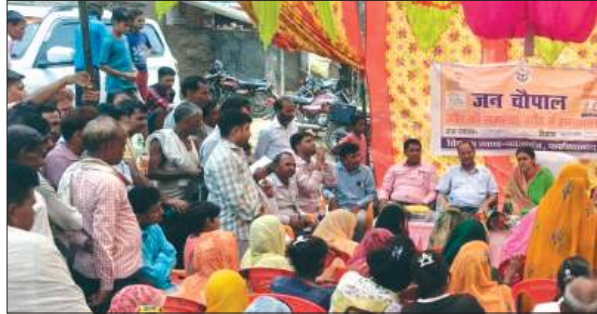
नवाबागंज, समृद्धि न्यूज़।