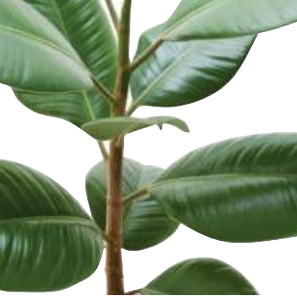
लखनऊ, समृद्धि न्यूज़।