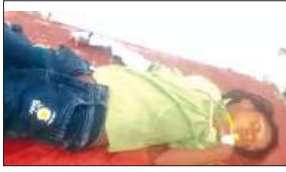
अस्पताल में भर्ती घायल

टक्कर मार दी। जिससे तीनों बाइक सवार सड़क पर जा गिरे। जिससे पिता पुत्र की मौत पर ही मौत हो गई।