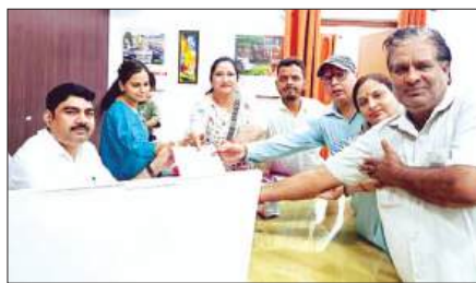
एडीएम को ज्ञापन सौंपते लोग

स्वदेशी जागरण मंच के तत्वावधान में अमेरिकी शसस्त्र बल के द्वारा 3 भारतीय नाविकों की मृत्यु के संबंध में विरोध एवं रोष व्यक्त करते हुए संयुक्त राज्य अमेरिका के राजदूत एवं अमेरिकी दूतावास को संबोधित ज्ञापन एडीएम को सौंपा। पदाधिकारियों ने मांग की कि अमेरिकी शसस्त्र बलों की कारवाही करते हुए 3 भारतीय नाविकों के प्रति दुःख प्रकट करते हुए गहरा शोक एवं चिंता व्यक्त की गई। जिसमें पदाधिकारियों ने कहा कि यह घटना भारत की जनता की भावनाओं को आहत करने वाली है तथा अंतराष्ट्रीय मानव मूल्यों अंतराष्ट्रीय मानवाधिकारों के संबंध में प्रश्न खड़े करती है, किसी समय भारत और अमेरिका के बीच वर्षों से लोकतांत्रिक मैत्रीपूर्ण संबंध रहे हैं, ऐसे में इस घटना की निष्पक्ष जांच पारदर्शी प्रकटीकरण अत्यंत आवश्यक है। जिससे संत्य सामने आए एवं पीड़ित परिवारों को न्याय मिल सके। स्वदेशी जागरण मंच का मानना है समुद्री सेना में कार्यरत नागरिक नाविकों की सुरक्षा करना सभी देशों का दायित्व है। घटना की स्वतंत्र निष्पक्ष एवं समयबद्ध जांच कराई जानी