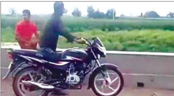
रोड पर गंगा पानी

मानसून के आगमन के साथ गंगा नदी के जलस्तर में हो रही वृद्धि को देखते हुए तहसील प्रशासन ने संभावित बाढ़ से निपटने के लिए व्यापक तैयारियां शुरू कर दी हैं। प्रशासन ने गंगा की जद में आने वाले 113 गांवों को अति संवेदनशील, संवेदनशील और सामान्य श्रेणियों में वर्गीकृत किया है। तहसील प्रशासन के अनुसार जलस्तर बढ़ने पर प्रभावित होने वाले गांवों को भौगोलिक स्थिति के आधार पर चिन्हित किया गया है। इसमें 22 गांवों को हाई फ्लड, 53 गांवों को मीडियम फ्लड, और 38 गांवों को लो फ्लड श्रेणी में रखा गया