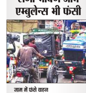
जाम में फंसे वाहन

कायमगंज, समृद्धि न्यूज़। सुबह हुई रुक-रुक कर बारिश के बाद नगर के मुख्य मार्ग पर भीषण जाम लगा गया। तहसील, मुंसिफकोर्ट और अस्पताल मार्ग पर वाहनों की लंबी कतारें लग गईं। जाम में 102 और 108 एम्बुलेन्स के फंसे से मरीजों को अस्पताल पहुंचने में खासी दिक्कत का सामना करना पड़ा। जानकारी के अनुसार सुबह से ही हो रही बारिश के रुकते ही लोग एक साथ घूर से निकल पड़े। तहसील, कोर्ट, स्कूल, कॉलेज और अस्पताल जाने वाले लोगों की भारी भीड़ सड़कों पर उमड़ पड़ी। बाइक, कार, ई-रिवशा, साइकिल और पैदल चल रहे स्कूली बच्चों की वजह से जामा मरिजद से मुंसिफकोर्ट, अस्पताल, तहसील होते हुए कस्बा चौकी तक यातायात पूरी तरह से टप हो गया। हकीम बुंदवादी के बीच जाम और बढ़ गया। सड़क के दोनों तरफवाहनों की कतारें लगा गईं और लोग घंटों फंसे रहे। सूचना मिलने पर कस्बा चौकी पुलिस मौके पर पहुंची। के पुलिसकर्मियों ने काफी मशक्कत के बाद जाम खुलवाया, तब जाकर एंबुलेन्स को सीएचसी तक भेजा जा सका। करीब 1 घंटे की मशक्कत के बाद यातायात सामान्य हो सका। पुलिस के अनुसार बारिश के समय लोगों को एक साथ न निकलने की सलाह दी गई है।