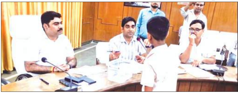
लॉटरी से पूर्ण निकाला गया

जिला पूर्ति अधिकारी ने बताया कि नगर पालिका फर्रुखाबाद और नगर पंचायत शमशाबाद क्षेत्र में कुल 03 उचित दर की दुकानें रिक्त थीं। इन दुकानों के लिए प्राप्त आवेदनों की छंटनी के बाद पात्र पाए गए उम्मीदवारों के बीच लॉटरी निकाली गई। नगर पंचायत शमशाबाद