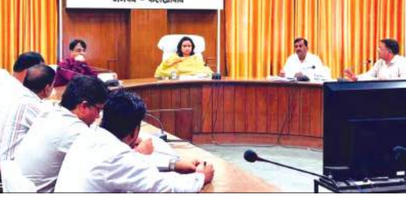
बैठक लेती डीएम

डीएम ने कहा कि जल जीवन मिशन शासन की महत्वाकांक्षी योजना है। इसके क्रियान्वयन में किसी भी प्रकार की लापरवाही स्वीकार नहीं की