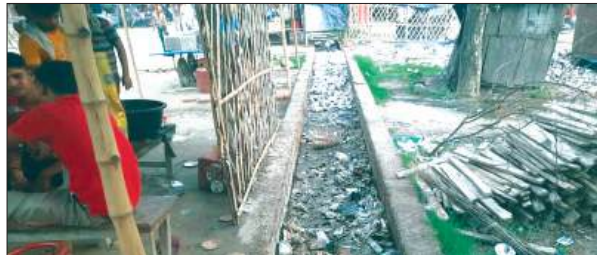
नालों में गंदगी

स्वच्छता व्यवस्था पर लाखों रुपये खर्च किए जाने के बावजूद राजेपुर क्षेत्र में सफाई व्यवस्था पूरी तरह चरमराई हुई दिखाई दे रही है। कब्जे के कई मोहल्ले और मुख्य मार्गों के किनारे बने नालों में गंदगी का अंबार लगा हुआ है। लंबे समय से सफाई न होने के कारण नालों में कूड़ा-कचरा, प्लास्टिक और सिल्ट जमा हो गई है, जिससे पानी की निकासी बाधित हो रही है। बरसात के मौसम में स्थिति और भी गंभीर हो गई है। कई स्थानों पर नालों का गंद पानी सड़कों पर फैल रहा है, जिससे लोगों को आने-जाने में भारी परेशानी