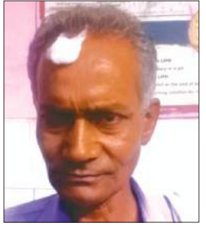
जानकारी देते पीड़ित

► पीड़ित का कहना है कि बेटा देता है धमकी