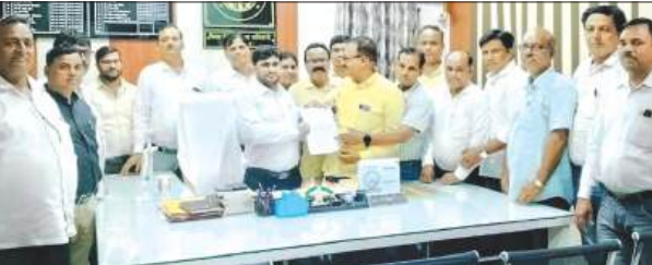
फर्रुखाबाद, समृद्धि न्यूज़।