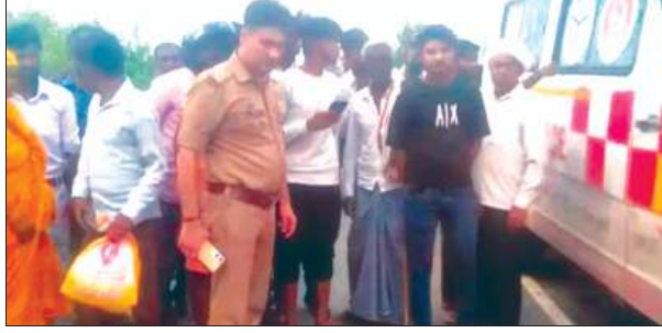
जांच पड़ताल करती पुलिस

टक्कर मार दी। जिससे तीनों बाइक सवार सड़क पर जा गिरे। जिससे पिता पुत्र की मौत पर ही मौत हो गई।