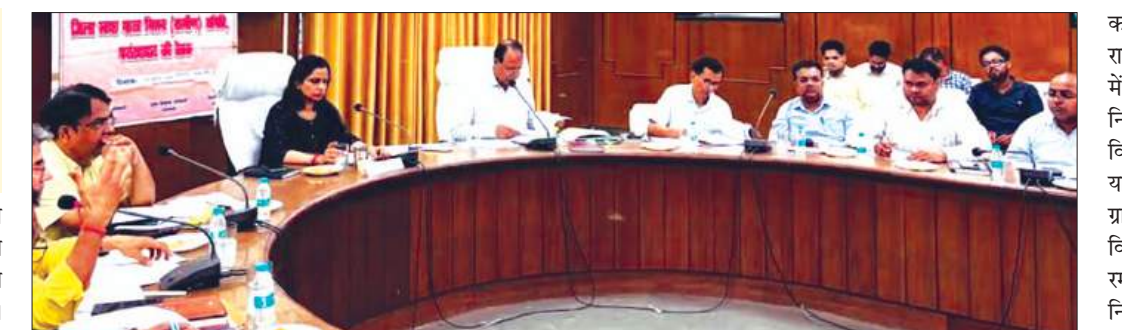
बैठक लेती डीएम मौजूद अधिकारीगण

कराया जाए तथा कार्यों की नियमित निगरानी की जाए। विकासखंड स्तर पर नामित ग्राम समितियां ग्रामीण क्षेत्र में प्लास्टिक प्रबंधन हेतु लोगों में जागरूकता संदेश प्रसारित करें। उन्होंने कहा कि आरआरसी केंद्रों के संचालन में सतौषजनक कार्य न करने वाली कार्यदायी संस्थाओं के विरुद्ध कार्रवाई करें। 15 दिवस के भीतर विकासखंड बदायूं की ग्राम पंचायत याकृतगंज, विकासखंड मोहम्मदाबाद की ग्राम पंचायत सितवनपुर पिटू एवं विकासखंड शमशाबाद की ग्राम पंचायत रम्पुरा की गौशाला में बायोगैस प्लांट को क्रियाशील करें। किसी भी स्तर पर