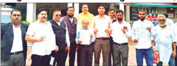
फर्रुखाबाद, समृद्धि न्यूज़।