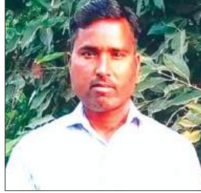
मृतक का फाइल फोटो

बहन के घर आये युवक का शव सड़िध परिस्थितियों में उस समय लटका मिला जब ग्रामीण शौच के लिए खेतों की ओर गये। ग्रामीणों ने देखा कि एक शव पेड़ से लटक रहा है और उसमें दुर्गंध आ रही है, इसकी सूचना पुलिस को दी। मौके पर पहुंची पुलिस ने शव का पंचनामा भरकर पोस्टमार्टम के लिए भिजवाया। जानकारी होने पर परिजनों में कोहराम मच गया। सूचना पर फॉरेंसिक टीम ने पहुंचकर साक्ष्य एकत्र किये। जानकारी के अनुसार